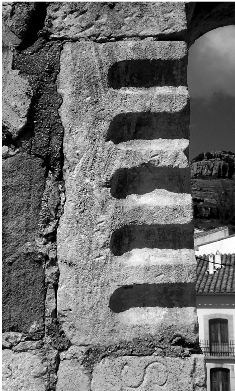
Fig. 5. Carreu pertanyent a una pilastra estriada.