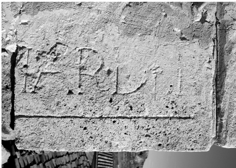
Fig. 3. Carreu amb la inscripció MAR·DER.