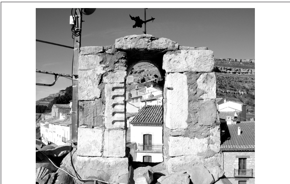
Fig. 2. Vista de l'espadanya amb les peces repartides entre els seus dos pilars.