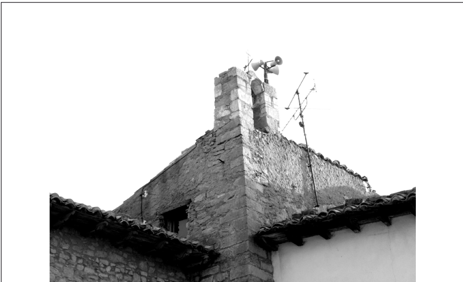
Fig. 1. Espadanya de l'ajuntament d'Ares del Maestrat.