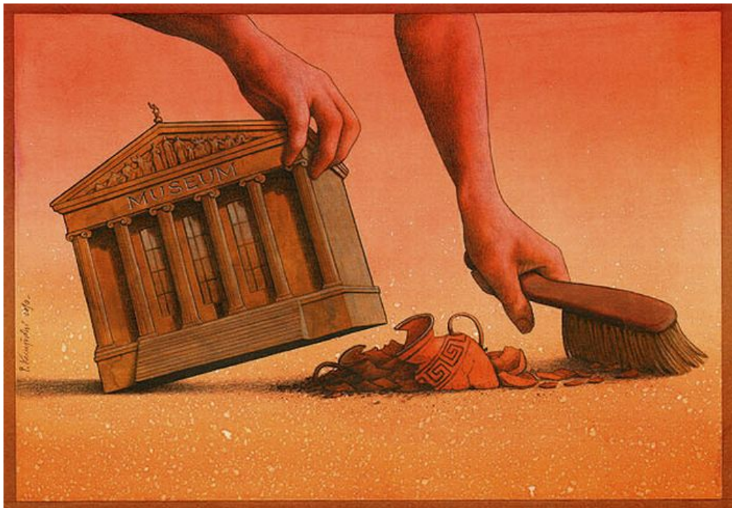
Pawel Kuczynski, Satiric Drawings