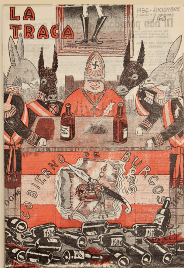
La Traca 02/12/1936

Aquest plantejament alternatiu va anar sempre contra corrent mentre els governs de la Restauració o de la Dictadura de Primo es van succeir. Però tot va canviar amb la proclamació de la Segona República. A partir de l'abril de 1931, La Traca va passar a ser un símbol més del nou règim, tan atractiu i admirat com l'himne de Riego, la bandera tricolor o la matrona amb barret frigi. I, com a símbol, va ser requerit per centenars de milers d'espanyols, que cada setmana volien seguir l'actualitat política alhora que trobar en els seus dibuixos, jocositats i invents maneres de construir una altra actualitat, la desitjada. Per la manera com va saber connectar amb els desitjos, fins als més íntims, dels lectors, s'explica en bona mesura el seu gran èxit, el més destacat en la història de la premsa espanyola fins a l'arribada d' Interviú .