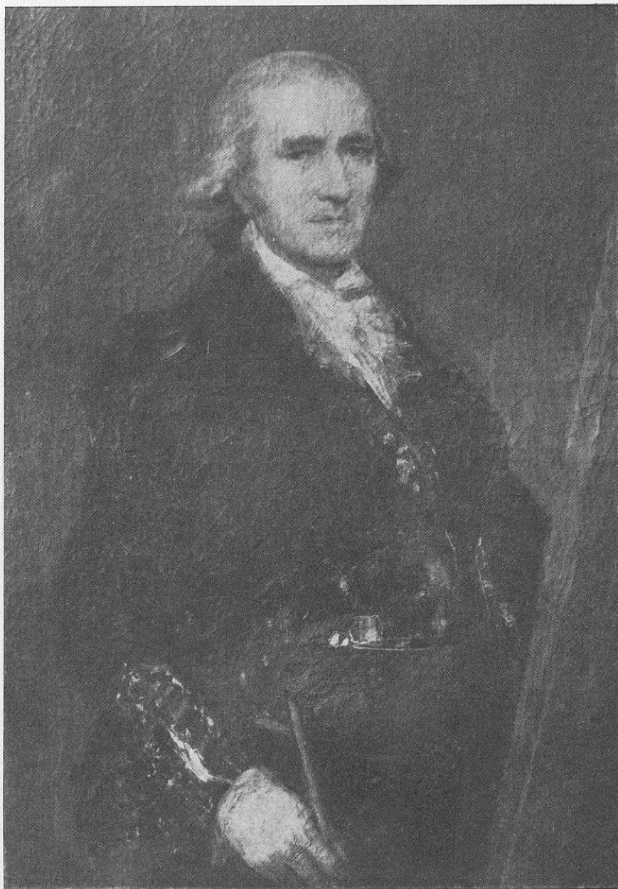
Retrato del pintor Francisco Bayeu