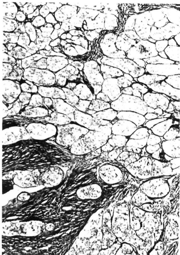
Figura 3. Tinción de Reticulina. Dibujo de los nidos tumorales y canales vasculares entramados con fibras de reticulina (20 X).

En las pruebas de inmunohistoquímica encontramos células con débil positividad a la Actina, la Desmina y la Proteína S-100 (Fig. 4).