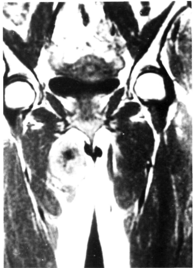
Figura 2. RNM de la pelvis y muslos. En la imagen T 1 se delimita perfectamente la tumoración a nivel del tercio superior del muslo derecho.

ción, estaba totalmente encapsulada y no infiltraba macroscópicamente los tejidos vecinos, extrayéndose con un margen quirúrgico «amplio», y no resecando el compartimento muscular.