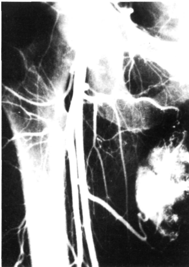
Figura 1. Arteriografía del tumor, donde se aprecia la riqueza de vasos que lo nutren.

Clínicamente presentaba una tumoración de unos 7x5 cm. cuyo diámetro mayor era paralelo a la diáfisis del muslo. La tumoración era dura, indolora y totalmente deslindada del hueso y la piel. No se observaba circulación colateral ni existía aumento de calor local, ni cambio de coloración. Tampoco presentaba alteraciones en las exploraciones neurológica y vascular distales del miembro afecto. La movilidad de la cadera y rodilla derechas eran normales. Como pruebas diagnósticas se efectuaron, con este orden: radiografías simples en proyecciones AP y L. tomografías simple en proyección AP, arteriografía (Fig. 1), gammagrafía ósea de barrido con Tc^{99} , TAC y RNM (Fig. 2). Con estas pruebas se delimitó perfectamente la tumoración, pero no se pudo llegar a un diagnóstico con certeza, sobre todo en cuanto a su benignidad o malignidad. Por ello se practicó una punción biopsia, cuyo estudio no reveló signos de malignidad. Se decidió realizar una biopsia a cielo abierto, y para prevenir una posible hemorragia en el campo quirúrgico, se embolizó selectivamente la nutrición arterial del tumor. A los tres días, se intervino quirúrgicamente practicando una biopsia peroperatoria, que tampoco dio signos de malignidad, extirpándose la tumoración en su totalidad. Dicha tumora-