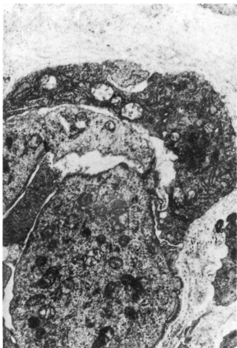
Figura nº 2: Yema vascular de prominentes endotelios y pericitos, presentando estos claros signos de activación.

obtenidas en el M/E, lo fueron en placas de vidrio Kodak.