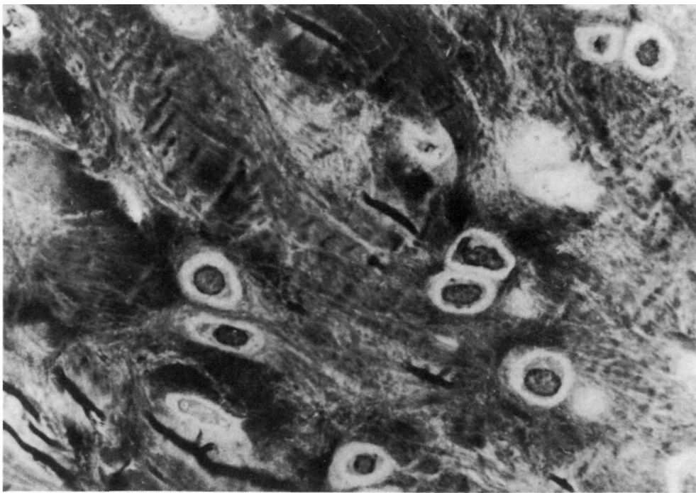
Figura nº 3: Aspecto en corte semifino del tejido neoformado, en el que se aprecia un tejido fibrocartilaginoso, constituido por elementos condrocitarios dispuestos entre abundantes fibras colágenas.

sidera que esta reparación ocurre a partir de la membrana sinovial, y que el carácter del tejido neoformado, es de tipo fibroso, recordando macroscópicamente al menisco normal. KIM y MOON, en 1979 (5), observaron que la sinovial era fundamental para la regeneración meniscal en conejos, ya que tras practicar sinovectomías en la rodilla del animal con meniscectomías, el menisco no se regeneraba. Estos autores también observaron que el tejido neoformado era de tipo fibroso, sin presencia de células cartilaginosas.