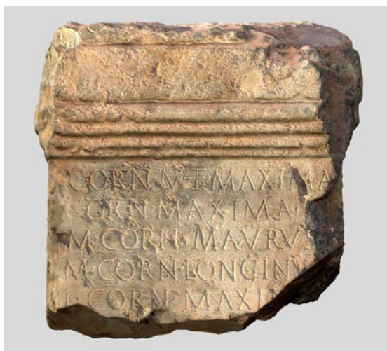
Fig. 2: Vista frontal de la inscripció.

lletres i fins i tot les corresponents de la quarta. Per davall es veu l'extrem superior d'algunes lletres de la sisena línia. Presenta trencalls en els angles davanters que afecten el final de les tres primeres ratlles, tot i que la segona es troba sencera, i més importants en els laterals que afecten la cornisa. El camp epigràfic està ben allisat i presenta alguna ratlla incisa, però en general es troba ben conservat. Les altres cares conserven restes de morter adherit, per haver estat emprat com a material de construcció. Les cares laterals i tota la part superior motllurada estan allisades de manera un poc més grollera, i la posterior simplement desbastada. El monument devia ser d'una sola peça, ja que el dau i la cornisa formen part del mateix bloc.