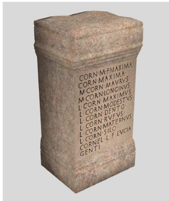
Fig. 5: Restitució infogràfica del monument amb la dedicatòria completa.

La inscripció es coneix des de 1492, quan apareix esmentada per primera vegada en el manuscrit de P. M. Carbonell conservat a l'Arxiu Capitular de Girona. Des d'aleshores i durant els ss. XVI-XVII fou citada en diverses ocasions en nombrosos manuscrits que han estat revisats per diferents autors ( CIL II 2 /14, 644; IRPV IB 420; Gimeno 1997: 187, núm. 658). La seua primera aparició en una obra impresa fou en 1563, en la segona edició castellana de la Crònica de P. A. Beuter (1563, I: 33), qui explica: "Specialmente hay una piedra de los Cornelios en una fabrica que queda de un templo que solia ser agora sirve de yglesia de los frayles de la Trinidad, que estan escritos diez Cornelios alli nombrados con sus diferencias de sobrenombres". A esta primera menció seguiran les dels historiadors G. Escolano (1611: 469) i F. Diago (1613: 82).