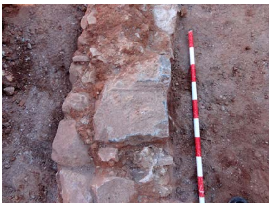
Fig. 1: El monument en el lloc de la troballa.