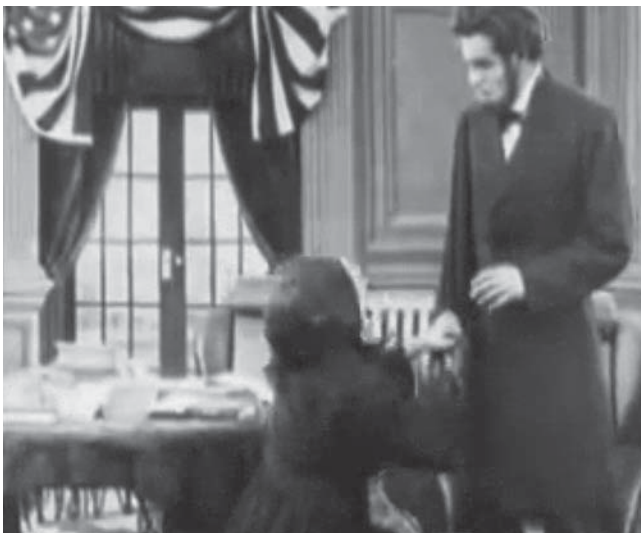
Imagen 7. When Lincoln Paid (Francis Ford, 1913)

atender al contexto que suele eclipsar esta concepción. El uso del cine narrativo como herramienta de unificación social no resulta exclusiva de Griffith. Tenemos el ejemplo de varios cortometrajes, anteriores a El nacimiento de una nación , con una situación y fines similares. Nos fijaremos aquí en uno de ellos, When Lincoln Paid , dirigida en 1913 por Francis Ford (hermano mayor de John Ford), quien también interpreta al presidente. El film (perdido durante décadas y descubierto en 2006) nos muestra en una secuencia a la madre de un soldado de la Unión que ruega por el perdón de un soldado confederado en el despacho presidencial. La mujer se arrodilla implorando el indulto (imagen 7). Acto seguido, Lincoln consulta el caso con su asistente y le comunica a la mujer su perdón. En la secuencia de Griffith, por el contrario, la mujer se arrodilla cuando Lincoln está sentado ya en su escritorio firmando el indulto. Pese a que en El nacimiento de una nación es una mujer del bando contrario la que pide ayuda, el presidente tarda menos en atenderla, con lo que el gesto de la mujer ya no es de súplica sino de agradecimiento (imagen 8). El detalle es importante porque delata que si bien Griffith está participando de un proceso general en la escritura de la historia por parte del cine, le añade una dimensión más compasiva que refuerza el aura mítica de Lincoln.