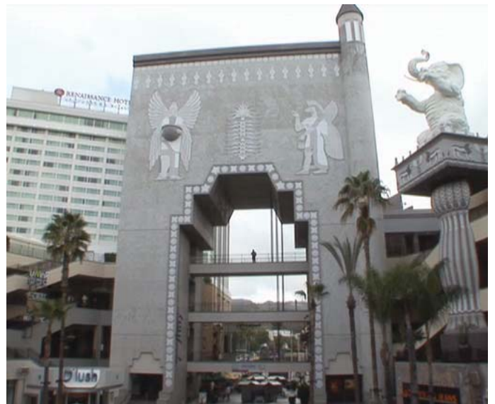
De izquierda a derecha y empezando por arriba: Imagen 21. Cabiria (Giovanni Pastrone, 1914). Imagen 22. Good morning Babilonia (Paolo & Vittorio Taviani, 1987). Imagen 23. Intolerancia . Imagen 24. Centro comercial Hollywood and Highland, tal y como aparece en The Story of Film: An Odyssey (Mark Cousins, 2011)