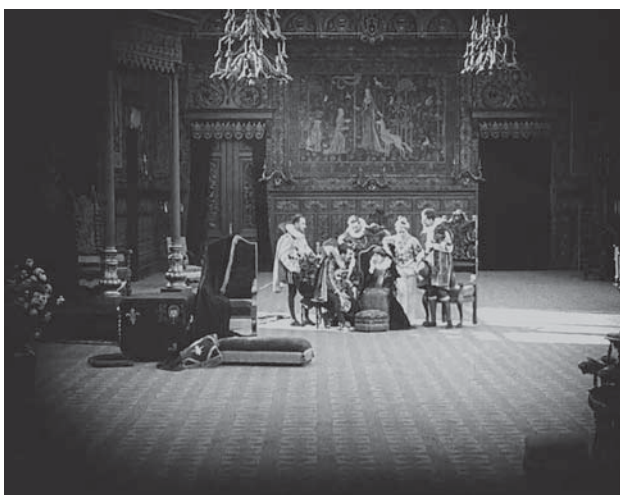
En la parte superior, imagen 10. El nacimiento de una nación . En el centro y parte inferior, imágenes 11 y 12. Intolerancia (Intolerance) (D. W. Griffith, 1916)

El contraste es esclarecedor si comparamos este plano con dos secuencias de Intolerancia . En la primera vemos a un magnate, el hermano de la Srta. Jenkins, una de las auspiciadoras del lobby que critica la película. El empresario accede a entregar fondos para acometer la campaña moral con lo que es el auténtico antagonista del episodio contemporáneo. Su despacho ocupa el centro de una estancia inmensa. Está solo, en el centro del plano y filmado a distancia para que seamos más conscientes de su aislamiento (imagen 11). Es un plano desolador, símbolo de la actitud sexual y espiritual de la cruzada de la Srta. Jenkins (Jesionowski, 2005: 68). La segunda secuencia pertenece al episodio de los hugonotes. La corte de Carlos IX también está filmada en algunos planos a lo lejos, con Catalina de Médici sentada en el centro y rodeada de cortesanos que apenas llenan la enorme dependencia palaciega (imagen 12). Se está pergeñando en ese momento el asesinato de los protestantes y Griffith vuelve al mostrar el poder opresor como un ente distante.