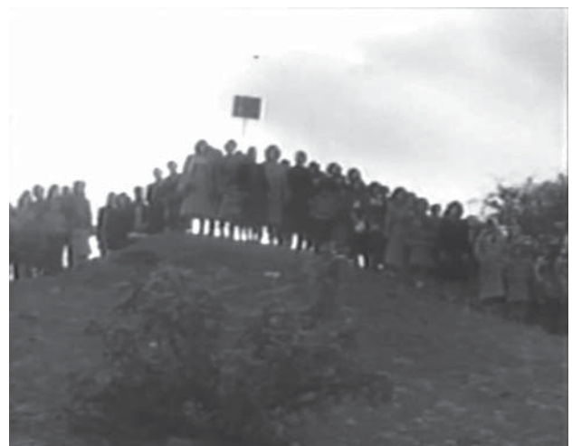
En la parte superior, imagen 15. Intolerancia . En el centro y parte inferior, imágenes 16 y 17. La sal de la tierra ( Salt of the Earth ) (Herbert J. Biberman, 1953)