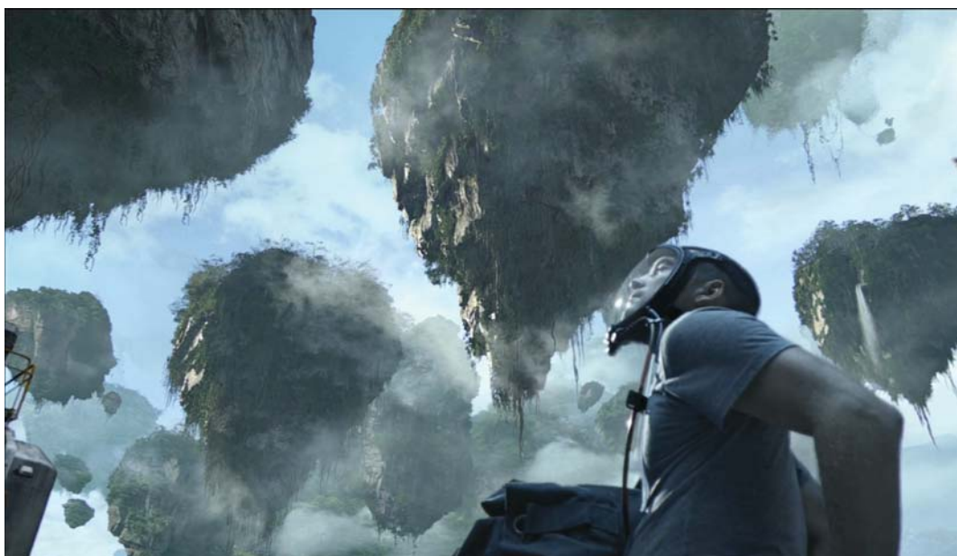
Imagen 25. Avatar (James Cameron, 2009)

mineral muypreciado por la potencia estadounidense. La expedición de los militares, por lo tanto, se realiza para expulsar a la fuerza a los extraterrestres de su hogar. A medida que el protagonista del film vaya conociendo a los aborígenes de Pandora, irá tomando conciencia para acabar posicionándose a su lado y luchando contra el ejército estadounidense. Una estrategia discursiva, la del antiamericanismo, habitual en el cine mainstream contemporáneo porque, como señala Elsaesser (2011: 253), responde a la voluntad de llegar a todo tipo de mercados en todo el mundo, «un instrumento del arsenal de Hollywood para mantener su dominio mundial». Además, este supuesto antiamericanismo persigue la desmovilización política porque, siguiendo a Žižek (citado por Elsaesser, id. : 250), películas como Avatar crean una identificación simple con una lucha idealizada en un mundo de ciencia ficción para dar la espalda a los conflictos en el mundo real. Es el sostenimiento de la pax americana aunque sea a costa de crear una ilusión crítica desconectada de la realidad. Una artimaña, la de la fascinación visual que camufla una ideología específica de dominación, que muestra la victoria del Griffith de El nacimiento de una nación e Intolerancia en el cine contemporáneo.