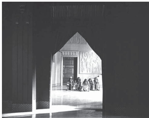
Imágenes 18, 19 y 20. La mujer del faraón ( Das Weib des Pharaos ) (Ernst Lubitsch, 1922)

La situación resulta ridícula por su exageración: no basta con una sencilla reverencia, ya que se tiene que mostrar la sumisión total ante quien ostenta el poder absoluto. El recurso a lo grotesco por parte de Lubitsch le permite, por un lado, apuntar a un ejercicio arbitrario del poder que provoca temor en quienes se aproximan al mandatario y, por otra parte, mofarse desde el principio del faraón y su boato para ir más allá de la obra de Griffith. El acto de desvelamiento de Lubitsch no se conforma con mostrar los abusos del poder a través de la representación de los conflictos. Su propuesta consiste en un juicio más explícito para reírse de los mecanismos de sometimiento cotidianos, del poder en sus principales manifestaciones, ya sea en las grandes decisiones políticas o en las relaciones de pareja y las distinciones de clase, como se hará muy evidente en sus películas norteamericanas posteriores. Es en esa arbitrariedad de los comportamientos e incluso de las situaciones (algo que