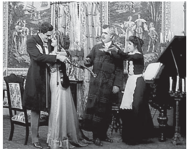
De izquierda a derecha y empezando por arriba, imágenes 1, 2, 3 y 4. The Voice of the Violin (D. W. Griffith, 1909)

es el esperado: el joven inmigrante tendrá que colocar el explosivo en nombre de la igualdad y la abolición de las diferencias de clase que se lee en los carteles colgados en las paredes del cuartel general terrorista (imagen 1).