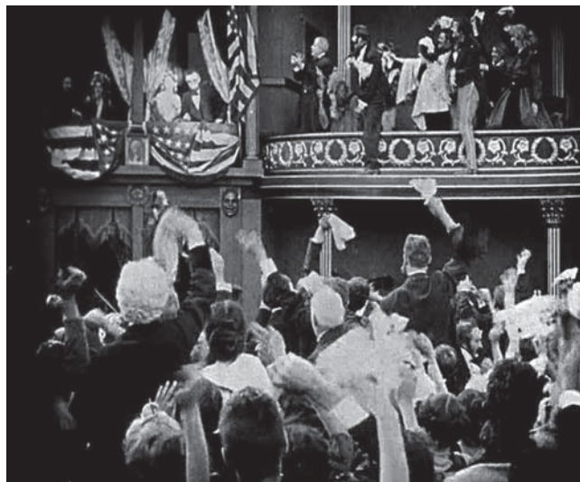
Imágenes 5 (izquierda) y 6 (derecha). El nacimiento de una nación ( The Birth of a Nation ) (D. W. Griffith, 1915)