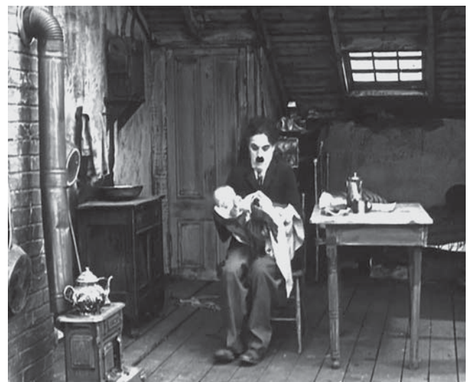
A la izquierda, imagen 13. Intolerancia . A la derecha, imagen 14. El chico ( The Kid ) (Charles Chaplin, 1921)