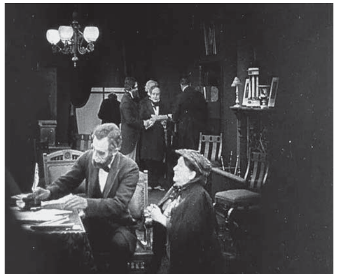
Imagen 8. El nacimiento de una nación