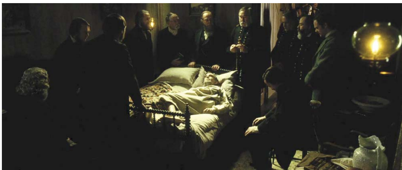
Imagen 9. Lincoln (Steven Spielberg, 2012)

No resulta extraño, de este modo, que El nacimiento de una nación fuera una de las primeras películas proyectadas en la Casa Blanca. El presidente Woodrow Wilson había excusado su ausencia del estreno público por el luto de su mujer, fallecida meses atrás, en agosto de 1914, y las reacciones tras el pase privado formarían también parte de la leyenda. Según se ha ido repitiendo desde entonces, Wilson declaró al acabar la proyección que había visto un ejercicio de historia y que lo único malo del film es que lo narrado seguía de plena actualidad. Pese a que no hay pruebas de que Wilson pronunciara esas palabras (McEwan, 2015: 80-81), el apoyo que supuso la celebración de aquella velada con la presencia de Griffith dio carta de naturaleza a su obra. El éxito del relato instaurado por el cineasta contaría, casi cien años después, con una clara resonancia cuando en 2012 la Casa Blanca acogió otro pase de privado de una película sobre el mítico presidente. Cambiaban en esta ocasión los agentes: el presidente era Barack Obama, Steven Spielberg, el director y directamente Lincoln , el título de la cinta. Seguían intactos, eso sí, dos rasgos: la narración elogiosa de Abraham Lincoln a través de una puesta en escena mitificadora (como el plano de su lecho de muerte de la imagen 9) y la voluntad de evitar una fractura social ante la campaña difamatoria de la derecha contra la existencia de un presidente negro.