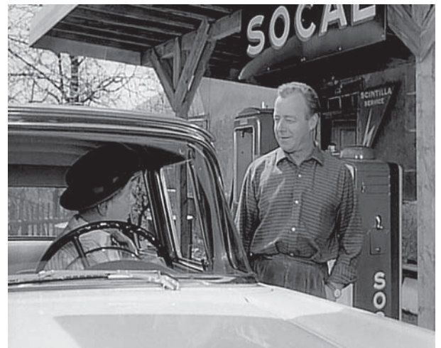
La imagen de la izquierda presenta a Heinz Rühmann en El trío de la bencina . ( Die drei von der Tankstelle , Wilhelm Thiele, 1930). A la derecha, un plano análogo de El cebo