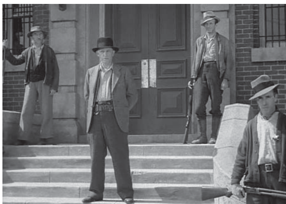
Los dos planos de la izquierda corresponden a Furia ( Fury , Fritz Lang, 1936). A la derecha, planos análogos de El cebo

Se suele mencionar M, el vampiro de Düsseldorf ( M , Fritz Lang, 1931) como antecedente de El cebo . El título con el que se estrenan ambas en Italia es paradigmático del paralelismo buscado: M, il mostro di Düsseldorf , la de Lang, e Il mostro di Magendorf , la de Vajda. Las diferencias entre ambas son más que notables, sobre todo porque la película de Vajda focaliza la acción en el perseguidor y no en el perseguido. Otra película de Lang está en el origen de la escena del linchamiento: Furia ( Fury , Fritz Lang, 1936). Vajda ya había citado esta dependencia durante el