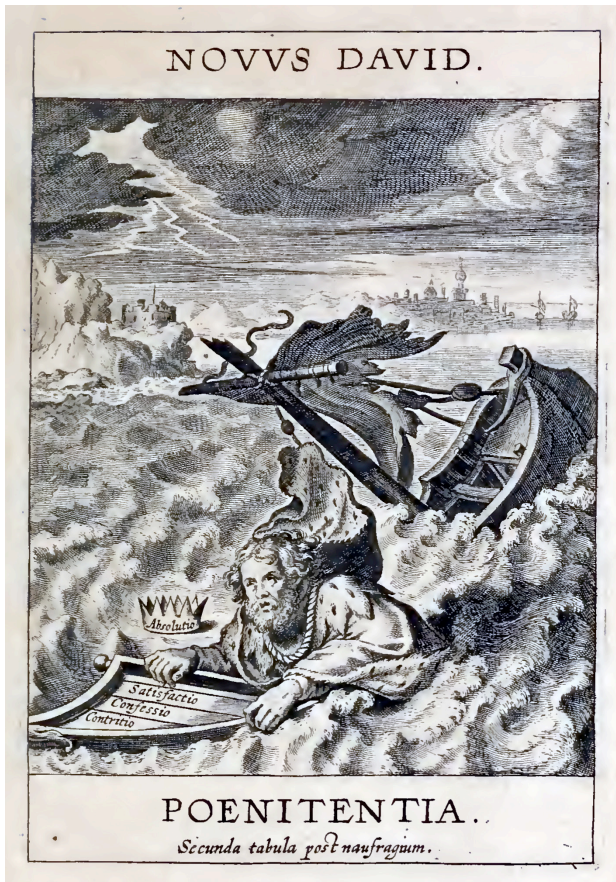
5. Novus David . Sacrum oratorium de Pedro Bivero, Amberes, 1634

se aferra al arpa como salvavidas. En las cuerdas del arpa aparecen inscritas las palabras « contritio / confessio / satisfactio », las tres disposiciones necesarias para que el alma arrepentida alcance la absolución, recompensa identificada simbólicamente con la corona.