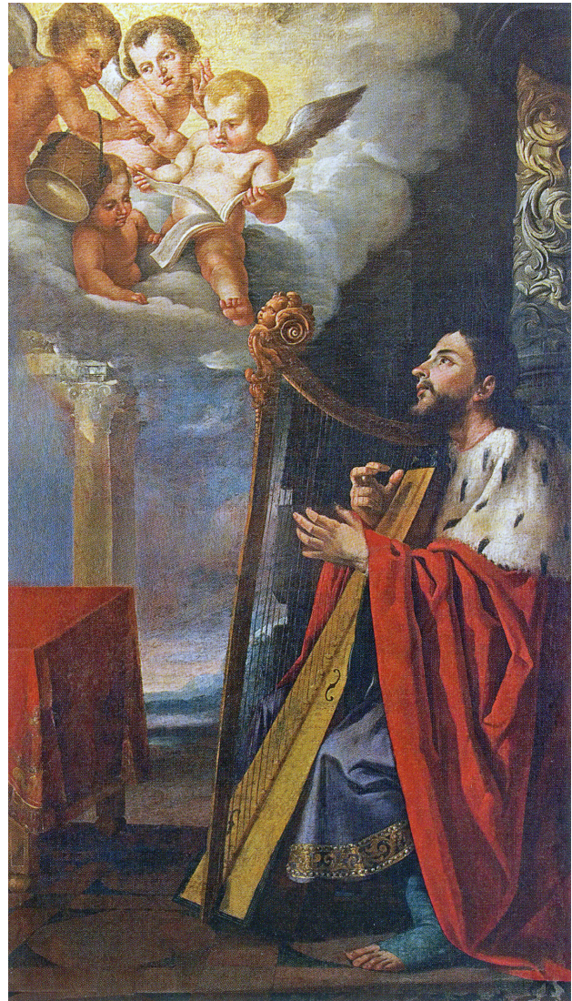
1. Pablo Pontons, David penitente . Iglesia Arciprestal de Santa María, Morella, 1685

En David toca el arpa para calmar a Saúl [2] , la escena vuelve a tener lugar en un espacio arquitectónico áulico, ante la presencia del rey Saúl y un número de sus soldados que asisten al momento en el que joven pastor toca la lira. El fondo arquitectónico permite que de forma natural la luz se concentre en David, dando la impresión que emana de él. Por otro lado Saúl, situado bajo un palio, permanece en la penumbra mientras vemos salir de su cabeza la figura de un pequeño demonio. Una diagonal imaginaria une el rostro de Saúl y David pasando por los otros dos personajes que