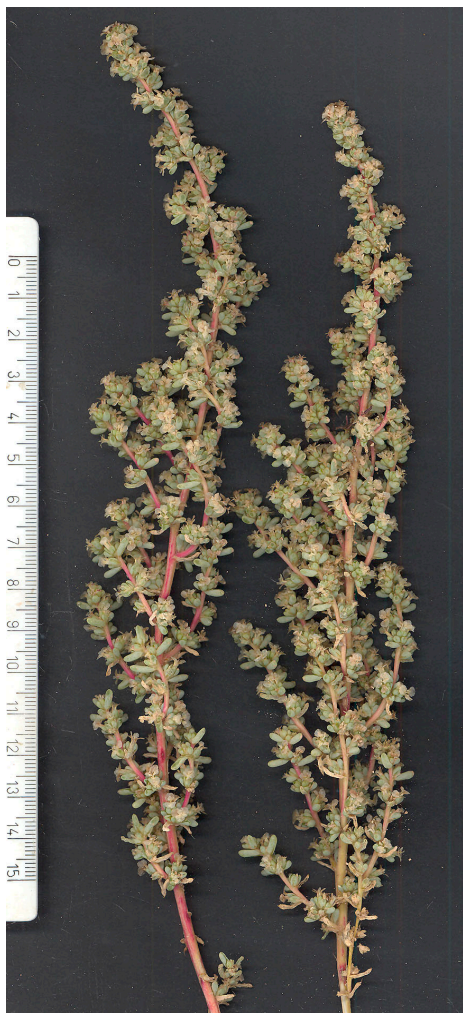
Fig. 1. Halogeton sativus , procedente de Alcora (Castellón)

Otra especie tropical termófila, que se conoce como naturalizada en muchas zonas bajas de la provincia, que se interna, a través de la cuenca del Júcar, alcanzando la localidad más interior hasta ahora conocida.