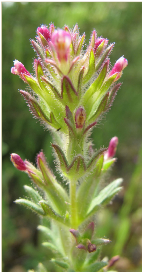
Fig. 3 Parentucellia latifolia , procedente de Jalance (Valencia).

encontró en la Laguna de San Benito, que habitualmente permanece seca y totalmente ocupada por cultivos, cuando recuperó temporalmente la lámina de agua tras una excepcional tormenta ocurrida en agosto de 2015, y que se mantuvo hasta mediados de octubre de ese mismo año.