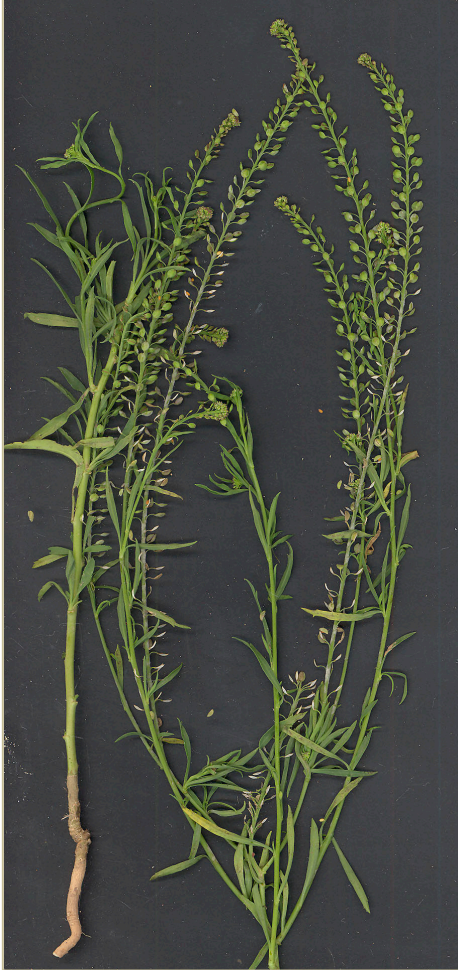
Fig. 2. Lepidium ruderales , recolectado en Buñol (Valencia)

No aparece indicada esta especie en la provincia, ni en el BDBCv ni en el vol. 1 de Flora Valentina . Lo cierto es que la población, aunque bien asentada, lo hace en una zona recientemente removida para infraestructuras deportivas.