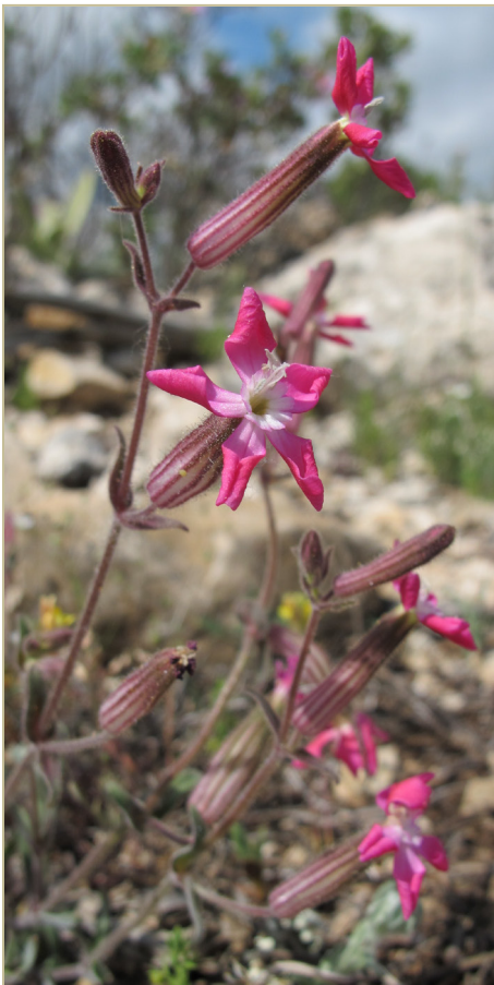
Fig. 4. Silene psammitis , procedente de Jarafuel (Valencia).

VALENCIA: 30SXJ5934 , Jarafuel, Muela de Juey, 1003 m, claros de matorral con pino carrasco, 12-V-2013, M.P. (VAL 219967) (fig. 4); 30SXJ6045 , Cofrentes, Borregueros, 753 m, ibid. , 24-V-2013, M.P. (v.v.); 30SXJ6036 , Jarafuel, Muela de Juey, 958 m, ibid. , 27-V-2013, M.P. (v.v.); 30SXJ6135 , ibid. , 978 m, ibid. , 20-VI-2013, M.P. (v.v.); 30SXJ5634 , Jarafuel, fuente de las Doncellas, 930 m, umbría de pinar con más densidad de vegetación, 27-VI-2013, M.P. (v.v.); 30SXJ6137 , Jarafuel, Muela de Juey, 955 m, claros de matorral con pino carrasco, 30-IV-2015, M.P. (v.v.).