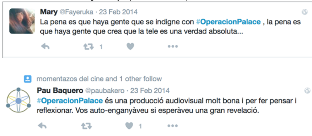
Imagen 03: Ejemplos del marco “Espectador crítico”

[#OperacionPalace es una producción audiovisual muy buena y para hacer pensar y reflexionar. Os autoengañábais si esperabais una gran revelación.]