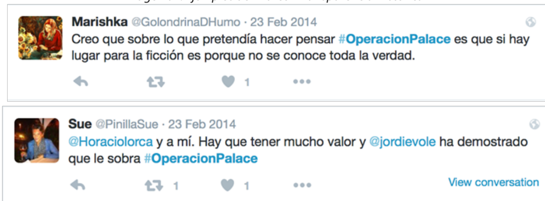
Imagen 04: Ejemplos del marco "Transparencia Histórica"