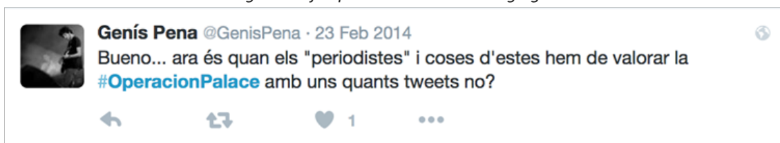
Imagen 08: Ejemplo irónico de reacción gregaria

[Bueno... ahora es cuando los "periodistas" y cosas de estas tenemos que valorar la #OperaciónPalace con unos cuantos tweets, ¿no?]