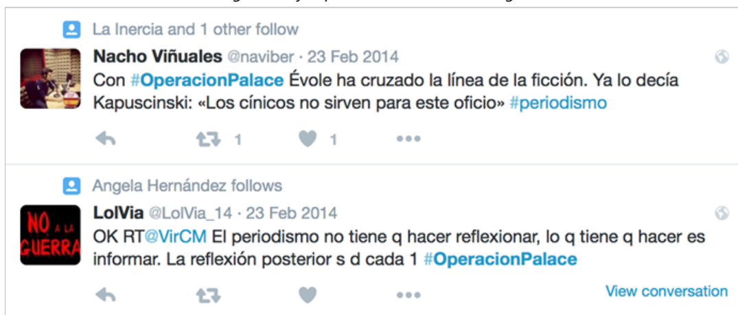
Imagen 01. Ejemplos de marco “Deontológico”

Como sugeríamos, las interpretaciones acerca del programa presentes en los frames localizados en las redes se sustentan en argumentaciones análogas a las encontradas en las piezas de prensa, por lo que podemos sostener que hay marcos interpretativos comunes en ambos soportes discursivos. A grandes rasgos, el frame “deontológico”, que evaluaba de forma negativa Operación Palace por romper el pacto de credibilidad con el espectador y que había tenido mucha presencia entre los opinadores, y especialmente los profesionales del periodismo, también se encuentra entre los tweets analizados. Su limitada aparición –en contraposición a su abundancia en la prensa escrita– podría reforzar la hipótesis de que se trata de un frame altamente corporativo (Montagut y Araüna, 2015). Cuando aparece, es análogo en sus términos a los parámetros del frame en prensa, y se reprocha a un Évole etiquetado como periodista que no cumpla su encomienda principal: aquella de informar de forma objetiva y rigurosa. Las redes son, de esta forma, un espacio participativo donde los públicos pueden expresar su frustración con respecto a las expectativas de veracidad y descubierta que esperaban del programa.