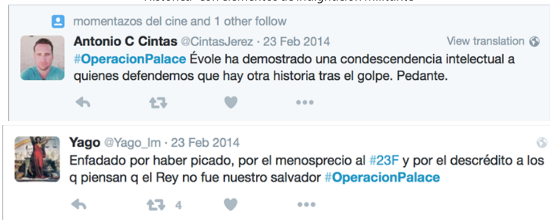
Imagen 06: Ejemplos de marcos de "Trivialización Histórica" con elementos de indignación militante

Pero lo que es realmente distintivo de las redes es que, desde estos discursos, se acusa al fake de Évole no tanto por la trivialización histórica en sí misma, sino por cómo parece ridiculizar las narrativas contrahegemónicas de las que son portavoces aquellos tweets emitidos desde perfiles abiertamente politizados. Al anunciarse como un programa que desvelaría un episodio oscuro del pasado, Évole parecía situarse en la órbita de colectivos por la memoria y exhibía un compromiso de desmontar la narrativa hegemónica que ilusionó a actores que dedican su acción política a esta meta. En lugar de este proceso de transparencia, algunos usuarios interpretan en cambio que, mediante la construcción de una farsa cómica, Operación Palace sitúa las tesis militantes en contra de la versión oficial de la historia al mismo nivel de la conspiranoia o de la comedieta que se representa en el programa. Así, se cuestiona la efectividad del falso documental para poner en jaque las versiones oficializadas de la Transición y se lo acusa de, al contrario, adoptar una actitud pedante, paternalista y condescendiente con las personas que dedican sus esfuerzos en reclamar una aclaración seria de las sombras del suceso.