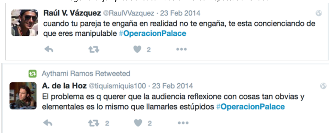
Imagen 02: Ejemplos de reactividad al marco “Espectador Crítico”