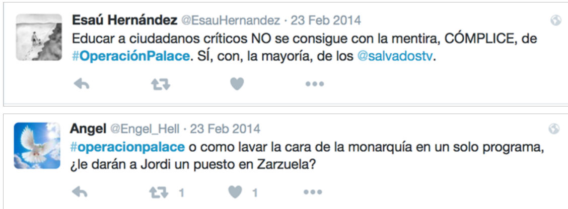
Imagen 07: Ejemplos de marcos de “Trivialización histórica” con críticas a la inocuidad del formato

operar, incluso, un refuerzo de los discursos oficialistas, al exponer que lo mismo vale la comedia presentada por el programa que cualquier versión crítica propuesta hasta la fecha. En este sentido, incluso se insinúa una complicidad entre el discurso del programa y los intereses de las instituciones que han modelado el discurso de la Transición.