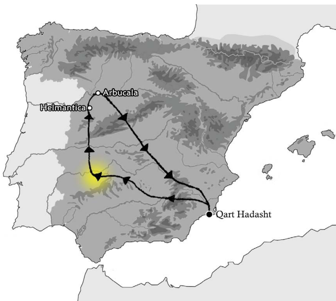
Fig.4- Recorrido de Aníbal por la Meseta castellana. En amarillo, zona aproximada de hallazgo.

Aclarado este punto y dando en un principio por seguro el lugar de hallazgo, sí que probaría la ruta escogida de Aníbal para acceder a la Meseta. Por el simple motivo de que, en este caso, sí se trata de un conjunto cerrado, como son, efectivamente, los tesoros. Estos forman una instantánea fotográfica del material circulante del momento y siempre se ocultan en momentos concretos de inestabilidad y de guerras. Dadas las circunstancias de nuestro conjunto descontextualizado -realmente ofrece más preguntas que respuestas- se le suman las diferentes perforaciones que presentan las monedas, pese a que hallamos argumentado que no se utilizaron en algún tipo de adorno, como un collar o una pulsera.