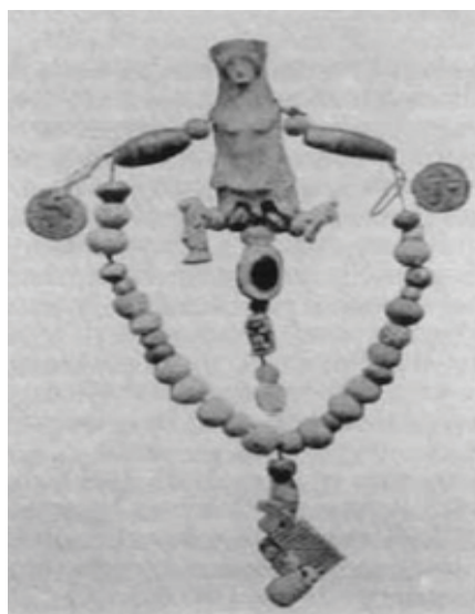
Fig. 1.-Reconstrucción de un collar con monedas cartaginesas y amuletos. Antiguas excavaciones de Carlos Román y Calvet en Ibiza. Reproducido por Alfaro (1993b: 265).

De hecho, el 78% de las perforaciones fueron ejecutadas en el reverso. Ello demuestra la nula intención de respetar la imagen “divina” que se ve representada, ya que lo lógico hubiera sido hacerlo por el anverso; de este modo, se velaba por no dañar el anverso, que es la parte ideológica y artísticamente más importante. Es por esto, en nuestra opinión, que las imágenes muchas veces no fueran respetadas, pues muchas de las perforaciones -aunque no muy descaradas- desde el reverso las inundan. Esta observación fundamental es la que nos decanta a no considerar las piezas como, desde el punto de vista antropológico, sagradas o que han sido objeto de culto y veneración a modo de talismán o amuleto al más puro estilo alejandrino. Todas las perforaciones que presentan las piezas se han hecho de manera que no