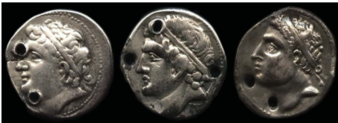
Fig.2-Evolución de la efigie de Melqart en tres estilos definidos. Anversos de nuestros DSH-1 estilo "A", DSH-3 estilo "B" y DSH-4 estilo "C".