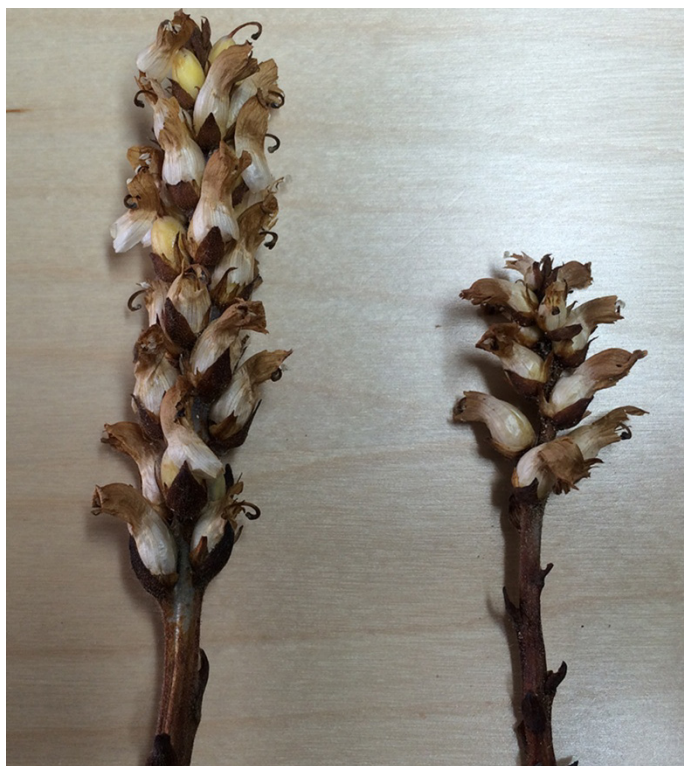
Fig 2. Muestra recolectada de Orobanche cernua .