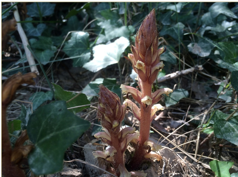
Fig 3. Orobanche hederae parasitando Hedera helix , en San Felices (Soria).