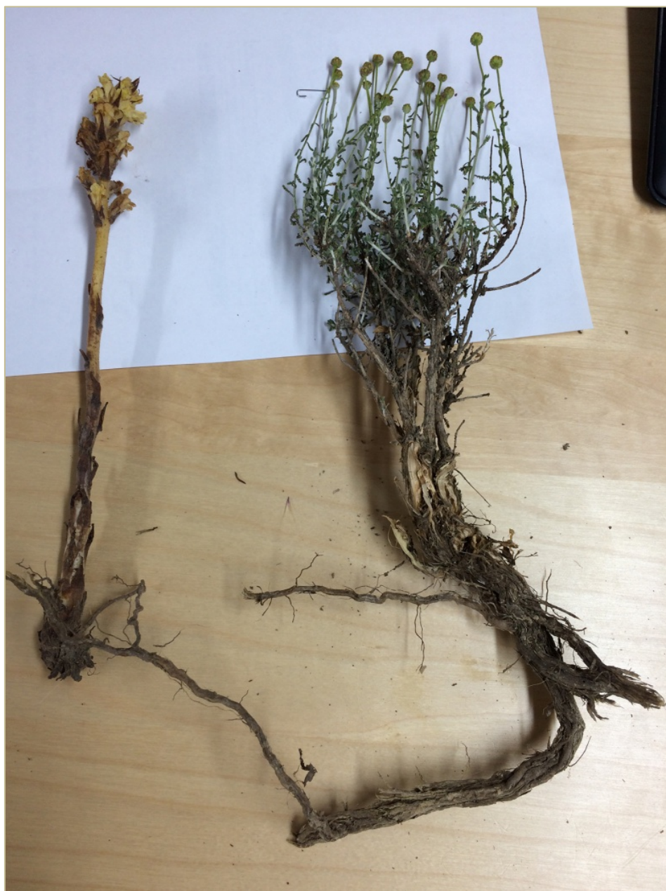
Fig 5. Muestra recolectada de Orobanche santolinae parasitando a Santolina chamaecyparissus .