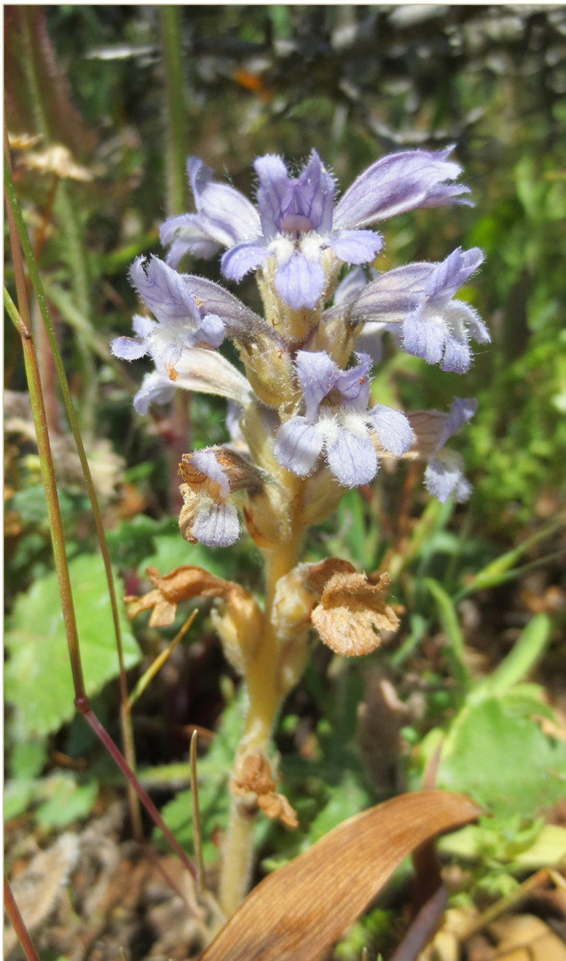
Fig. 7. Phelipanche nana en Torrevicente (Soria).