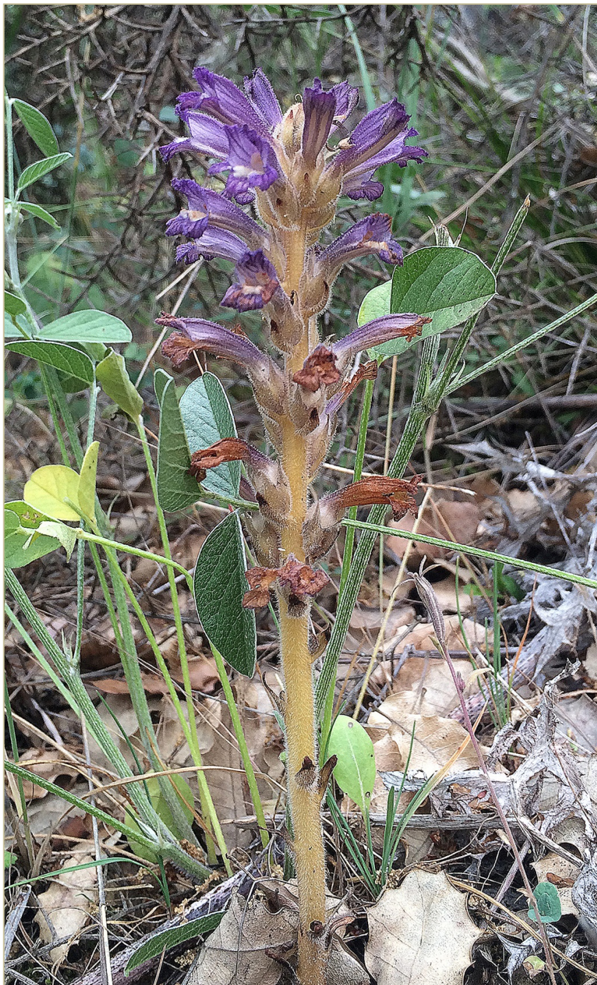
Fig 6. Phelipanche lavandulaceoides sobre Psoralea bituminosa , en Alcubilla de las Peñas (Soria).