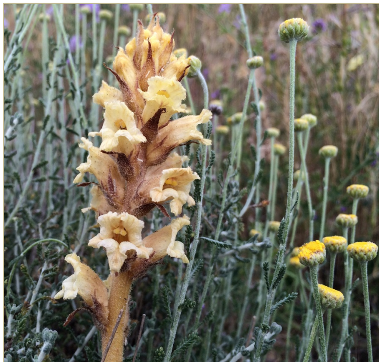
Fig 4. Orobanche santolinae sobre Santolina chamaecyparissus , en su medio (Ambrona, Soria).