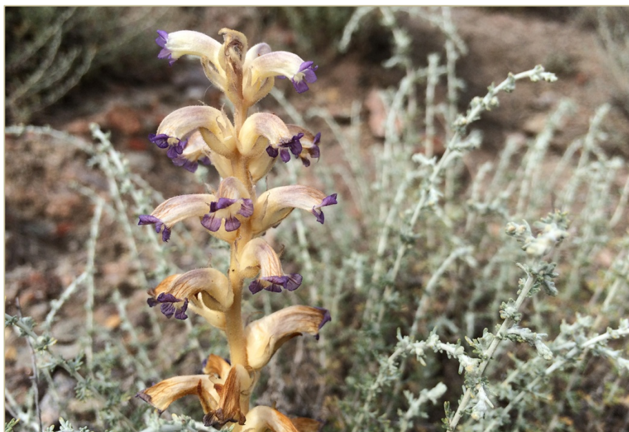
Fig 1. Orobanche cernua en su ambiente, parasitando Artemisia herba-alba (Azcamellas, Soria).