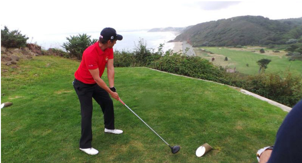
La práctica totalidad de los deportes requieren un buen entrenamiento físico y un buen entrenamiento mental