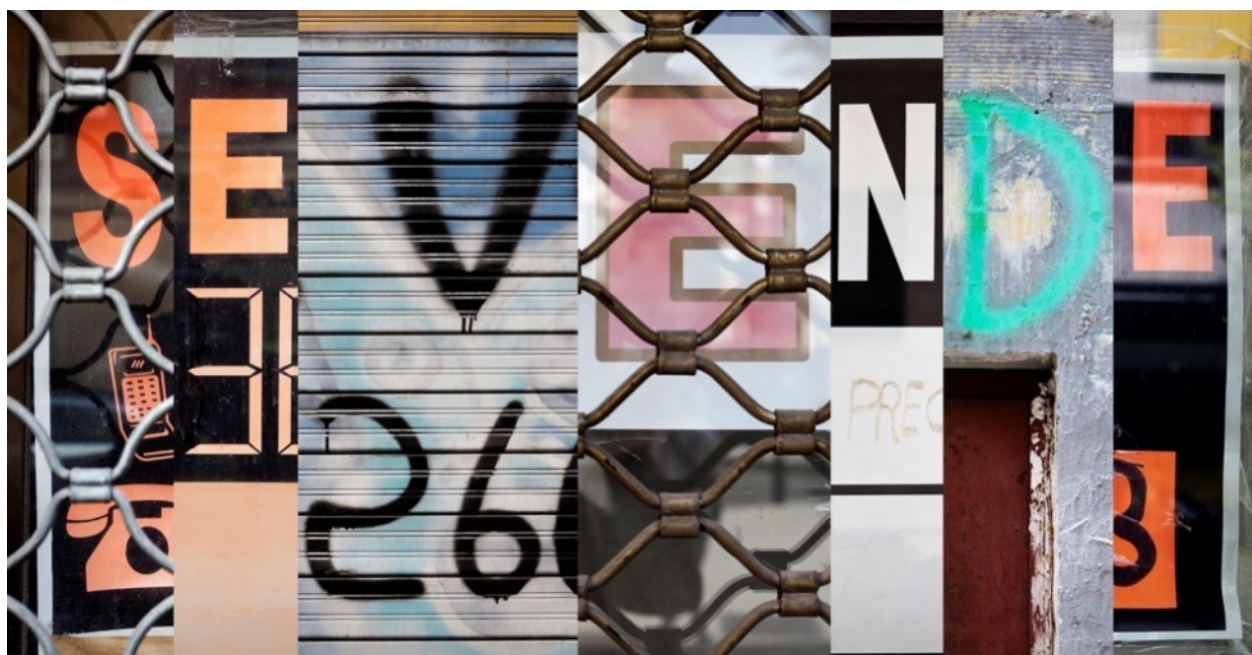
Figura 2. Jonás Bel, “21 de agosto, Madrid. Se vende”

El último verano evoca diversas temporalidades, memorias y predicciones con tal variedad que el recuerdo entristecido de Eduardo Nave sobre la decisión de su abuela, con 88 años de edad, de retirarse de dar su característico chapuzón en la piscina (fig. 1), comparte su lugar en perceptible simbiosis con el collage de carteles “en venta” de Jonás Bel (fig. 2).