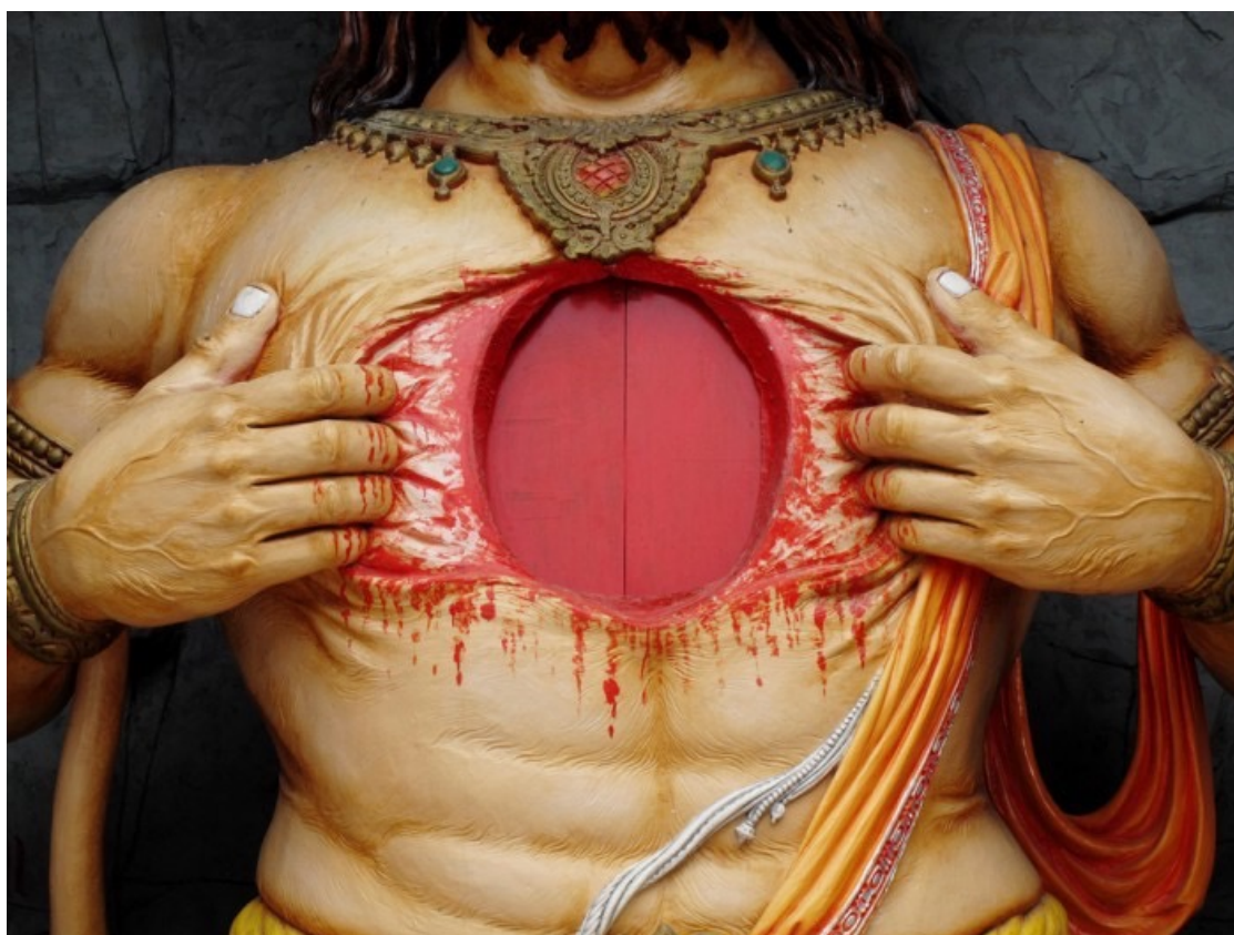
Figura 4. Eva Sala, “23 de agosto. Rishikesh. Sacrificio”

Más allá de los medios informativos, algunas imágenes ofrecen lecturas críticas y opositoras sobre el discurso del Gobierno y el “sacrificio” en su programa de austeridad, que circula ad nauseam en los medios de comunicación. Eva Sala ofrece una fotografía de una estatua de madera esculpida en la India cuyas manos texturizadas abren la piel en el pecho para desvelar el corazón (fig. 4).