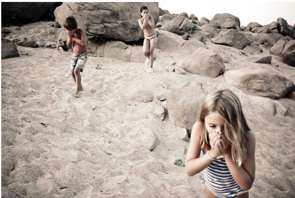
Figura 3. Paco Gómez, “18 de agosto, Embalse del Burguillo, Ávila. Curiosity” © Paco Gómez / NOPHOTO

La fantasía de ciencia ficción, pronunciada con dosis de humor y nostalgia, recuerda al fotógrafo sus buenos momentos jugando en la playa, como hacen sus hijos ahora, en un movimiento que colapsa la fantasía futurista y la memoria a través de una narrativa fantástica sobre la pérdida nostálgica de una generación a la siguiente, dada la imposibilidad de volver a tiempos más reconfortantes. Inspirado en la cobertura mediática sobre las primeras imágenes del paisaje marciano, de la nave Curiosity de la NASA, el recuerdo de la infancia de Gómez sugiere una forma de viajar en el tiempo, lejos de la extrañeza del presente inhóspito e incómodo; propone la escapada, compartida en la fantástica expedición de sus hijos. Pero la fotografía de un juego inocente e inquietante —los niños con la boca cubierta contra el riesgo de “ingesta de líquidos”, y la puesta en escena en asfixiantes “condiciones de calor extremo y ausencia de oxígeno”— demuestran las cualidades de un terreno marciano hostil que habla más sobre la manera de percibir el presente espacio-temporal, que de la imaginación fantástica (“18 de agosto, embalse del Burguillo, Ávila. Curiosity”).