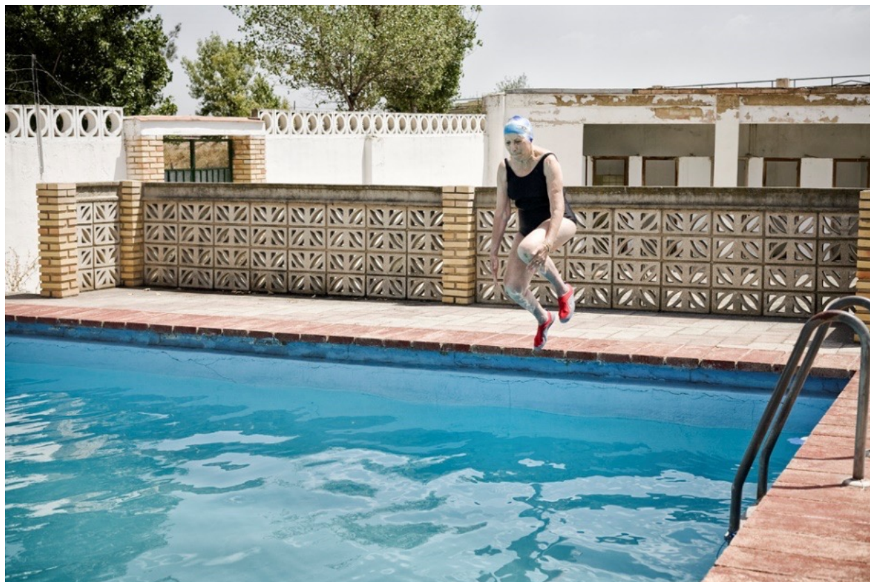
Figura 1. Eduardo Nave, “23 de agosto, Chestre. El verano pasado”