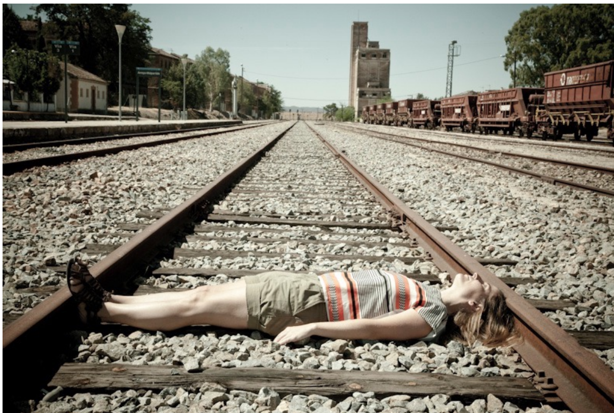
Figura 5. Paco Gómez, “24 de agosto, Arroyo-Malpartida. Cáceres. Vía muerta”