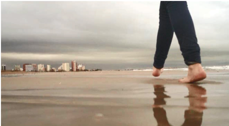
Figura 5. Captura de pantalla del segundo 2:10 del vídeo realizado por Elena Gimeno Bañón, alumna de 4º de E.S.O del I.E.S de Massamagrell. 2015.

Se demuestra, durante el proceso de realización y posteriormente en la fase de montaje de video, un interés innegable por aprender más conceptos y técnicas que