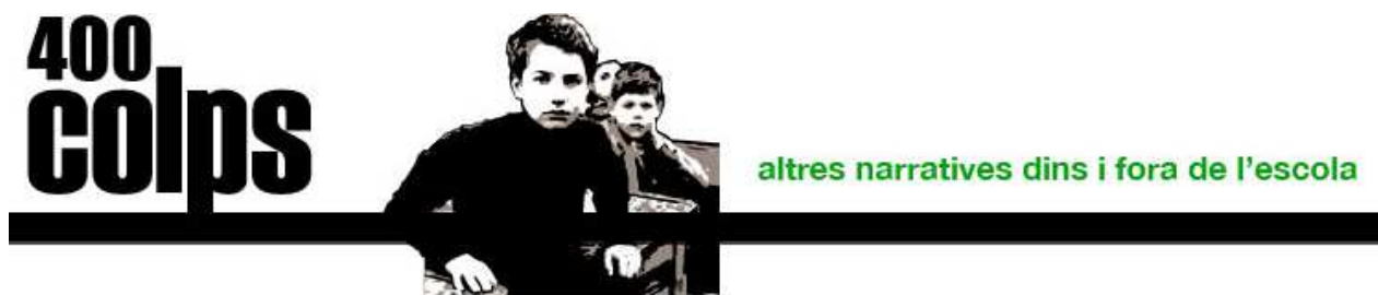
Figura 3. Detalle de la Web 400 colps: altres narratives dins i fora de l'escola. Vertig Blue Theme. Brian Gardner. 2008.

Realiza con grupos reducidos de alumnos entrevistas a invitados, retransmite jornadas audiovisuales de jóvenes e incluso ha programado un ciclo en el instituto de cine en versión original. Además, incita a los alumnos a participar en Mice (Mostra Internacional de Cinema Educatiu) recreando las obras de autores cinematográficos.