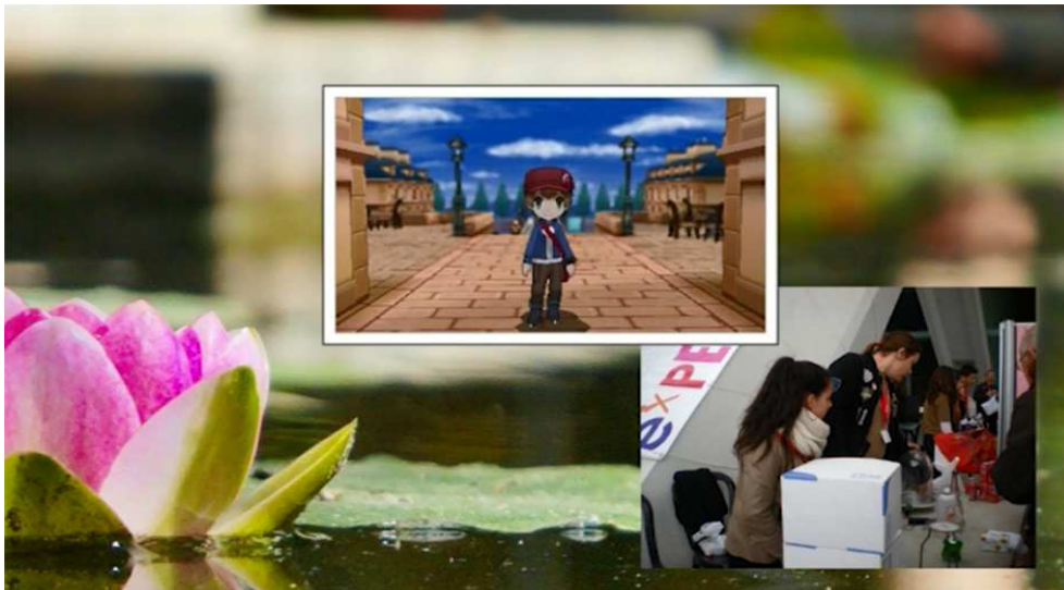
Figura 7. Captura de pantalla del segundo 1:25 del vídeo realizado por M.A Callejo Orengo alumno de 4º de E.S.O del I.E.S de Massamagrell. 2015.