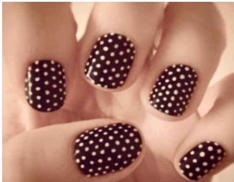
Captura de pantalla del segundo 0:08 del vídeo realizado por Tamara Carrasco del Campo, alumna de 4º de E.S.O del I.E.S de Massamagrell. 2015.