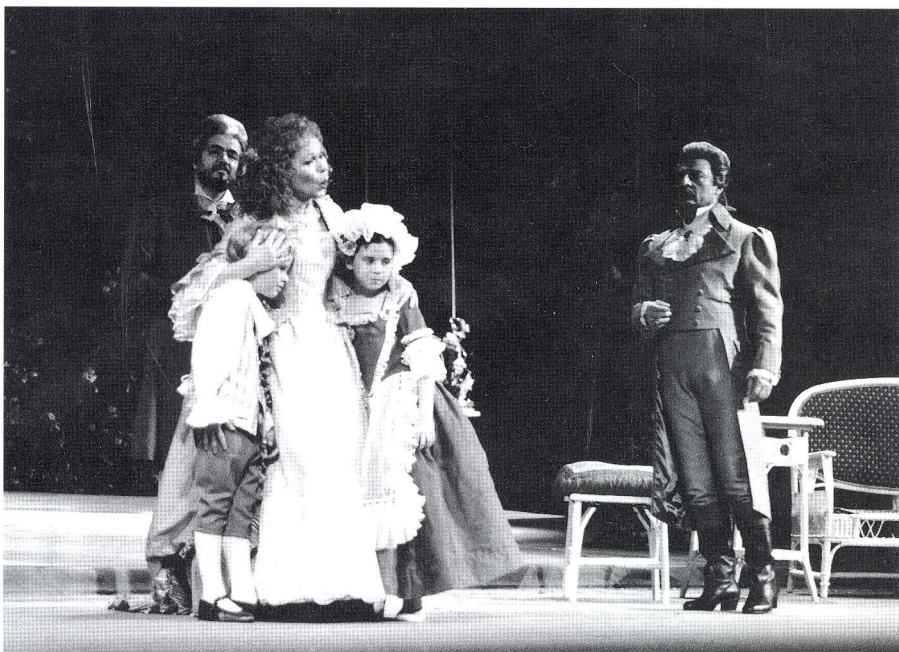
UNA ESCENA DE WERTHER AL LICEU.

que serà irremediable: separació definitiva-desesperança-desesperació-suïcidi.