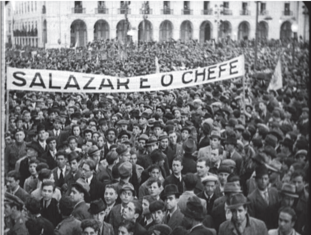
Manifestación de apoyo a Salazar en su cumpleaños, Lisboa, Terreiro do Paço, 28 de abril de 1941 ( Jornal Português no. 25, suplemento, April de 1941)