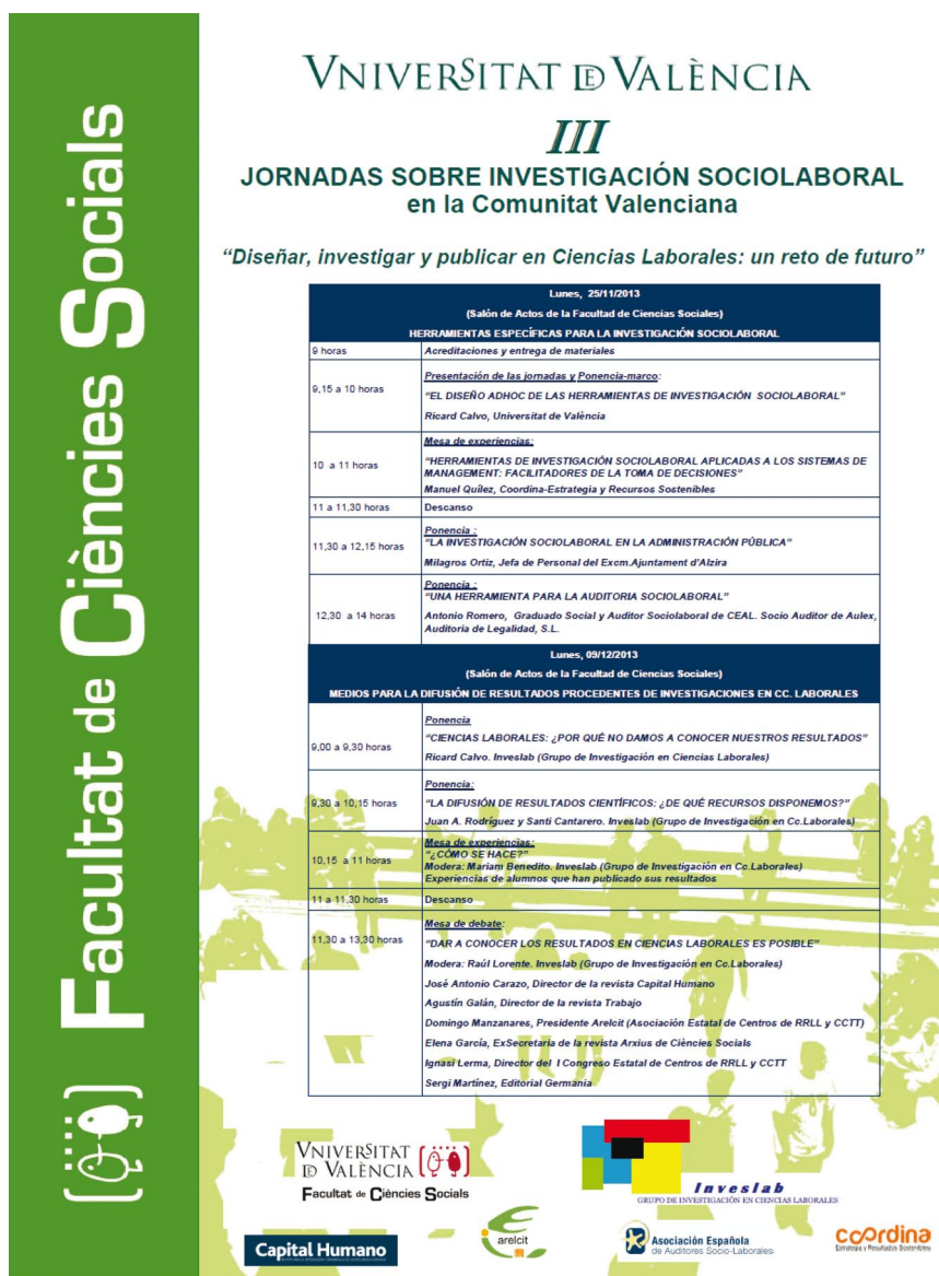
Figura 1 Cartel de las Jornadas

mática disponible para todo el profesorado con carga docente en Trabajos de Fin de Grado en RRL y RRHH en el blog http://inveslab.blogs.uv.es/ .