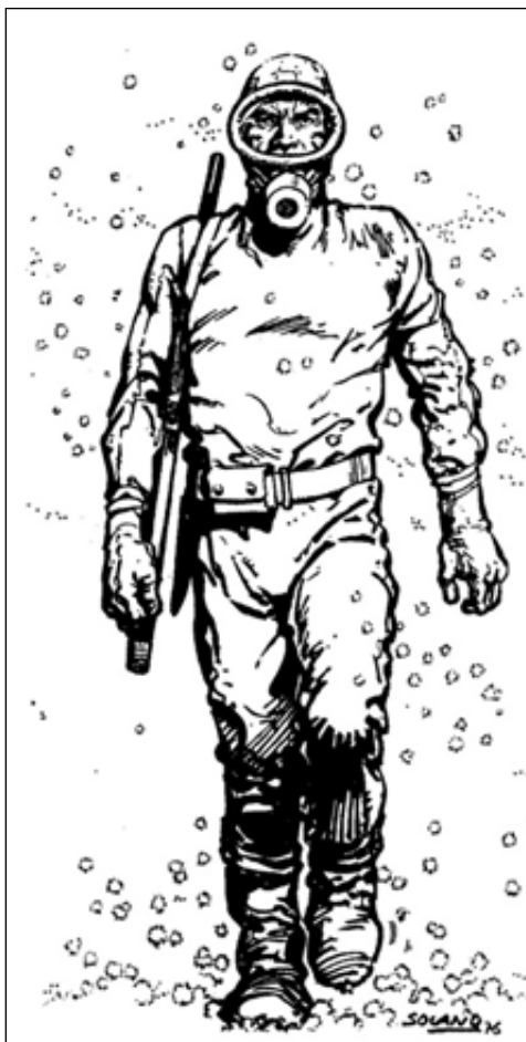
Figura 1.

En 2010, el Gobierno nacional usó la iconografía y la simbología de esta historieta, ya convertida en un referente de la cultura argentina, como herramienta militante (ver figura 2). El empleo de El Eternauta como bandera de activismo político, le sirvió al kirchnerismo para dos fines: