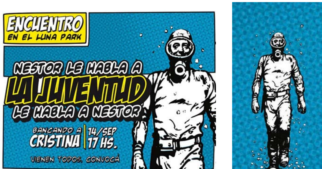
Figura 2.

político que la entonces presidenta argentina Cristina Fernández de Kirchner pronunció en ese acto partidario de 2010.