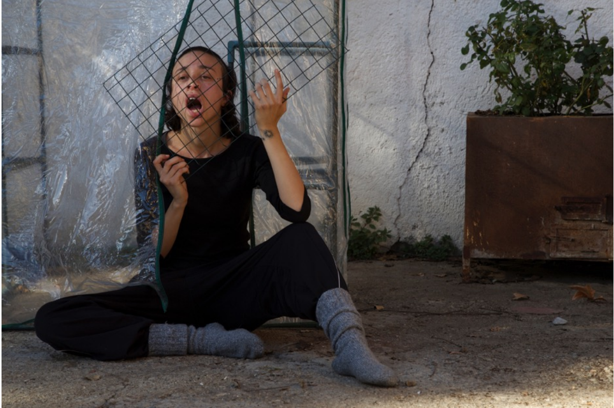
Imagen 9. Altar en Granada 1