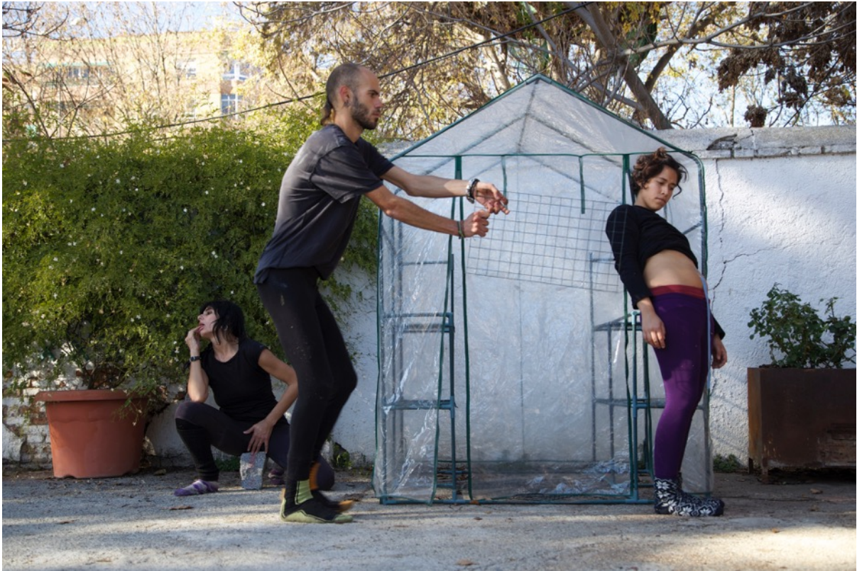
Imagen 11. Altar en Granada 3