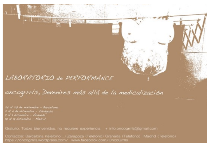
Imagen 1. Cartel diseñado para la difusión del Laboratorio

laboratorio-exploración, 20 personas 7 , en su mayoría mujeres o disidentes de género, distribuidas en cuatro grupos, nos encontramos en cuatro ciudades distintas (Barcelona, Zaragoza, Granada y Madrid). El desafío común era encontrar Pautas para devenir más allá de la medicalización 8 .