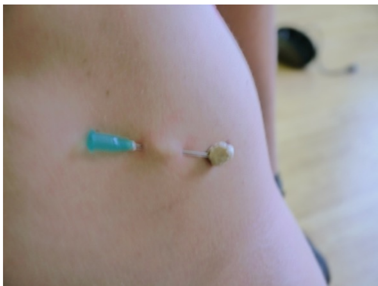
Imagen 3. Erotiza una aguja. Barcelona, 2016: https://vimeo.com/247794501