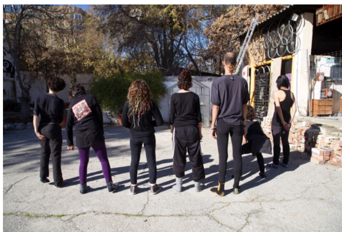
Imagen 8. Perímetro de altar en Granada