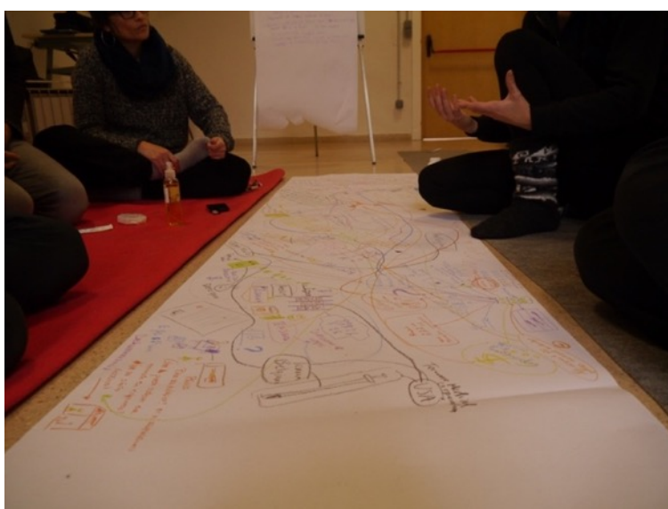
Imagen 6. Enmarañando en papel. Zaragoza