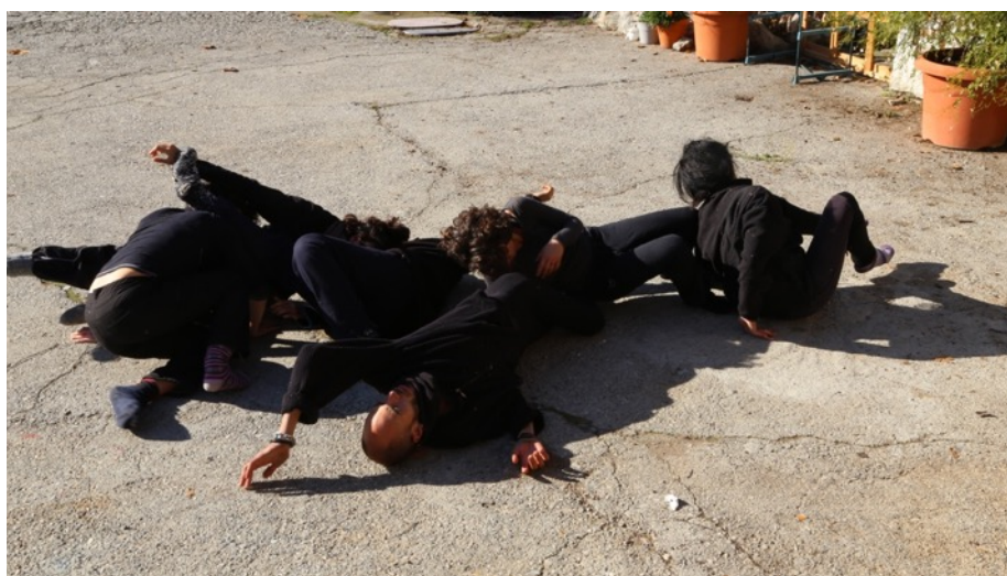
Imagen 4. Devén Ciempiés. Granada, 2016

'Después de la operación, le enseñé la cicatriz a mi hijo. ¿Te asusta?'; Le dije. -no, mamá, es muy bonita !Es un ciempiés!' 21