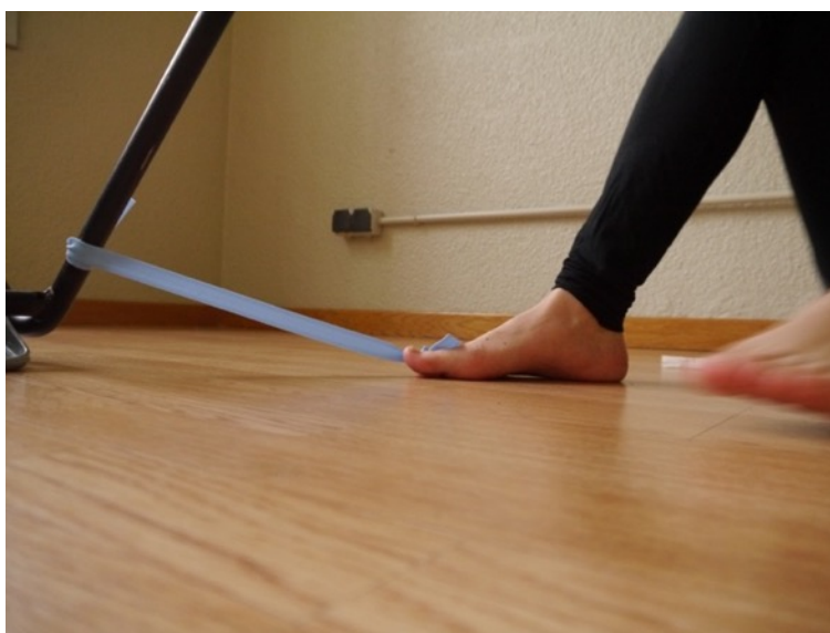
Imagen 5. Enmarañada con materiales, Barcelona

Pautas para enmarañar sitúan tu cuerpo en nuevas relaciones con tu archivo médico, abriéndolo a nuevas relaciones onco-corporales. Preguntar nuevas preguntas, explorar movimientos, construir nuevas relaciones. Revuelve tus preguntas individuales médicas sin respuesta con sus historias materiales y simbólicas. Lo puedes hacer en papel o en movimiento. Dibujando un cuadro o incorporando una imagen. Investiga los trazos de la materialidad de tu tratamiento y tu historia personal en el mundo. Pregunta de nuevo, curiosear, enmarañate.