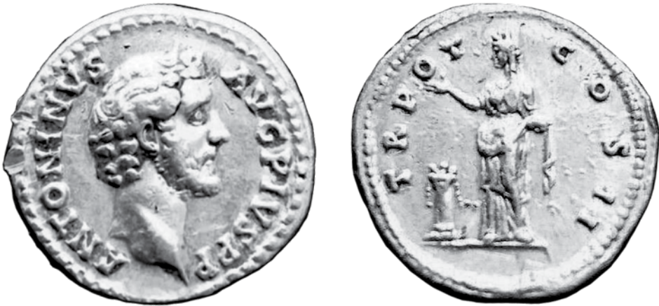
Figura 1. Áureo (7,20 gramos y 20 mm).

Acerca sobre la procedencia o el entorno arqueológico en el que se enmarca esta pieza, hemos de decir que su hallazgo se produjo en un terreno de labranza, cerca del río Árrago, donde también se encuentran restos de una antigua villa romana (‘El Ladrillar’). Este paraje, en un claro contexto rural, puede relacionarse con una serie de explotaciones agrícolas, siendo todas ellas la principal actividad económica de la zona.