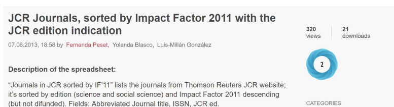
Figura 2. Métricas de un dataset depositado en Figshare.

< https://figshare.com/articles/JCR_Journals_sorted_by_Impact_Factor_2011_with_the_JCR_edition_indication/714141 >.