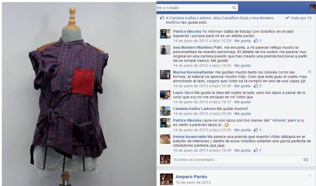
Figura 3. Participantes evaluando y comentando el prototipo online

En la fase final “Construcción”, todos los participantes evaluaron y comentaron los paneles de inspiración resueltos. Durante este proceso de personalización en masa, se observó que a pesar de trabajar con un informe (de un perfil prediseñado) y compartir ideas, sugerencias y evaluaciones en la toma de decisiones de diseño junto con el resto del grupo, cada estudiante fue capaz de interpretar el personaje propuesto por el investigador/facilitador, con su propio estilo, visión y experiencia personal (véase Figura 3).