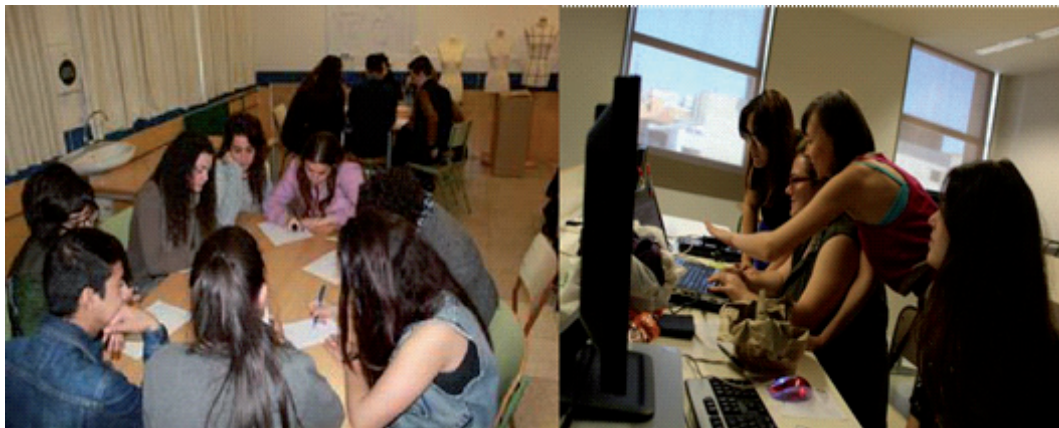
Figura 1. Participantes realizando y comentando el storytelling (narración del personaje)

un todo, el retrato del personaje fue reescrito colaborativamente. Según Visser et al. (2005), muchas de las técnicas utilizadas para transmitir resultados emplean este tipo de estructuras narrativas involucrando a personas reales y son consideradas más atractivas.