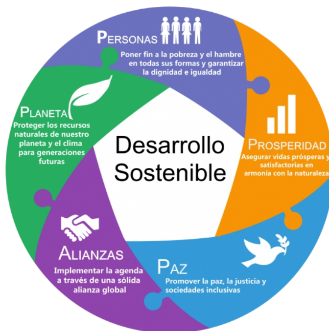
Figura 5: Seis elementos esenciales para el cumplimiento de los objetivos de desarrollo sostenible (Fuente: Naciones Unidas, 2014).

luchar contra las desigualdades; b) garantizar una vida sana, el conocimiento y la inclusión de las mujeres y los niños; c) prosperidad: desarrollar una economía sólida, inclusiva y transformadora; d) planeta: proteger nuestros ecosistemas para todas las sociedades y para nuestros hijos; e) justicia: promover sociedades seguras y pacíficas e instituciones sólidas; y f) asociación: catalizar la solidaridad mundial para el desarrollo sostenible. (Naciones Unidas, 2014).