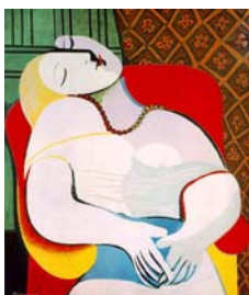
Figura 1. El sueño

9.1.1. Planificación: cojamos como imagen elegida El Sueño de Picasso.