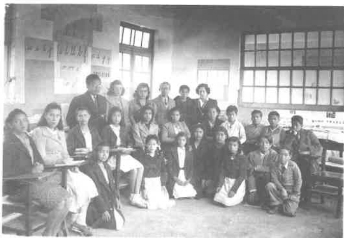
Emilia Elías y Antonio Ballesteros con profesores y alumnos de la Escuela Normal de Pachuca y alumnos de primaria tras una práctica escolar, 1940. Fuente: Serna y Salazar, 2013.

las presas políticas en España. Su ideología, siempre netamente republicana, fue moderándose y a finales de la década de los 50 se alejó del comunismo, acercándose al sector socialista afín a Indalecio Prieto (Domínguez, 1994). Si su militancia política estuvo centrada en España y el antifascismo, el eje profesional en torno al cual giraron sus años de exilio fue la formación de profesores, tanto por sus clases como por los textos que escribió. Además de llevar a cabo diversas investigaciones y estudios de campo sobre la problemática de los estudiantes mexicanos, escribió varios ensayos pedagógicos y manuales con mucho éxito. Así que, si bien mantuvo lazos muy importantes con los exiliados, toda su actividad profesional se realizó, a diferencia de muchos de sus coterráneos, entre mexicanos y en el sistema de educación pública de su país de adopción. Al respecto cabe señalar que, como muestra de esa profunda y sincera inmersión, fue de los republicanos que optó por la nacionalidad mexicana.