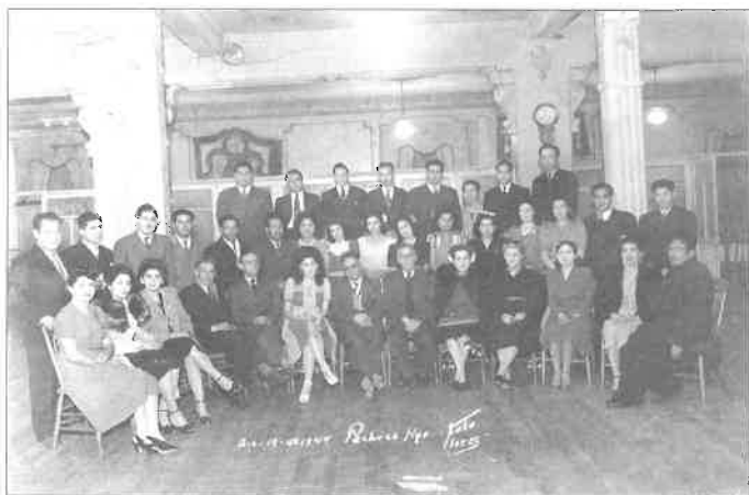
Fiesta de graduación de la Escuela Normal de Pachuca, 19 de diciembre de 1944.