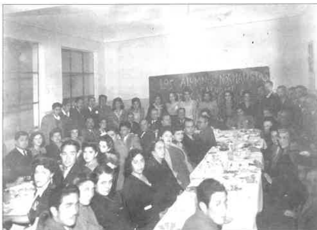
Fiesta de los estudiantes de la Escuela Normal de Pachuca. Fuente: Serna y Salazar, 2013.

maría y un año después La lengua nacional en los textos literarios . En estas publicaciones se muestra una fuerte influencia de la Escuela Nueva, inscritas aún dentro de los debates pedagógicos del contexto español. Por otro lado, Emilia Elías también había escrito, y seguiría haciéndolo, algunos artículos acerca de la mujer, en la revista Mujeres Antifascistas Españolas (Yusta, 2005).