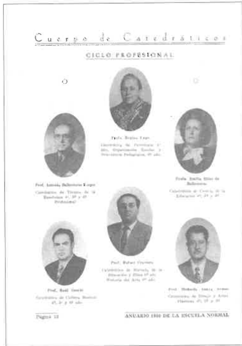
Anuario de la Escuela Normal de Pachuca, 1950.

a través de cursos y materiales de la Secretaría de Educación Pública, muy marcados por la influencia del pragmatismo norteamericano de John Dewey, el programa educativo de la Revolución rusa, Kerschensteiner y otras pedagogías que se apartaban del positivismo decimonónico.