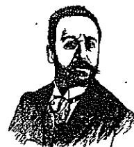
D. RUPERTO CHAPÍ Y LORENTE

También le escribió mucho para el teatro, habiendo sido