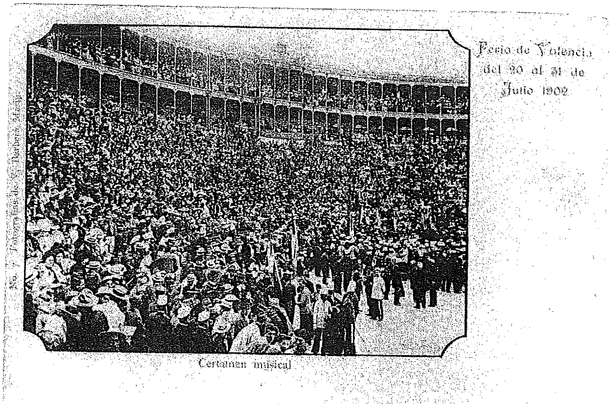
Postal que reproduce la actividad del Certamen de Bandas de Valencia en su edición de 1902, en la que Chapí actuó como jurado.

de extrañar que la prensa valenciana le concediera más importancia al director del conservatorio madrileño en sus reseñas. 46