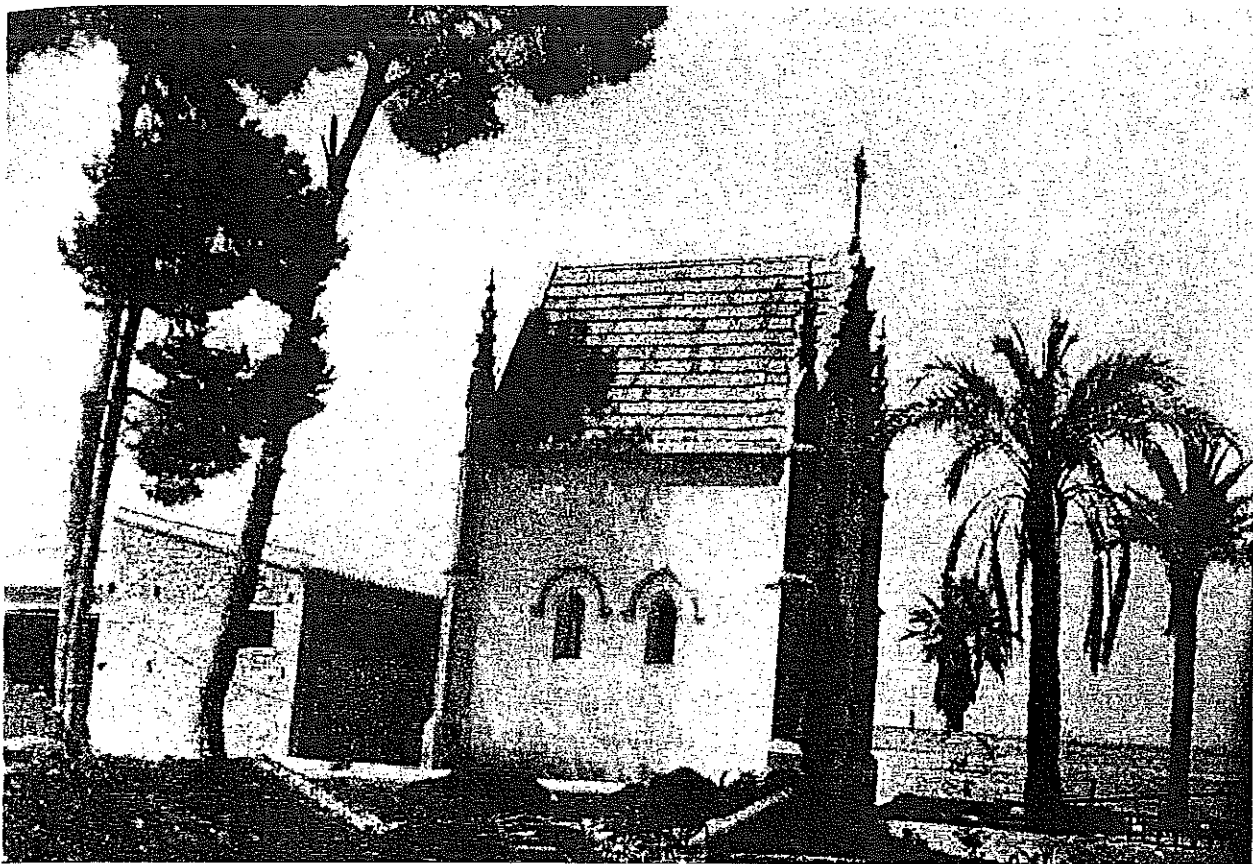
Capilla de la finca «La caseta blanca» en Bétera, en la que Chapí compuso unos Gozos a la Virgen . Ilustración reproducida en el libro Poesía y verdad de Vicente W. Querol, de Luis Guarnier citado en la nota 59

Giner, y se debe destacar lo que apareció en la prensa en relación con esta pieza: «obra [que] han manifestado deseos de conocer los maestros Arrieta y Chapí». 61 Significativamente, Una nit d'albaes se repitió a instancia de los compositores y del público. 62