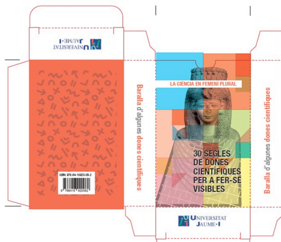
Figura 3. Caixa de la baralla de cartes sobre algunes dones científiques.

El material que hem explicat, es complementa amb un quadernet titulat: 50 jocs automàtics (Didàctica de la cartografia matemàtica). Es tracta d'un recopilatori de mig centenar de rutines que es poden fer sense cap tipus de preparació, que tenen tots una fonamentació matemàtica i una posada en escena espectacular i senzilla. La seua experimentació i el llenguatge instructiu i divulgatiu utilitzat, tenen com a objectiu en convertir aquest material es un recurs de fàcil accés a qualsevol persona que domine mínimament la lectoescriptura.