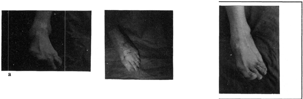
Figura 1: Valoración clínica de los resultados (a: preoperatorio; b: postoperatorio)