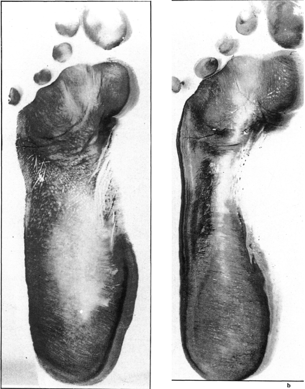
Figura 3: Valoración por el fotopodograma (a: preoperatorio; b: postoperatorio)

de la misma forma y sobre las mismas estructuras, así: