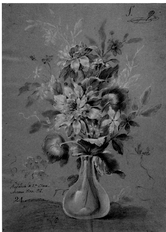
Fig. 5. Antonio Vivó, Estudio de flores. Jarrón de flores , 1792. Museo de Bellas Artes de Valencia.