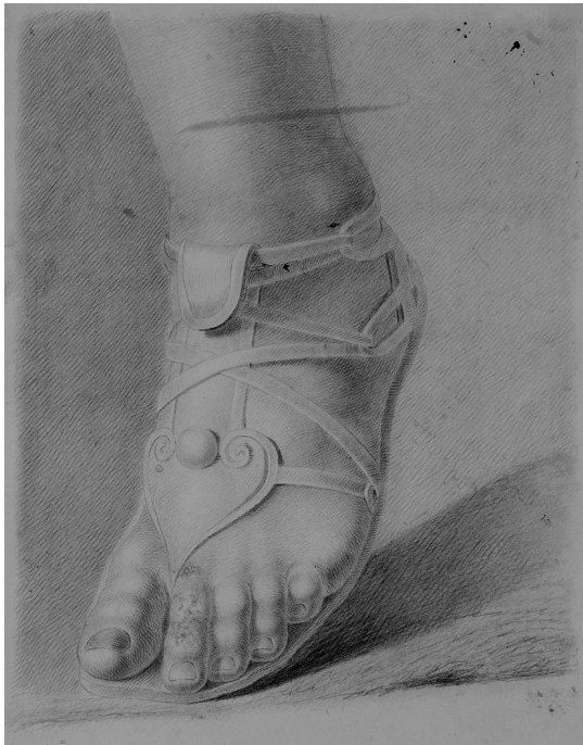
Fig. 1. Antonio Vivó, Estudio de pie con sandalia . Museo de Bellas Artes de Valencia.