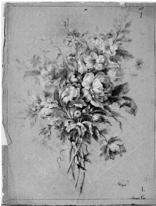
Fig. 3. Antonio Vivó, Estudio de flores , 1791. Museo de Bellas Artes de Valencia.