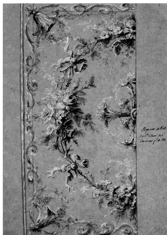
Fig. 6. Antonio Vivó, Modelo para tejido: cenefa vertical con guirnalda de flores , 1798. Museo de Bellas Artes de Valencia.

zo, y con éxito, en el de 1798, pues obtuvo por unanimidad el premio de 40 pesos de la 1ª Clase de Flores a los 26 años. En esta convocatoria, el asunto del ejercicio "de pensado" fue "un Dibujo para un Frontal de Altar Mayor, con Cenefa, por el estilo de las Lochas de Rafael, para fábrica de espólin de sedas de colores y metales; y un Florero pintado al óleo o al agua", mientras que el ejercicio "de repente" consistió en "un dibujo para un Cubrecáliz, con flores y adornos, por gusto de las Lochas". 46 Llama la atención que en esta ocasión prevalezca, incluso en los ejercicios "de repente", para los que habitualmente se elegía un estudio de flores del natural, el sentido práctico de su