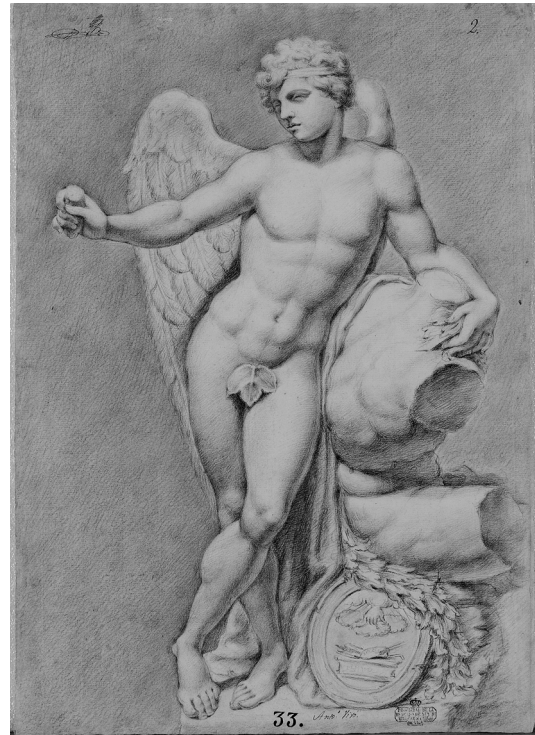
Fig. 2. Antonio Vivó, El Premio . Museo de Bellas Artes de Valencia.

Lo que no puede asegurarse es que el dibujo que se reproduce sea el que le valió alguno de los mencionados reconocimientos, pues no hay indicaciones en él que lo corroboren.