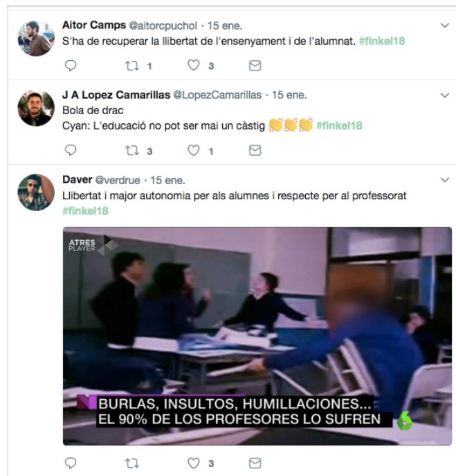
Fig.2 Tuits con la etiqueta del libro comentado por el alumnado del Máster

Otra experiencia para trabajar la lectura con Twitter, propuesta en el Máster de Secundaria, consiste en seguir la lectura de la obra Aloma de Mercè Rodoreda mediante tuits con aquellas palabras y frases de la obra que les resultan más impactantes al alumnado y les provocan algún sentimiento, emoción o pensamiento, tanto en relación a la variedad dialectal como con la manera de expresarse de los personajes, lo que sienten y lo que hacen sentir y reflexionar a los lectores. Se utilizarían tres tipos de etiquetas: una para el léxico, como #LèxicAloma; otra para los pensamientos y las visiones de los personajes, como #PensemAloma; y otra para los pensamientos, emociones y opiniones que les sorprenden a los alumnos mientras leen, o para hacer de amigos de Aloma, a quien aconsejan, como #JoSócAloma. La elección de etiquetas se dejará en manos del alumnado. El profesorado tiene acceso directo a la cronología de publicaciones de la actividad.