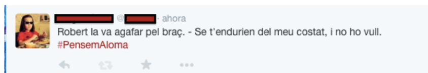
Fig.3 Tuit con la etiqueta del comentario de los alumnos sobre la novela Aloma

Otra experiencia para trabajar la lectura con Twitter, propuesta en el Máster de Secundaria, consiste en seguir la lectura de la obra Aloma de Mercè Rodoreda mediante tuits con aquellas palabras y frases de la obra que les resultan más impactantes al alumnado y les provocan algún sentimiento, emoción o pensamiento, tanto en relación a la variedad dialectal como con la manera de expresarse de los personajes, lo que sienten y lo que hacen sentir y reflexionar a los lectores. Se utilizarían tres tipos de etiquetas: una para el léxico, como #LèxicAloma; otra para los pensamientos y las visiones de los personajes, como #PensemAloma; y otra para los pensamientos, emociones y opiniones que les sorprenden a los alumnos mientras leen, o para hacer de amigos de Aloma, a quien aconsejan, como #JoSócAloma. La elección de etiquetas se dejará en manos del alumnado. El profesorado tiene acceso directo a la cronología de publicaciones de la actividad.