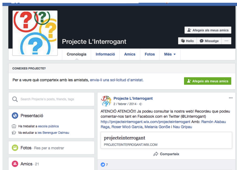
Fig. 1 Pàgina de Facebook del periòdic L'Interrogant

Otro proyecto que emplea las redes sociales Facebook y Twitter es la creación del periódico L'Interrogant que, además de una edición de papel, tiene una edición digital en una web y interactúa con sus lectores mediante estas redes sociales.