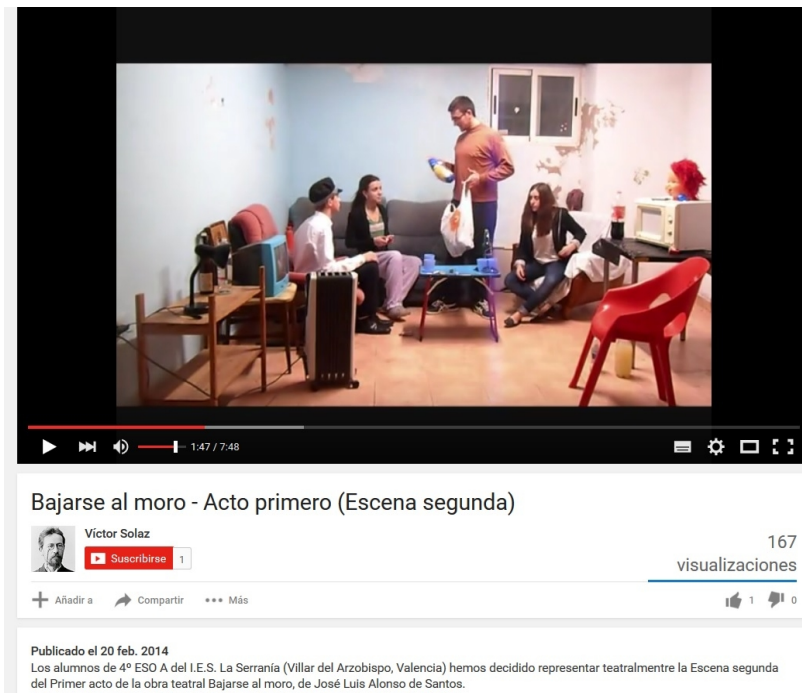
Figura 4. Producto final (dramatización)

Por otra parte, otro resultado, esta vez referido al estudio de la indumentaria, se presentó el curso pasado 2014-2015. En él, tal como describió su autora, se profundizó, por medio de diferentes fuentes, al estudio de la moda en los años 80, con el fin de adecuar el diseño de los trajes a esa realidad. Así, la alumna en cuestión nos indicó que se documentó en un documental que encontró en la página web de Radio Televisión Española titulado La movida madrileña. Frenesí en la gran ciudad 9 , así como con la ayuda de sus padres, que también le proporcionaron información. El resultado de todo ello fue un trabajo muy completo y elaborado en el que, como puede apreciarse, los vestidos están elaborados con retales elegidos cuidadosamente, con el fin de representar, de la manera más fiel posible, tanto los colores como las formas de la década de los 80. Este trabajo referido a la indumentaria de los personajes de Bajarse al moro se publicó en el blog Un bosque de historias : http://unbosquedehistorias.blogspot.com.es/2015/04/la-indumentaria-en-