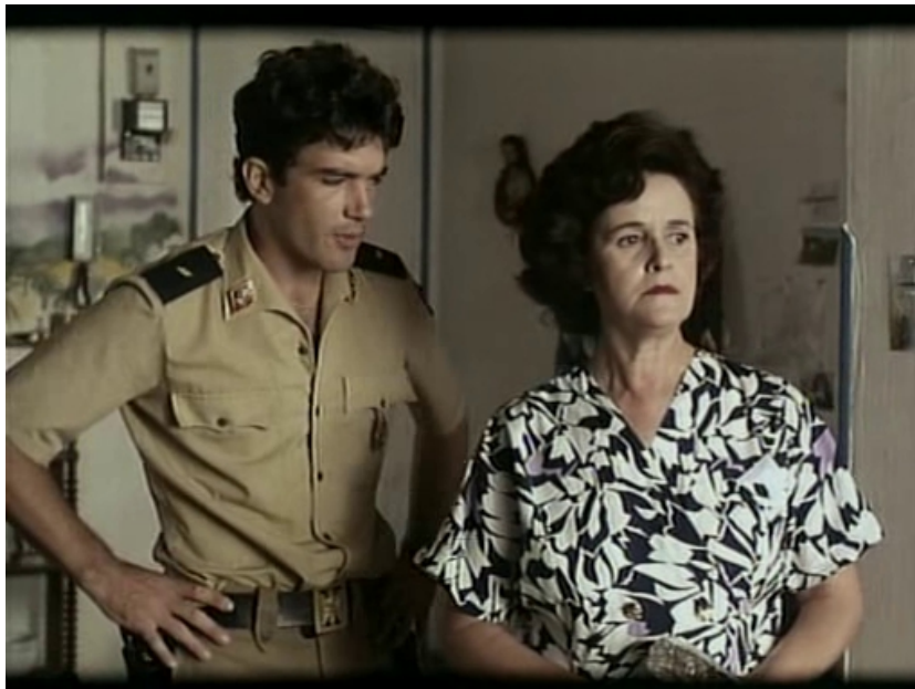
Figura 2. Escena (versión cinematográfica)

A) A partir del visionado de esta escena, escribe qué divergencias en los hechos puedes encontrar en el contraste entre ambas versiones.