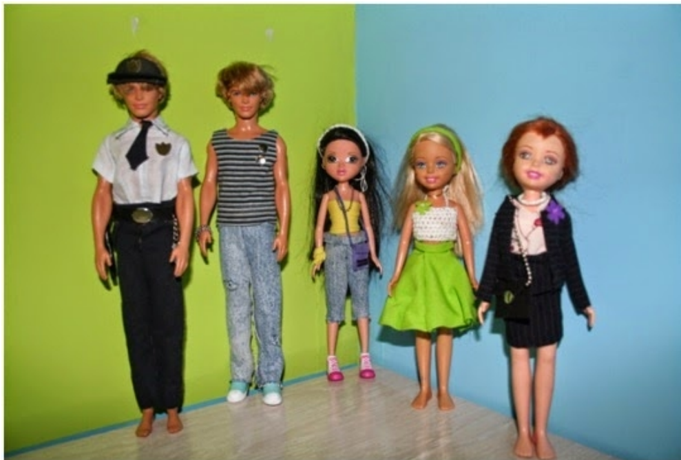
Figura 5. Producto final (indumentaria)

bajarse-al-moro.html, cuyo resultado reproducimos aquí en forma de imagen: