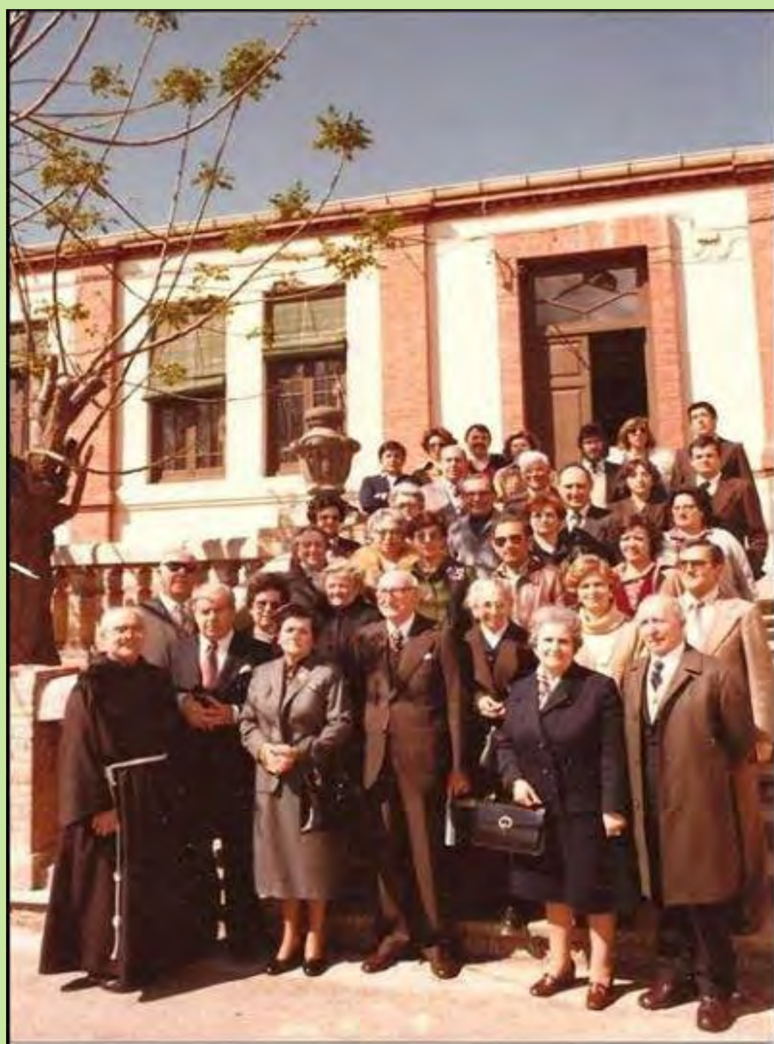
Aquesta imatge és un record dels mestres i claustre de l'escola amb el rector. Carcaixent. 1979-1980.

A partir de 1971, amb el nou pla, l'ara nomenat professorat d'educació general bàsica imprimiria un segell de joventut i dinamisme. Revestits d'una estètica nova, inspirada en maig del 68 i la iconografia Beatle , intentarien trencar l'autoritària, rutinària i avorrida manera d'ensenyar del franquisme.