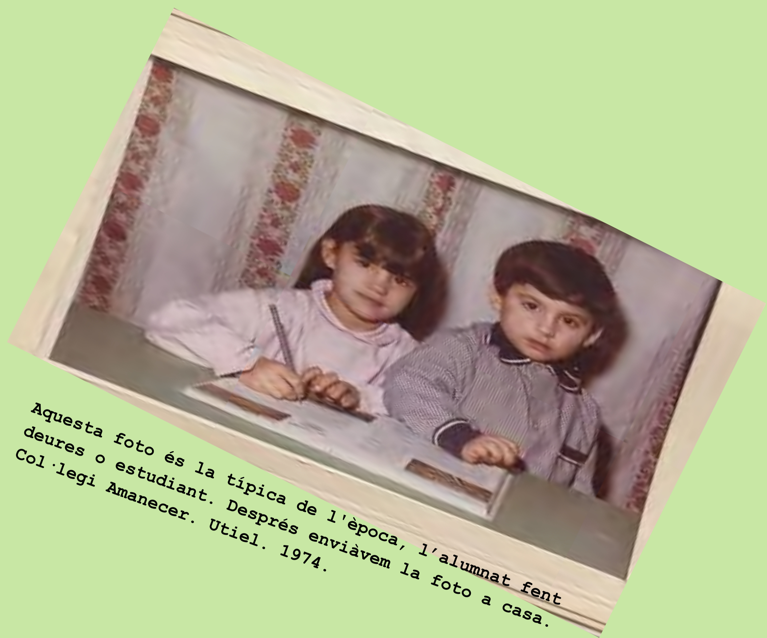
Aquesta foto és la típica de l'època, l'alumnat fent deures o estudiant. Després enviàvem la foto a casa. Col·legi Amanecer. Utiel. 1974.