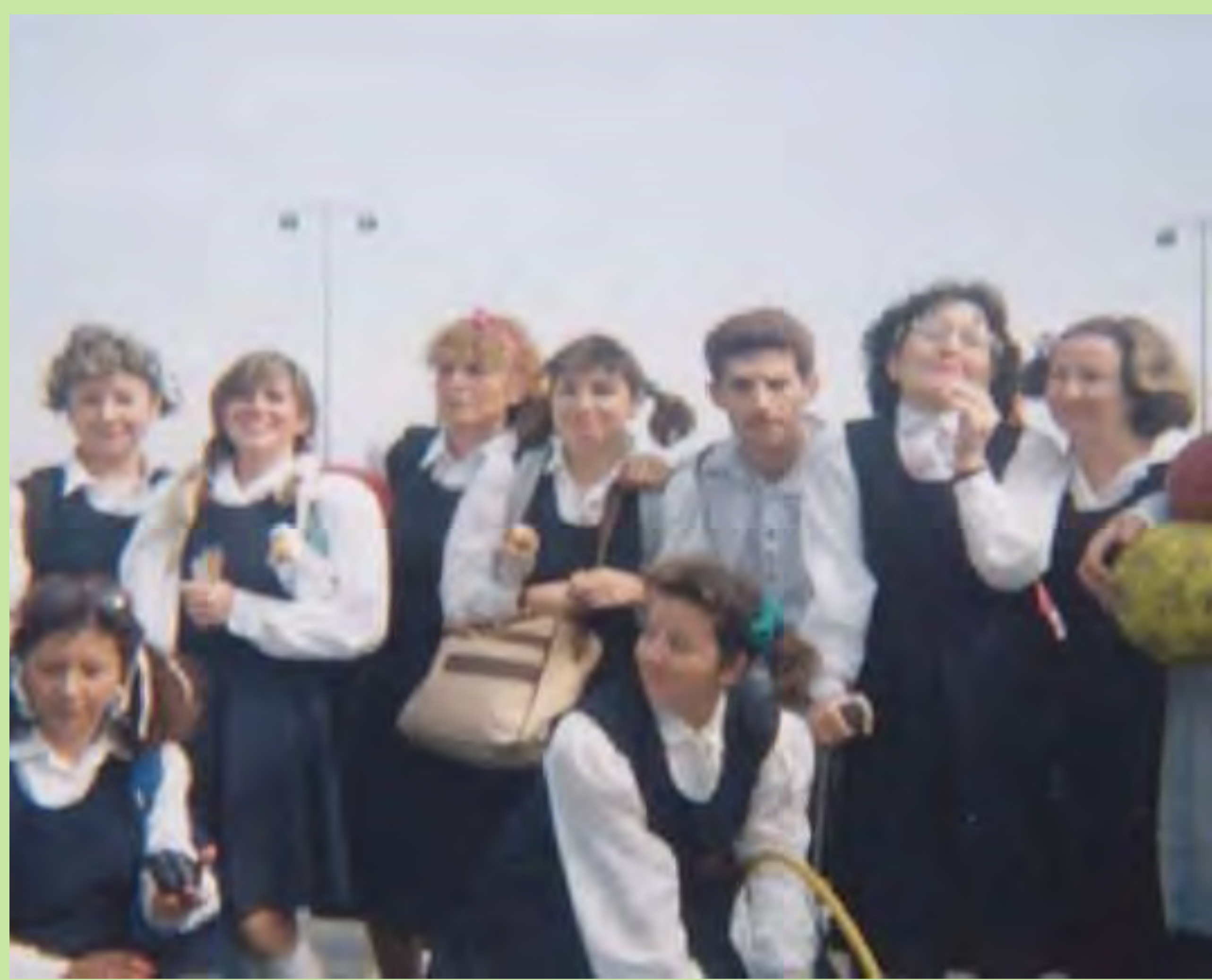
Mestres del col·legi Dominiques de València en la festa de carnestoltes. Va ser el primer any que es van disfressar i van decidir fer-ho amb l'uniforme del col·legi. 1985.

Inoblidables mestres companys que s'organitzaren en col·lectius renovadors, que assistiren a les escoles d'estiu i els estatges d'auto formació, que introduïren el valencià a les aules. Mestres il·lusionats amb una escola pública i innovadora, compromesos a fer que l'aire de llibertat entrara a les escoles.