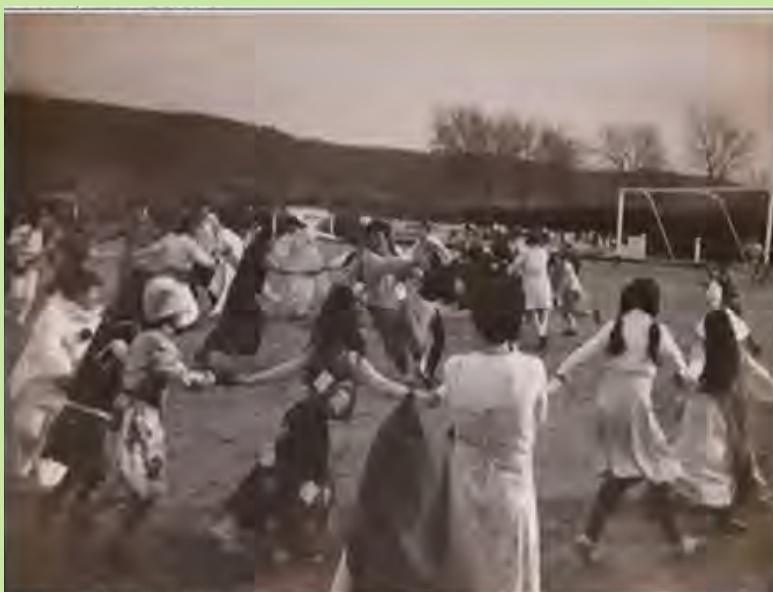
"Celebració de Carnestoltes. Es canten cançons, es fan balls i juguem junts amb la guia de la professora". 1982.