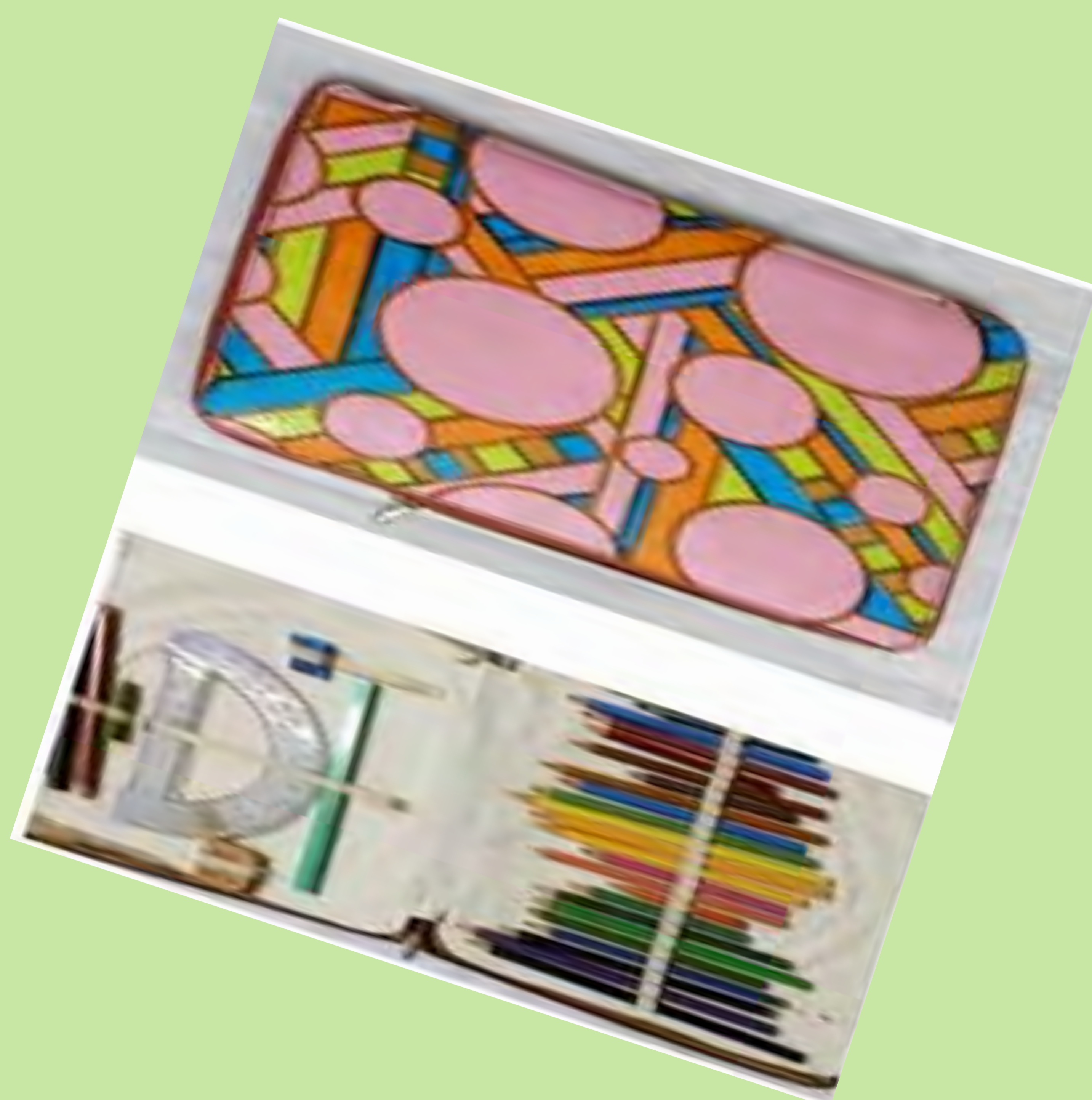
"Aquest estoig és un regal de la meua primera comunió. Tenia molts llapis de colors". Aielo de Malferit. 1975.

L'alumnat que estrenava l'EGB va créixer en una societat en plena recuperació econòmica, que tindria el seu reflex en la presència d'abundants materials didàctics i escolars. Aquests canvis socials i econòmics es veuen reflectits en un canvi en la cultura material, en nous espais, nous utensilis materials que conformaran una nova visió de l'escola i un canvi en les concepcions pedagògiques.