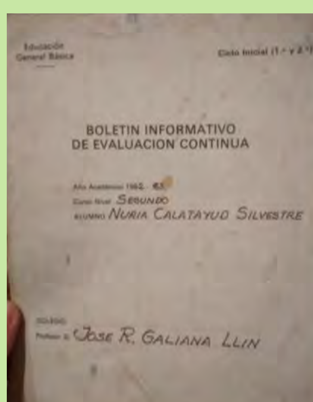
"Butlletí informatiu que ens donaven una vegada acabàvem el primer i el segon curs del cicle inicial". C.P. Fontanars dels Alforins. 1982-1983