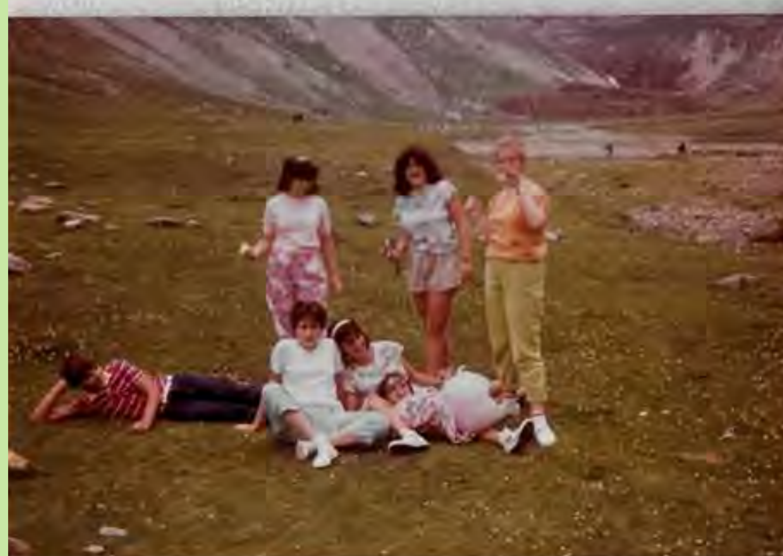
"Fi de curs de 8é d'EGB. Van estar per Saragossa, el Monestir de Pedra, Pirineu aragonés i Barcelona". CP Calixte III. Canals. 1985.