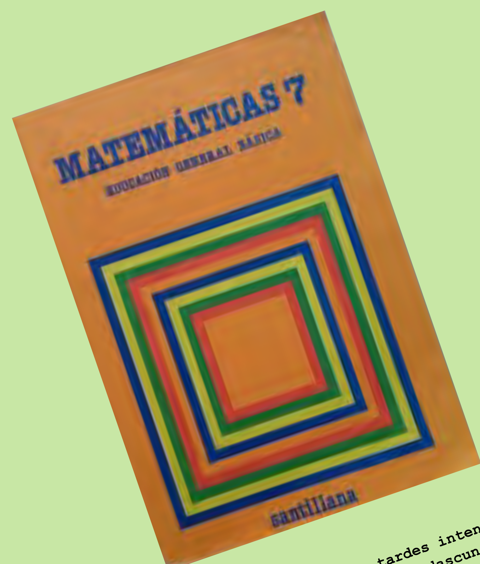
"Recordo passar les tardes intentant saber que havia de fer cadascun dels exercicis". Col·legi Lluís Vives. Masanassa. 1983.