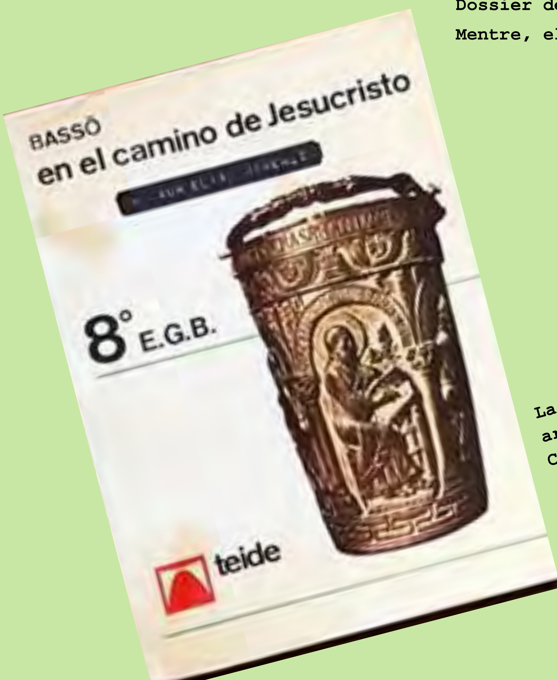
La religió estava molt arrelada a la societat. Corbera. 1978.

La introducció del valencià -primer, com a matèria voluntària, i obligatòria a partir de la Llei d'ús i ensenyament del valencià (1983)- transformaria totalment els materials didàctics. Als textos d'aprenentatge del valencià s'uniran els de les respectives matèries en valencià. Una autèntica revolució que permetrà la construcció d'una escola valenciana i en valencià.