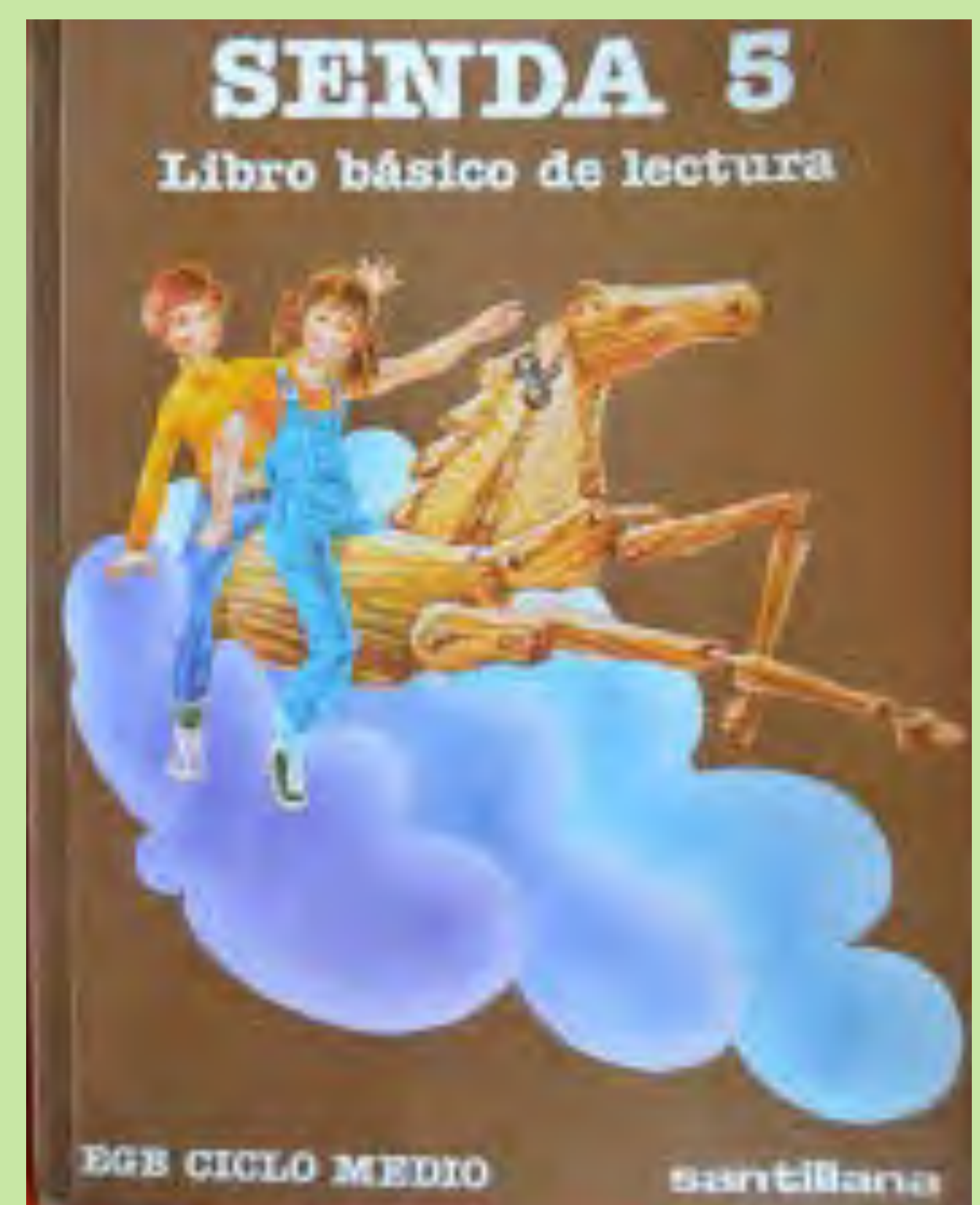
"En classe ens ho passàvem molt bé llegint les històries d'aquest llibre". Escolapios San José de Calasanz. València. 1982.