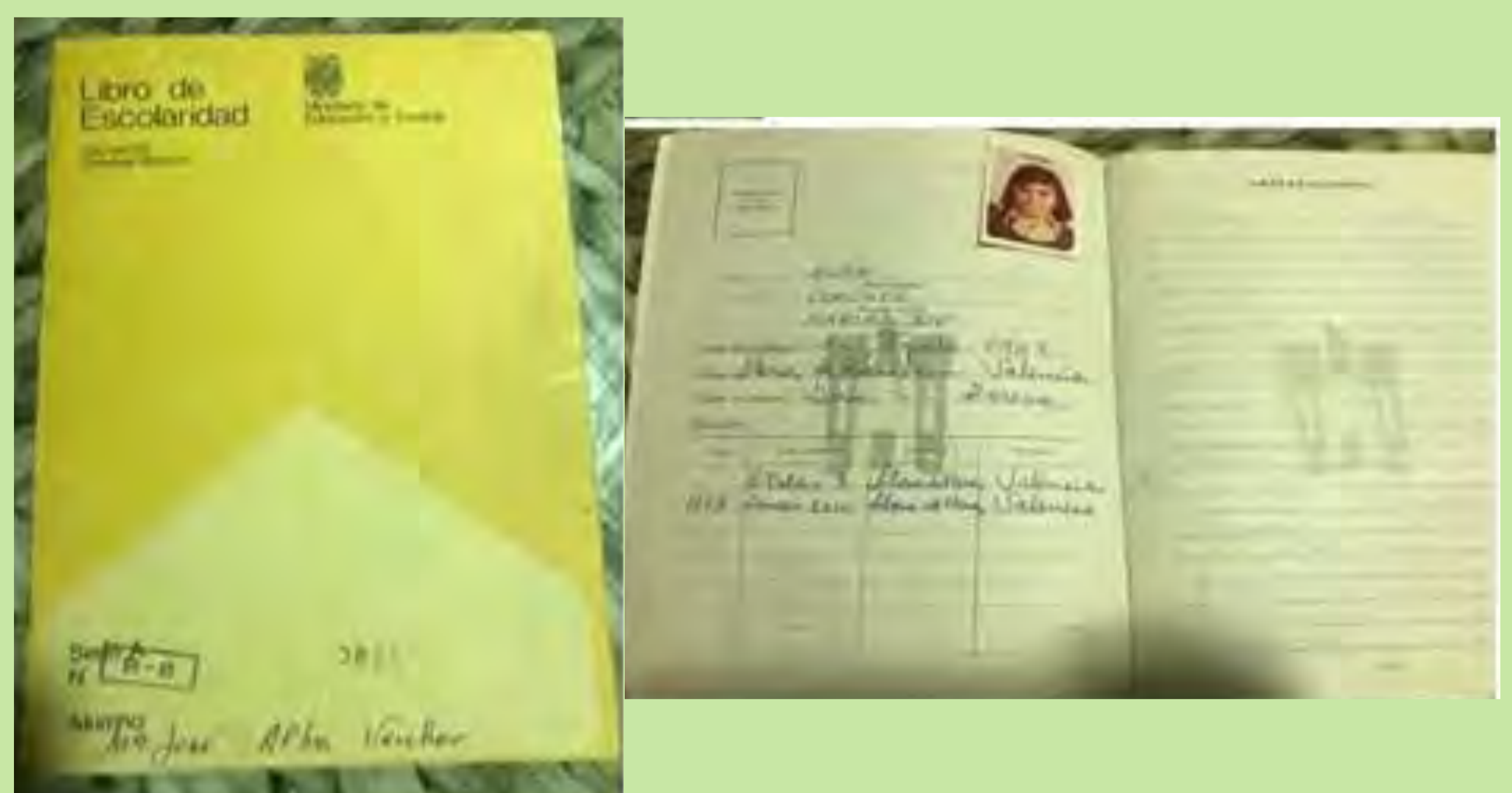
"És el llibre que justifica que vaig anar a escola, on es poden veure els anys d'escolaritat". C.P. Llosa de Ranes. 1978.

El llibre d'escolaritat recollia curs rere curs les qualificacions de l'alumnat. Si eren negatives, es rebia un certificat d'escolaritat -aquells que no havien superat l'EGB- o el graduat escolar, que permetia l'accés al batxillerat.