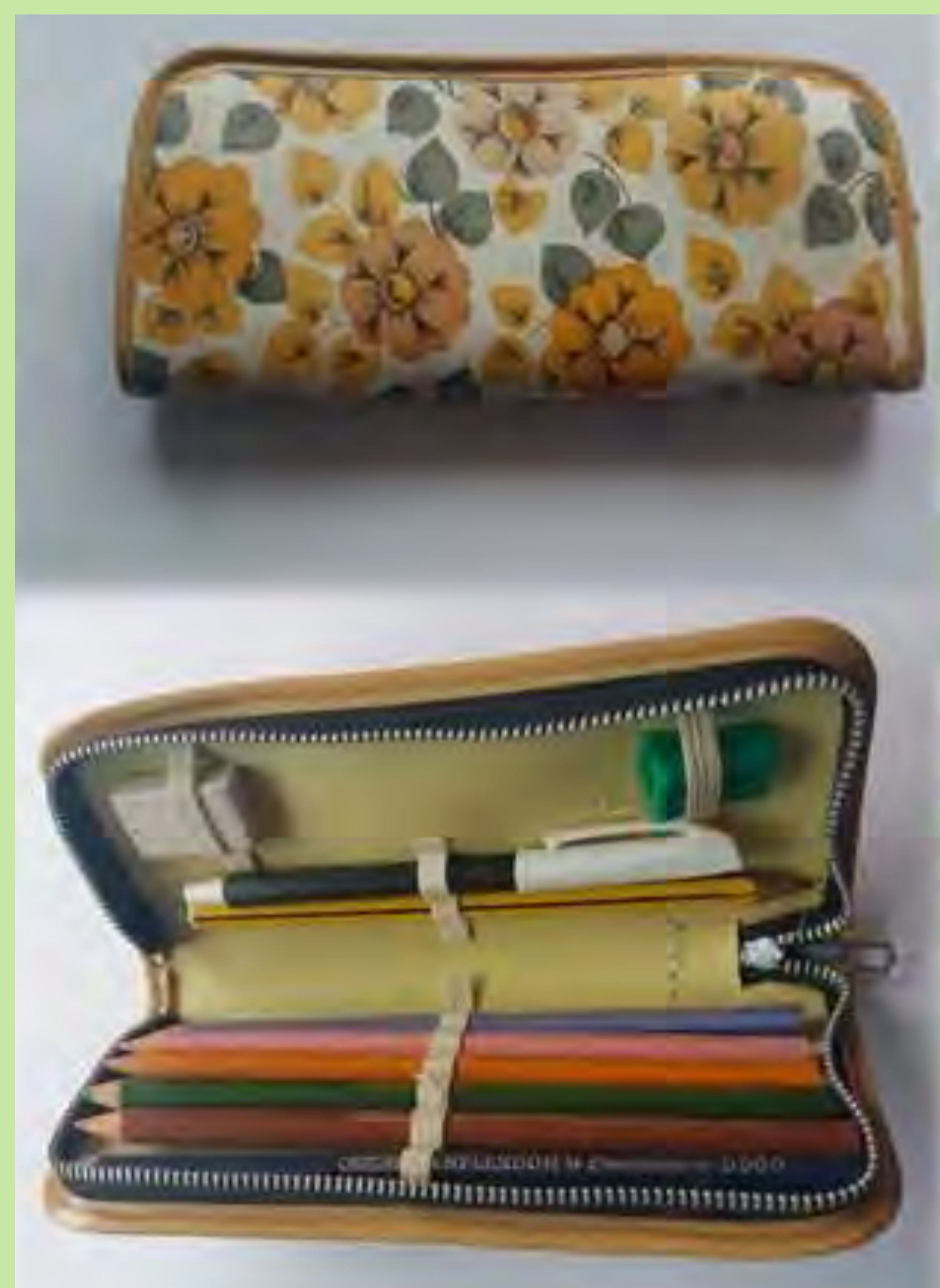
Estoig típic de l'EGB. Tots ho portaven. Col·legi Sagrat Cor. València. 1974

La nova estructura educativa va establir un sistema unitari amb cicles de preescolar, inicial, mitjà i superior. L'Educació General Bàsica (EGB) es va dividir en dues etapes, en què es va promoure el caràcter globalitzat de l'ensenyament. Amb açò, el període d'escolarització obligatòria es va perllongar fins als catorze anys i, així, va possibilitar una major formació bàsica per a sectors més amplis de la població, que podien optar, a més a més, a una reformada Formació Professional. Es van modernitzar també les didàctiques i els continguts de les matèries, i es va permetre la introducció de "llengües vernacles".