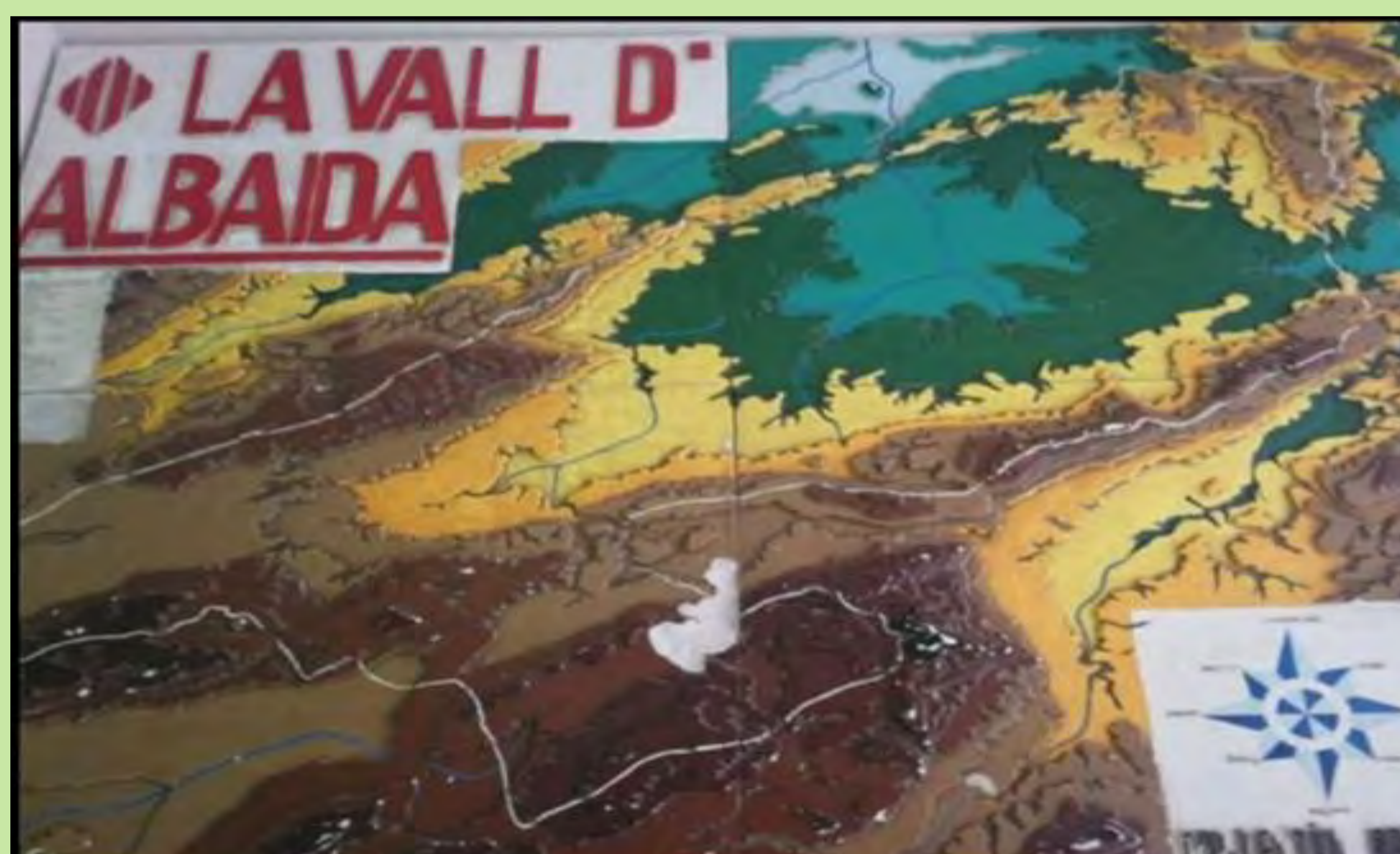
Mapa tridimensional fet a escaiola. Es van fer per tots els col·legis públics de la Vall d'Albaida. Dècada dels 80.