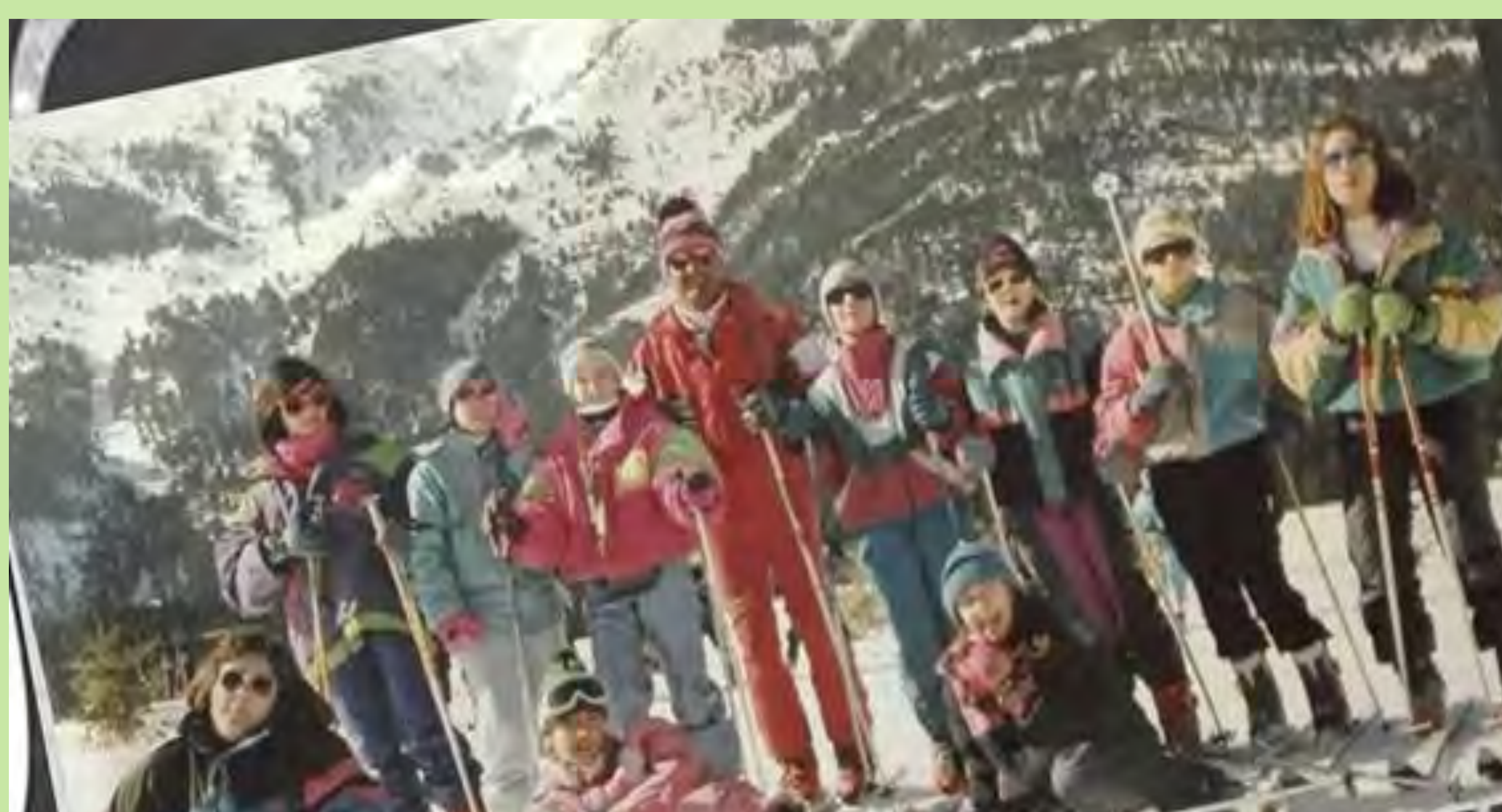
"Grup d'alumnes amb el seu professor en una pista d'esquí. Vacances de Nadal. La Molina. Girona". Col·legi Santa Ana d'Utiel. 1985.

Però les eixides de l'espai escolar també es vinculaven amb l'adoctrinament i la influència de l'Església Catòlica. Així, la commemoració de ritus religiosos, la catequesi, l'assistència a missa o prendre la comunió van continuar formant part de l'univers escolar de la majoria de la població infantil.