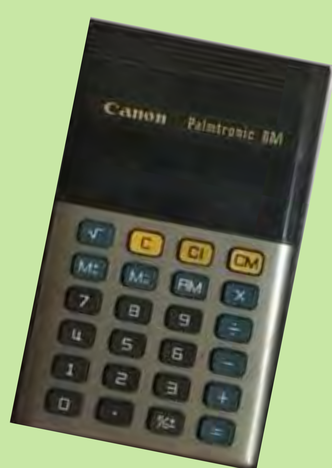
"Per aquells temps no tots tenien l'oportunitat de tenir una calculadora". Anys 70. Tavernes de la Valldigna