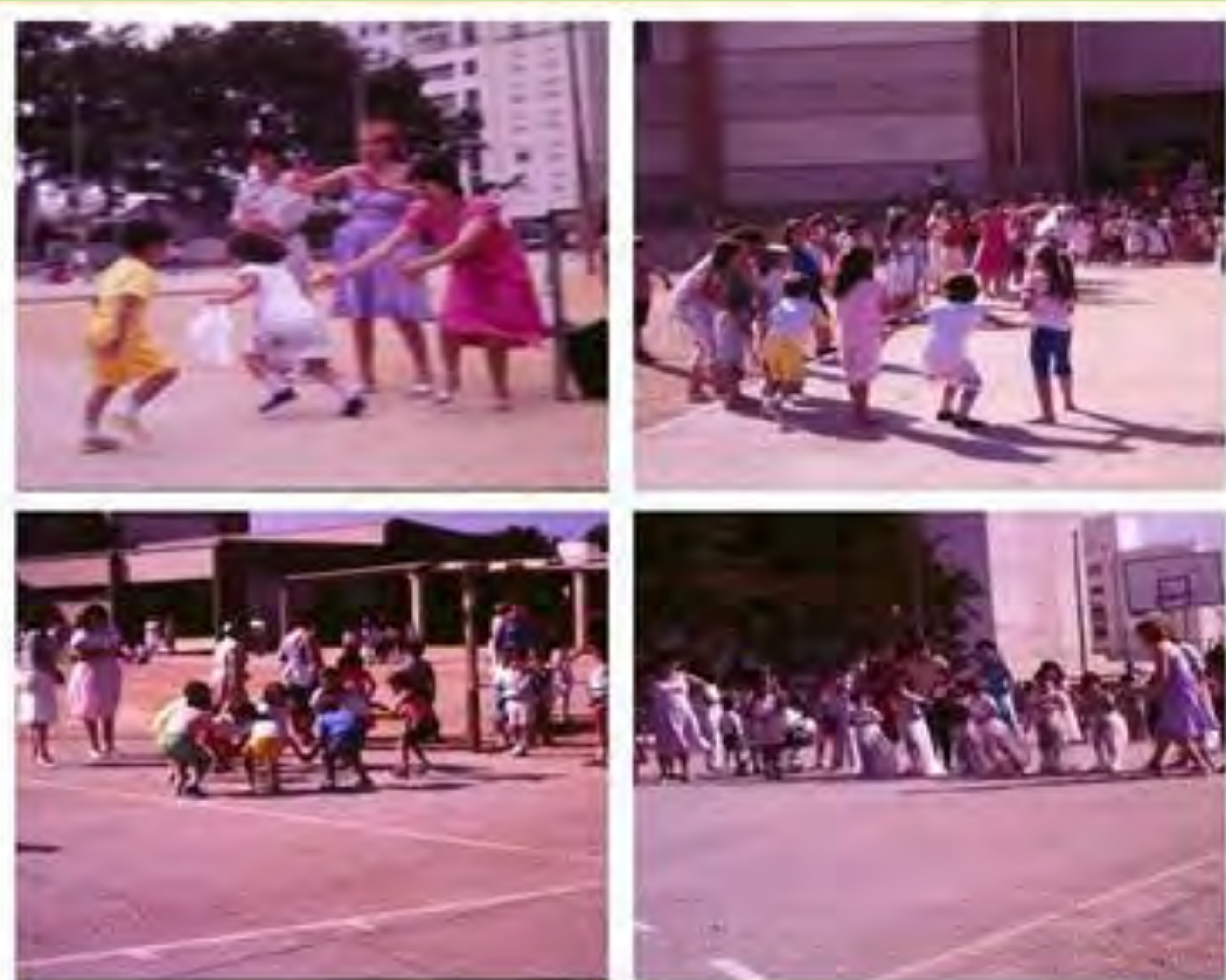
"Es pot apreciar el pati del col·legi i els jocs populars: el mocador, carrera de sacs o jugar a rogle". Col·legi San Pascual. Torrent. 1985.