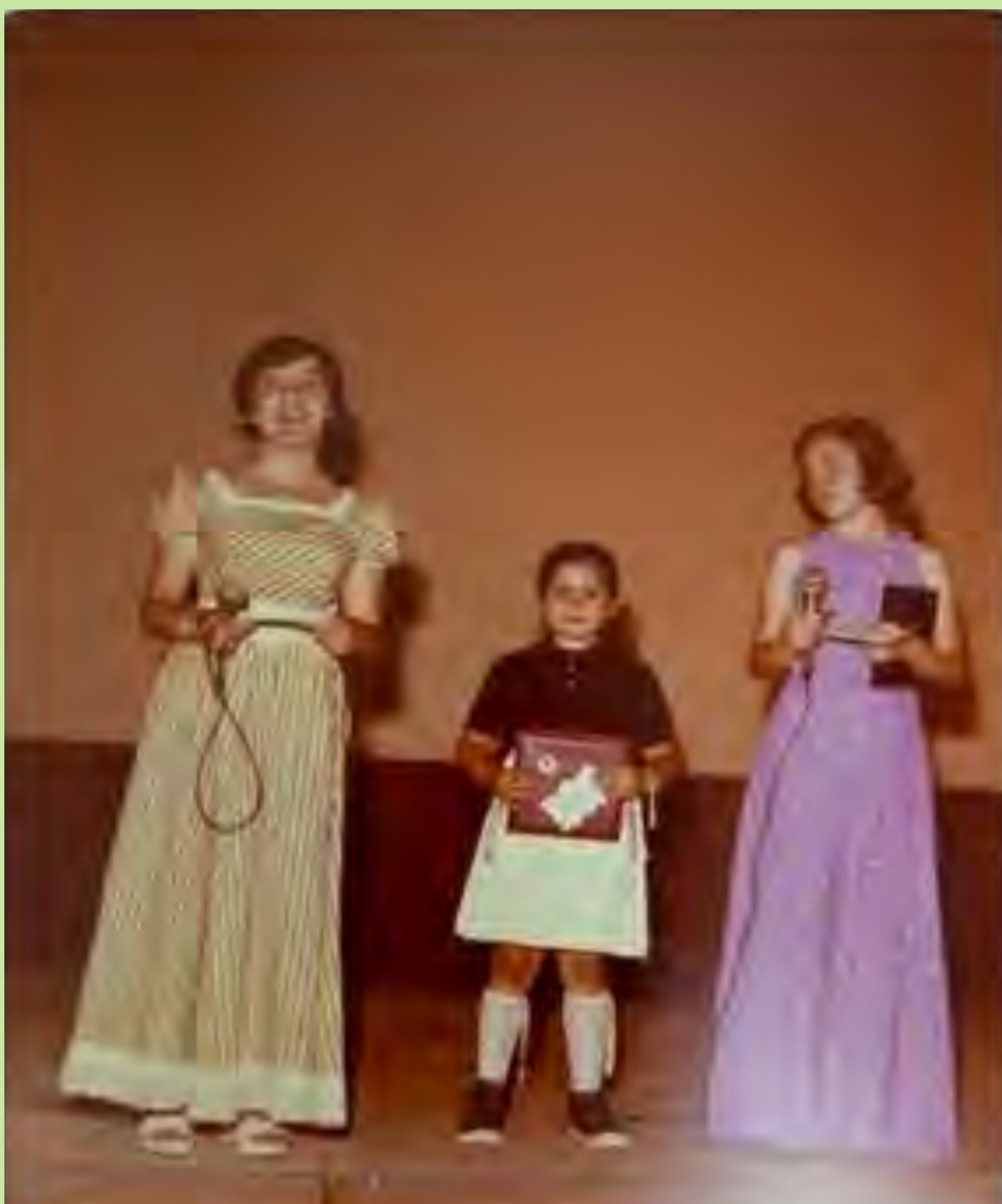
"En aquest Centre tenien el costum de donar a les 3 millors alumnes de cada curs una placa al final de curs". Trinitàries de Castellar. 1975.

Els butlletins de notes es converteixen en informes d'avaluació contínua o butlletins de qualificació, del qual desapareixen les tradicionals qualificacions numèriques.