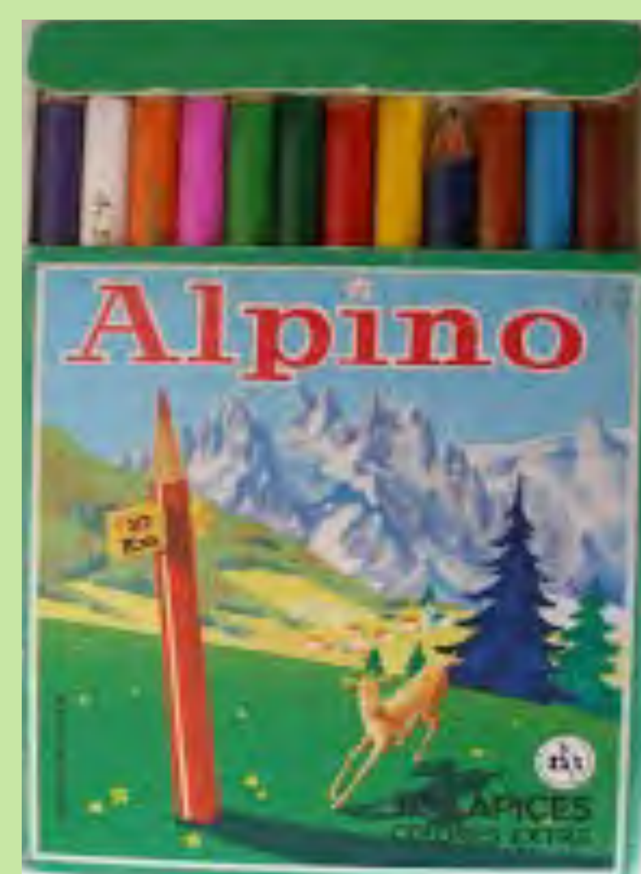
Regal de la comunió. Aiello de Malferit. 1974