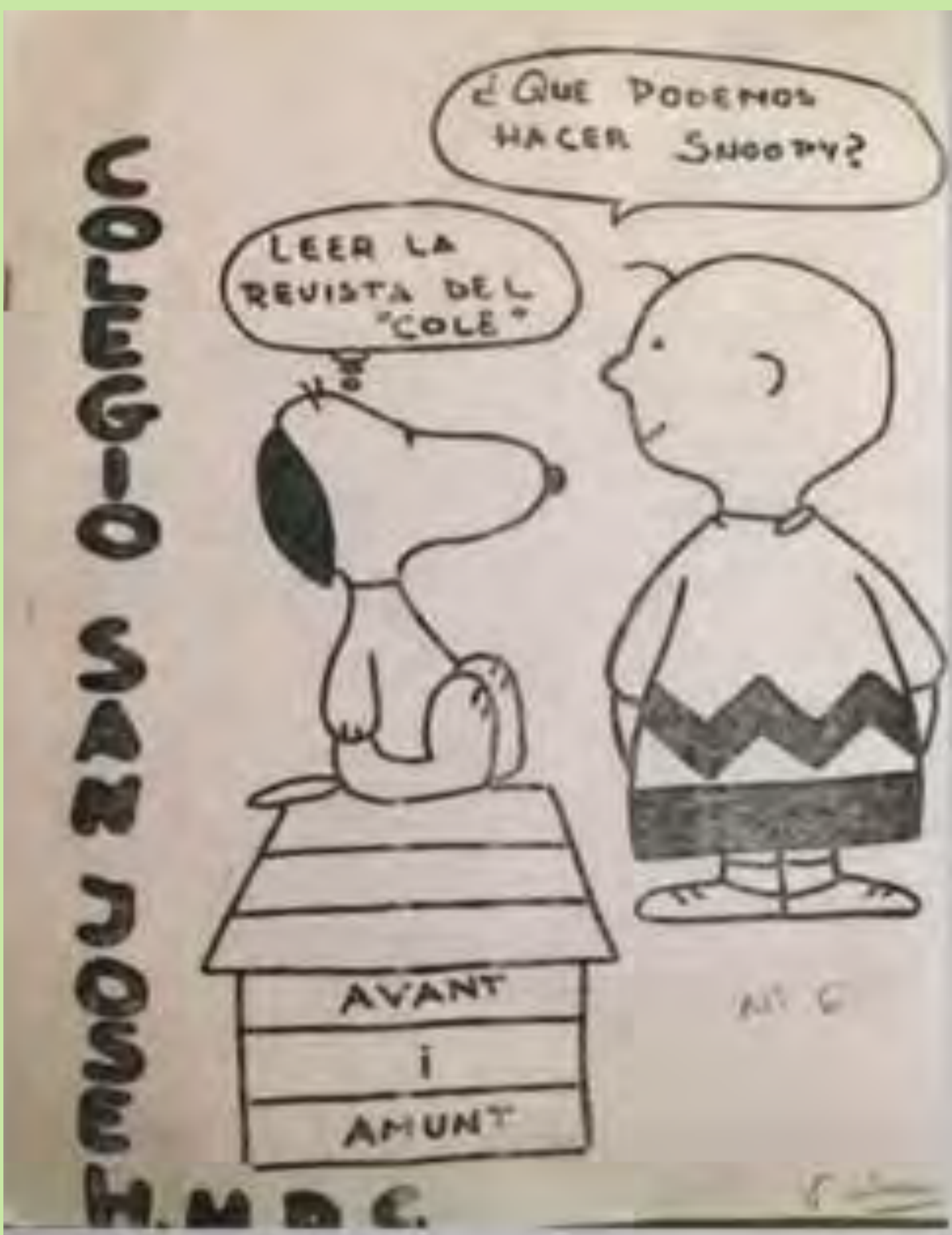
"Tota la revista estava feta pels alumnes, tant els textos com els dibuixos". Col·legi San José HHDC. Tavernes de la Valldigna. 1982-1983.