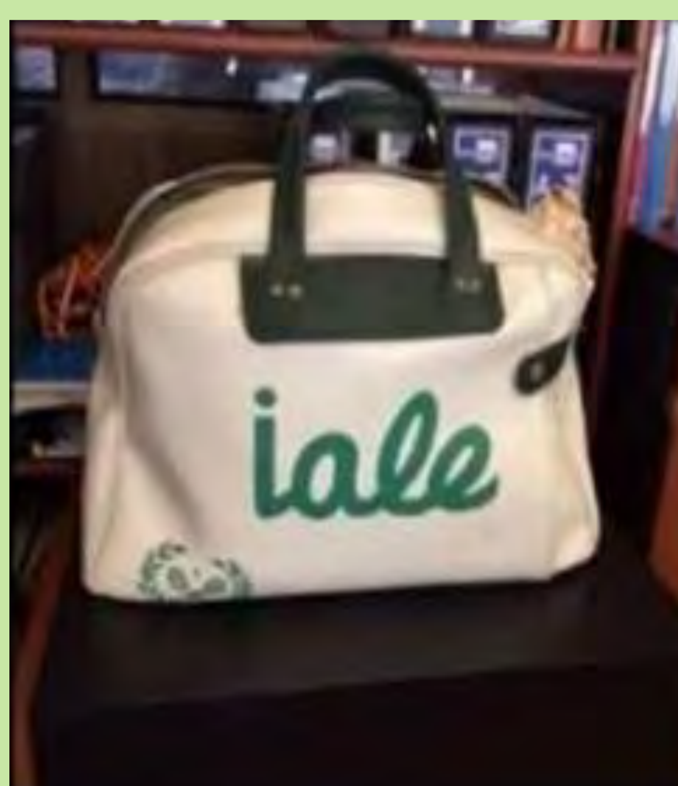
Borsa d'Educació física. Col·legi Iale. València. 1975.

El record d'aquests anys està tenyit de verd: el de pissarres, tauletes i cadieres individuals, i dels rajolets dels corredors dels edificis recentment inaugurats. I en la memòria escolar romanen les bosses i els estoigs de plàstic per guardar bolígrafs i retoladors de colors; els imprescindibles quaderns d'anelles; els xandalls de gimnàstica, les carpetes folrades amb fotos dels esportistes o cantants favorits i, prefigurant una nova era, sorgiria un element gairebé màgic: les primeres calculadores.