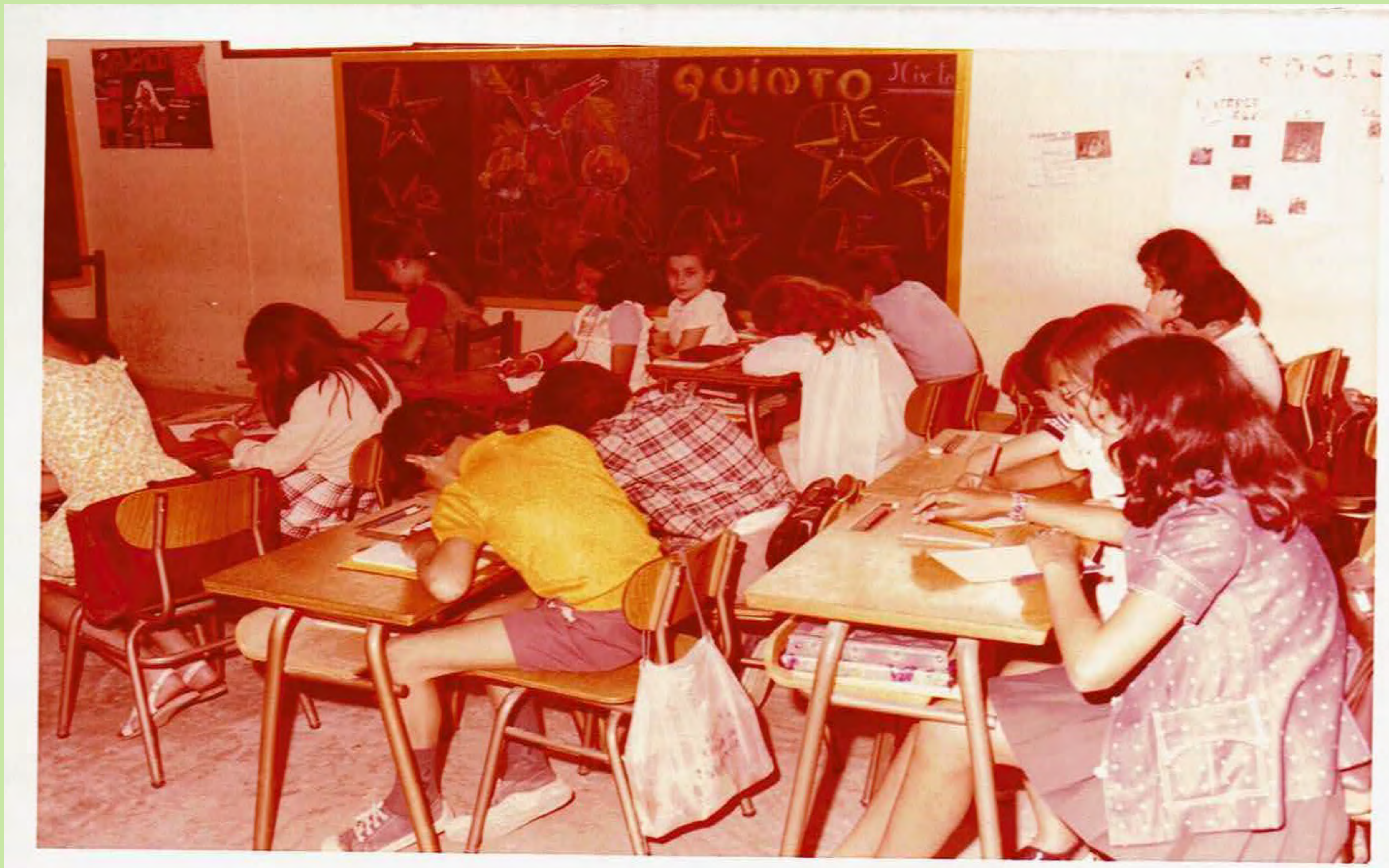
Grup Escolar Balmes. València. Curs 1973-1974