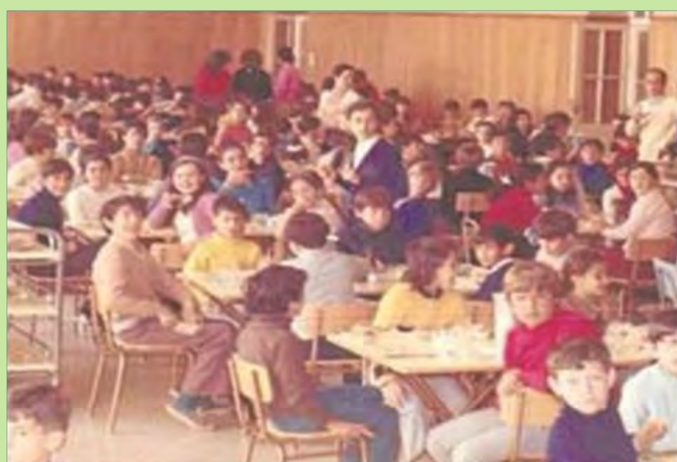
"Menjàvem tots junts xics i xiques, separats per cicles en diferents taules. Abans de menjar es beneïa la taula. Fins que no t'acabaves tot allò que hi havia en el plat, no podies alçar-te de la cadira. Col·legi Sant Josep. Jesuïtes de València. 1979.