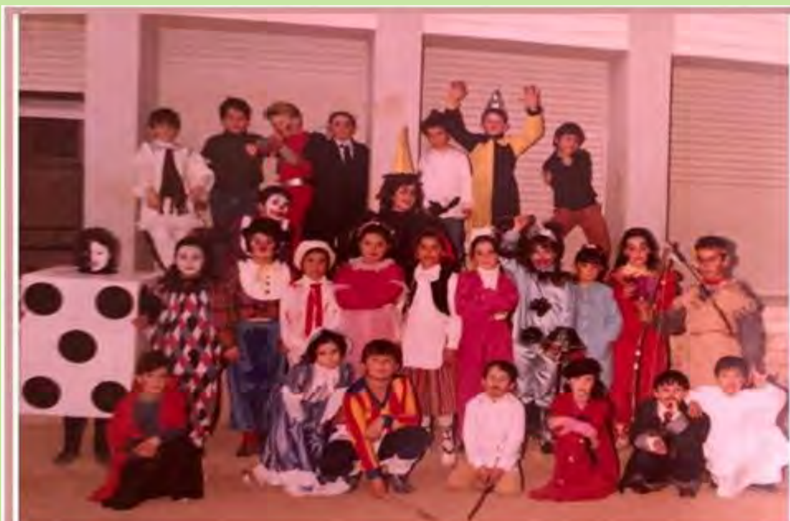
"A carnestoltes cadascú ens disfressàvem amb el que teníem a casa. Després fèiem el passacarrer pel poble." C.P. L'Alcúdia de Crespins. 1981.

És un alumnat que s'apropiarà del nous espais de convivència, socialització i aprenentatge que van sorgir: compartiran un pati comú, gaudiran en uns menjadors imprescindibles en una organització escolar que fomenta les concentracions i faran que l'autobús, més enllà d'un mitjà de transport, siga un facilitador dels moments, plens de confidències, que marquen l'inici i el final de la jornada.