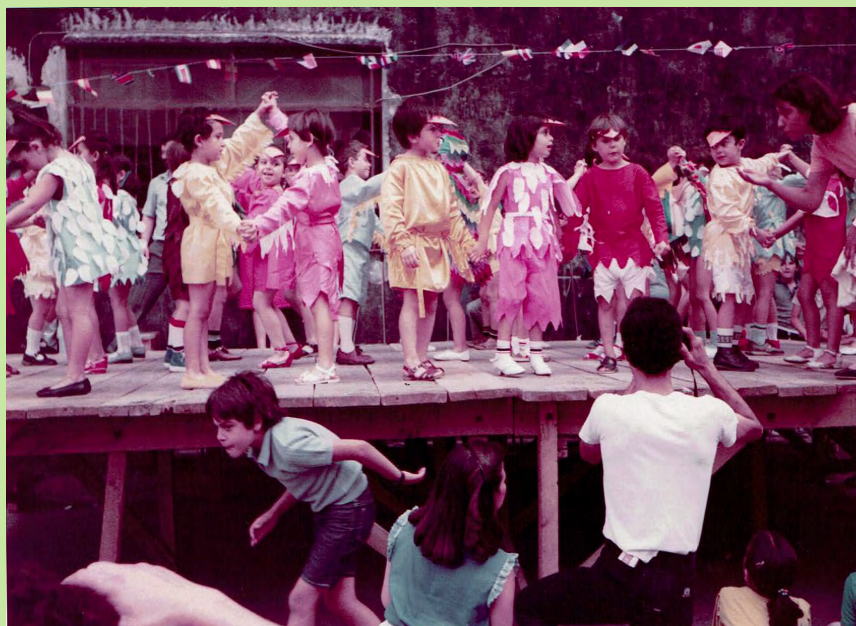
Festival fi de curs. Escola Fergo, barri Sant Marcel·lí. València. Celebraven el fi de curs amb balls i play-backs i convidaven a totes les famílies. 1982