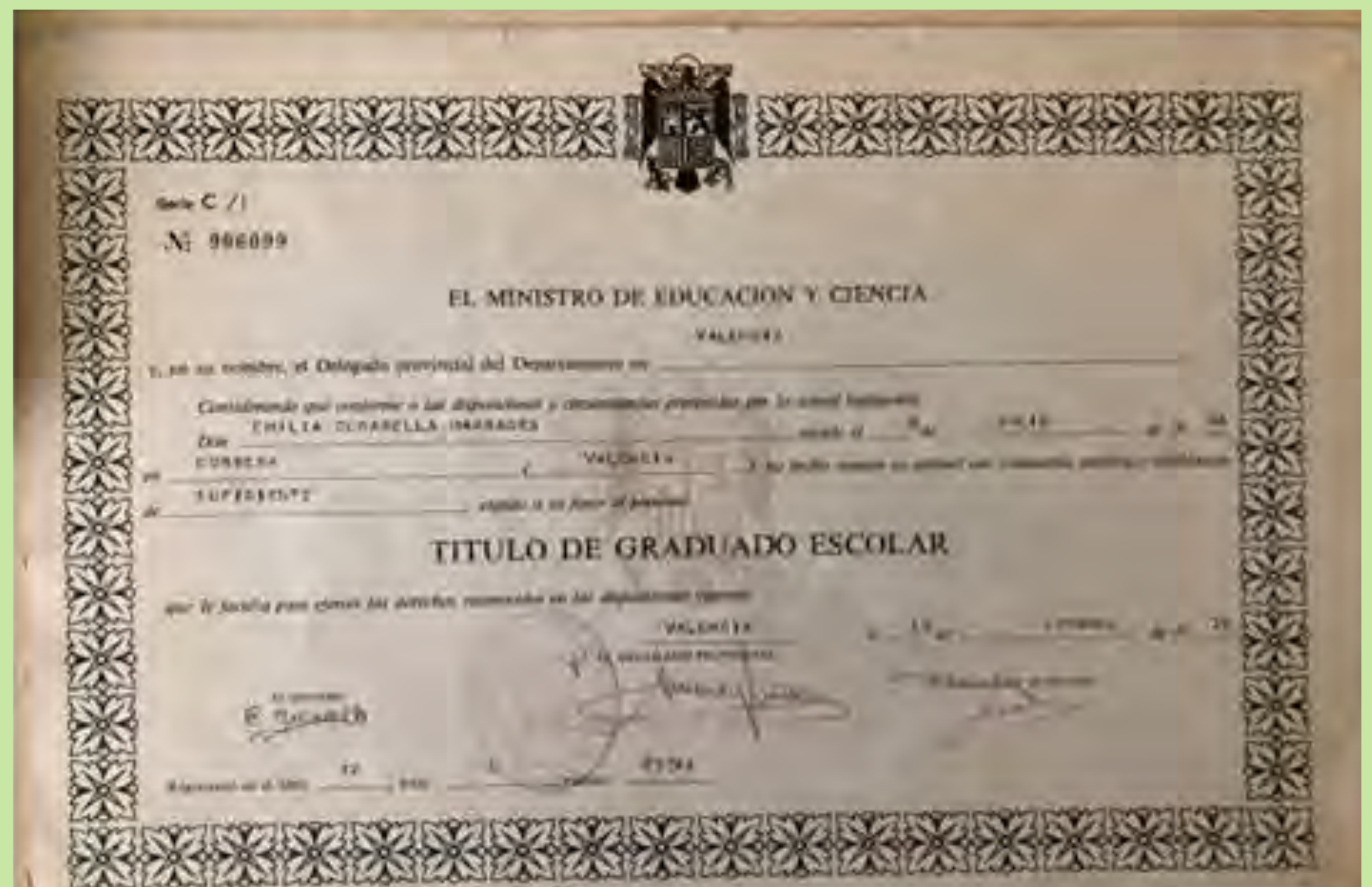
"Es tracta del graduat escolar. Aquest títol no t'ho donaven si no tenies aprovats tots els cursos". Corbera. 1979.

L'avaluació passa a ser part del procés d'ensenyament i representa, no un acte puntual, materialitzat en un examen, sinó un mitjà perquè xiquetes i xiquets avancen en el seu procés d'aprenentatge. I amb aquest canvi sorgiran nous mètodes per a recollir mostres d'aprenentatge.