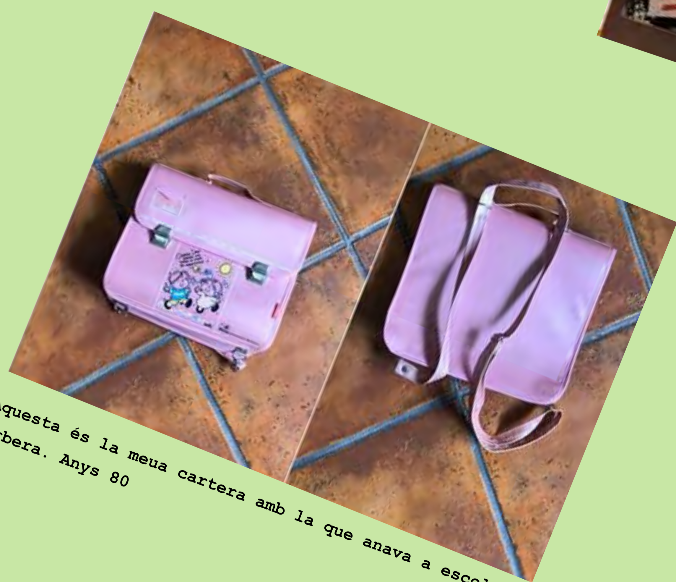
"Aquesta és la meua cartera amb la que anava a escola." Corbera. Anys 80