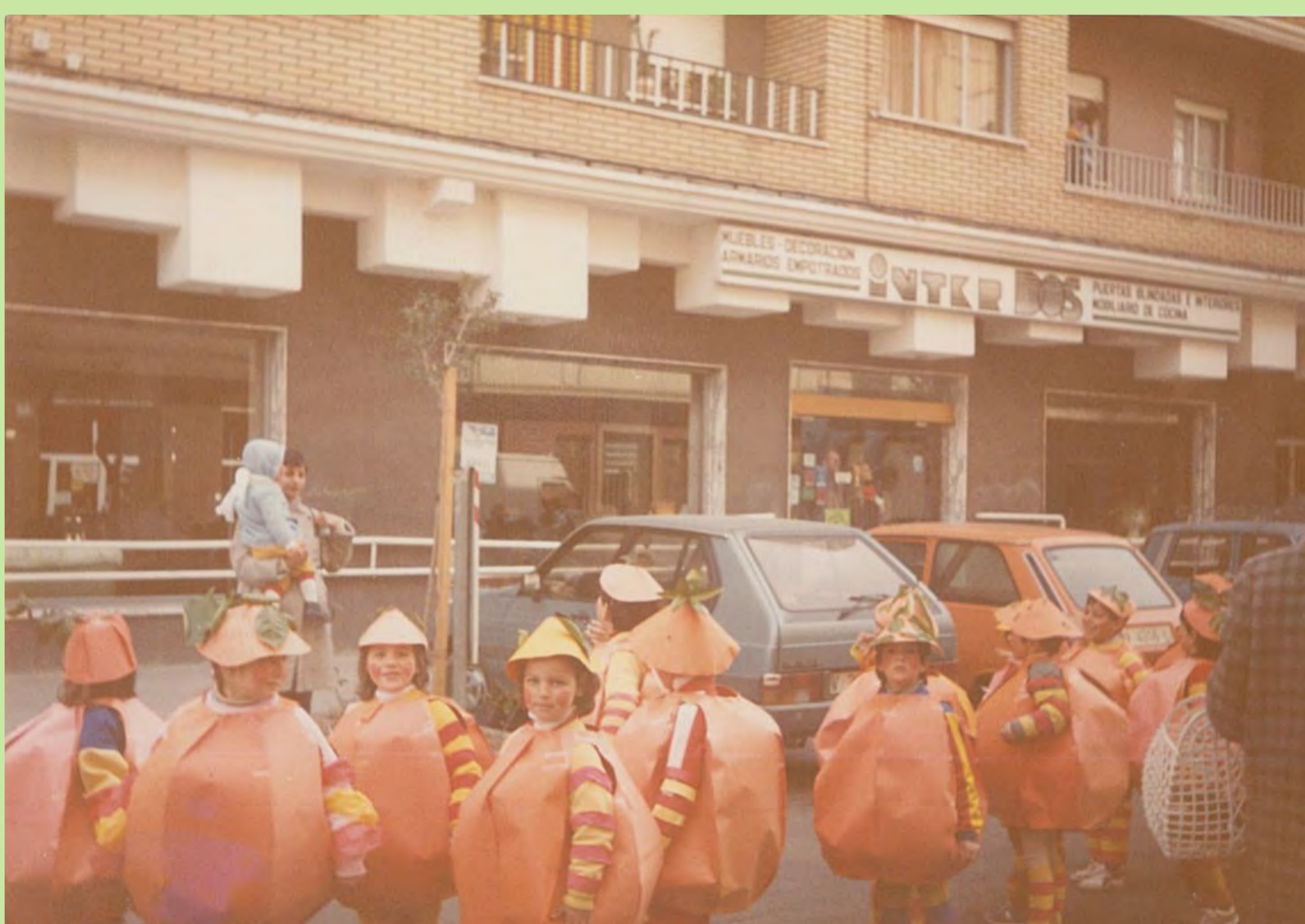
"La foto és quan va arribar a les nostres vides "naranjito" la mascota de la Copa Mundial de Futbol". C.P. Aldaia. 1982.