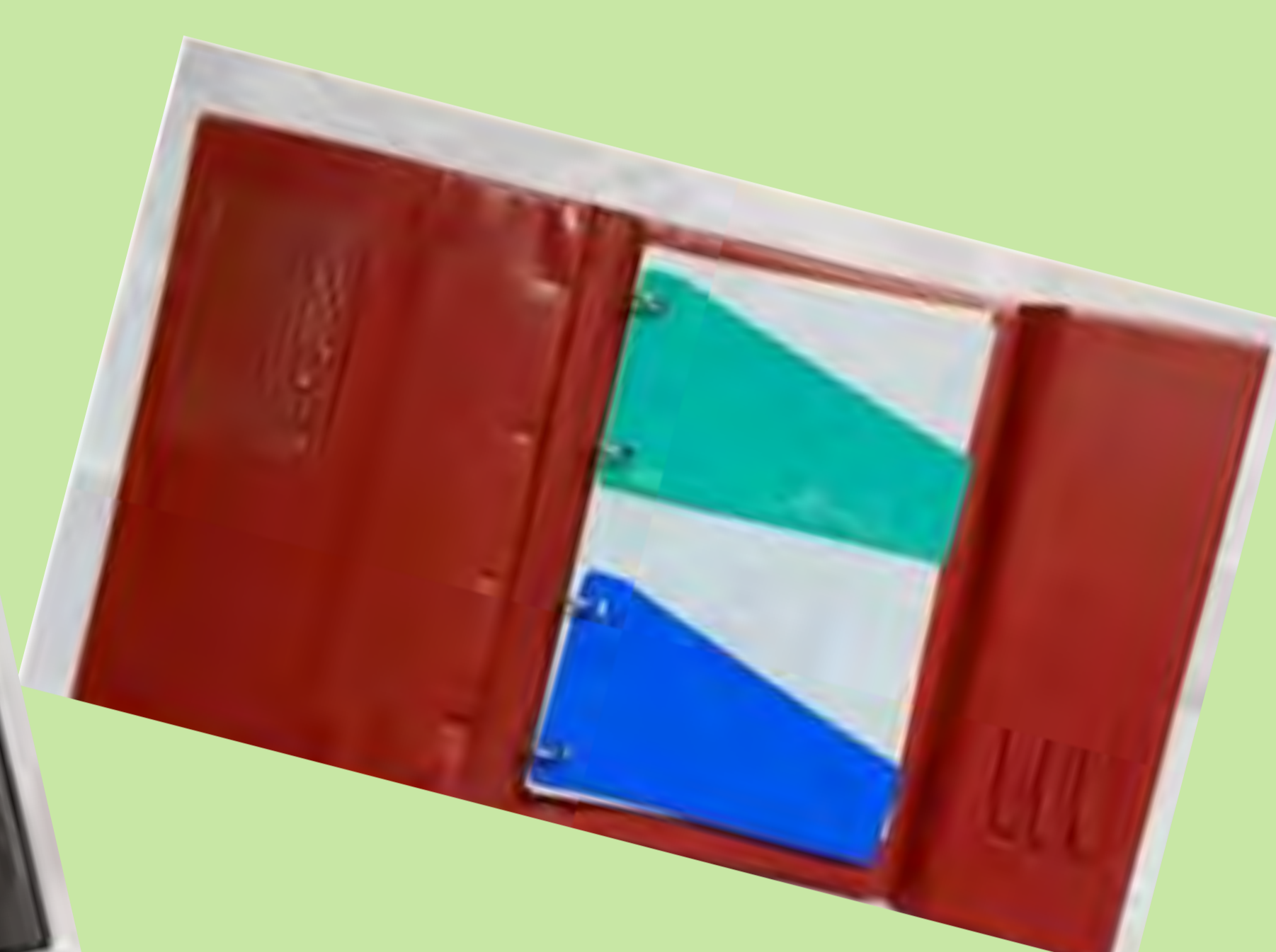
"Jo les utilitzava per a dues assignatures, una per separador i cada avaluació canviava les fulles". Col·legi Sant Josep de Calassanç. Aielo de Malferit. 1983.