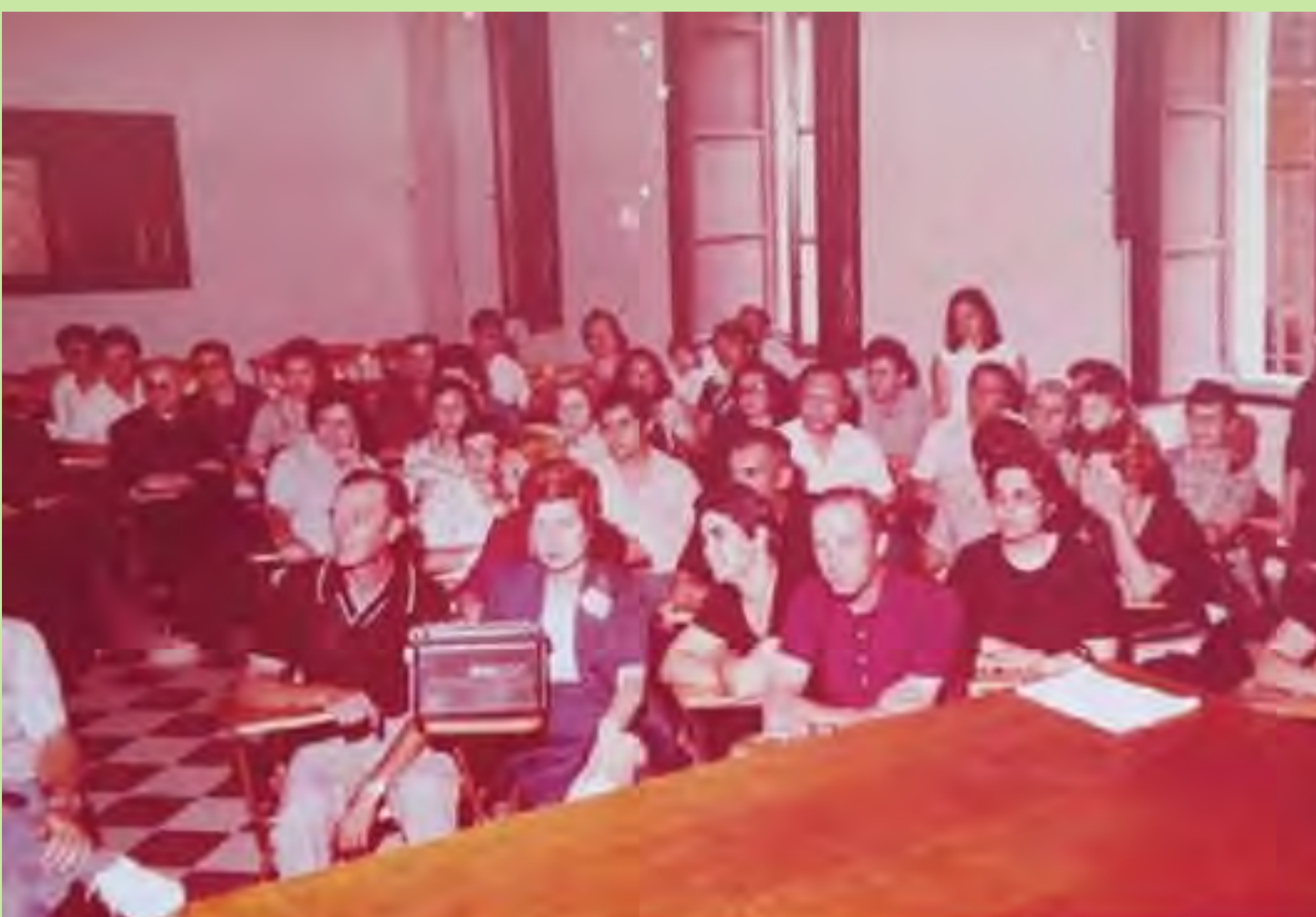
"Reunió de pares dirigida pel director del centre, els professors i les monges". Internat de la Escolania de Nuestra Señora de los Desamparados. València. 1977.

La participació de les famílies en l'escola va adquirir una major visibilitat en aquests anys de reforma. Referent a açò, la LGE posava l'accent en els drets i els deures de les famílies i la necessitat de constituir associacions de pares d'alumnes (APA), tal com es denominaven des de 1964, quan van començar a crear-se'n. Mares i pares van anar adquirint un major compromís amb el projecte escolar de les seues filles i fills.