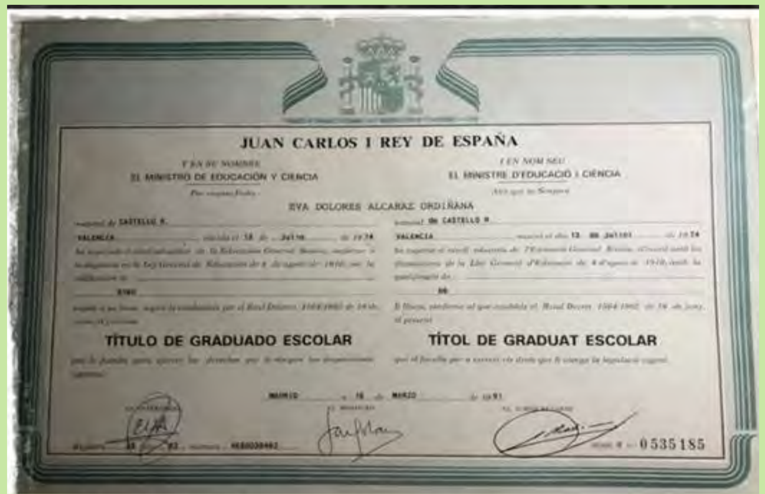
"Aquest és el meu títol de Graduat Escolar que ens donaven en finalitzar l'EGB". CP Verge del Remei. Castelló de Rugat. 1991.