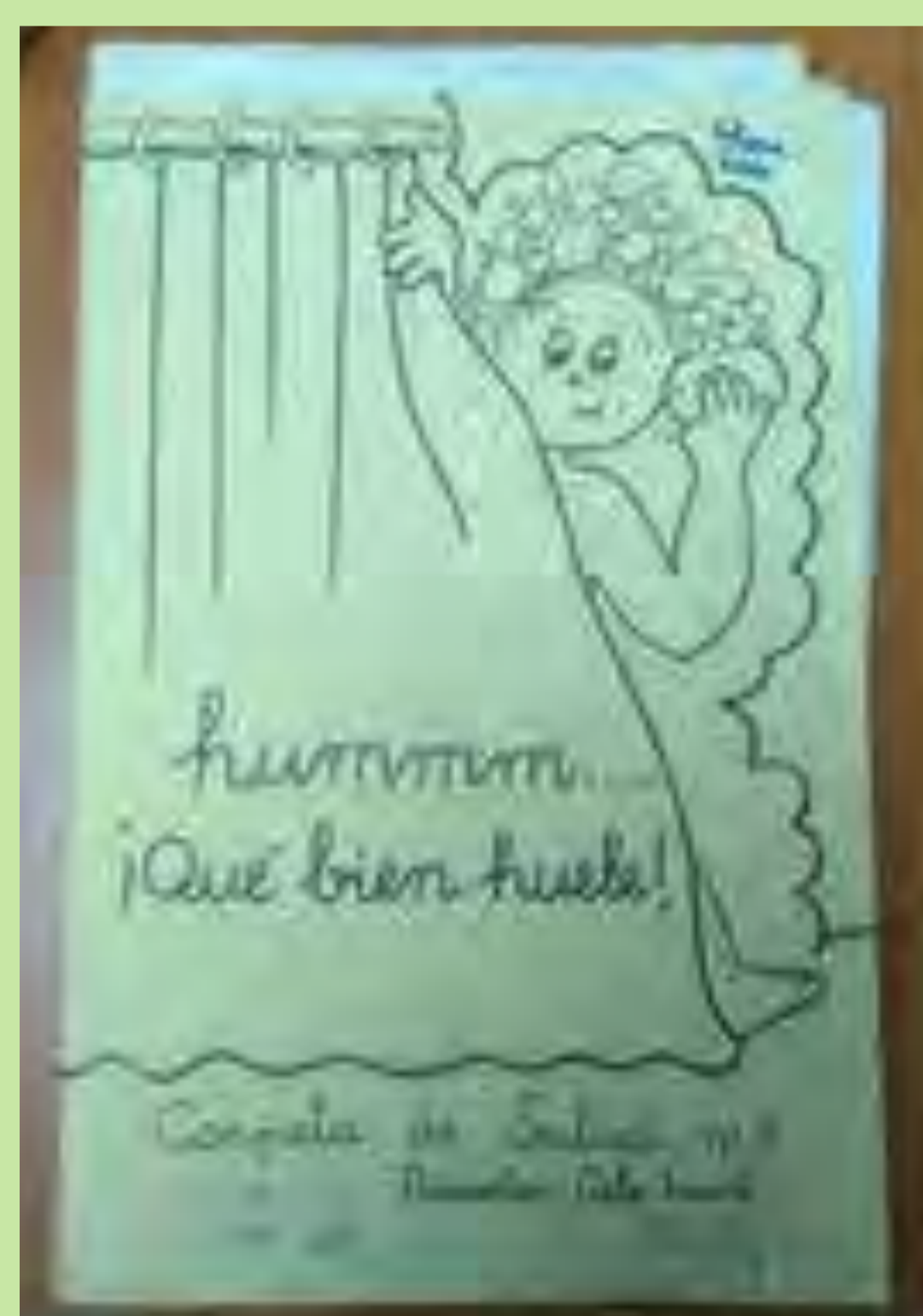
"Aquestes fitxes les vaig fer quan tenia 3 anys. El tema era la salut". Col·legi Félix Rodríguez de la Fuente. Manises. 1988-1989