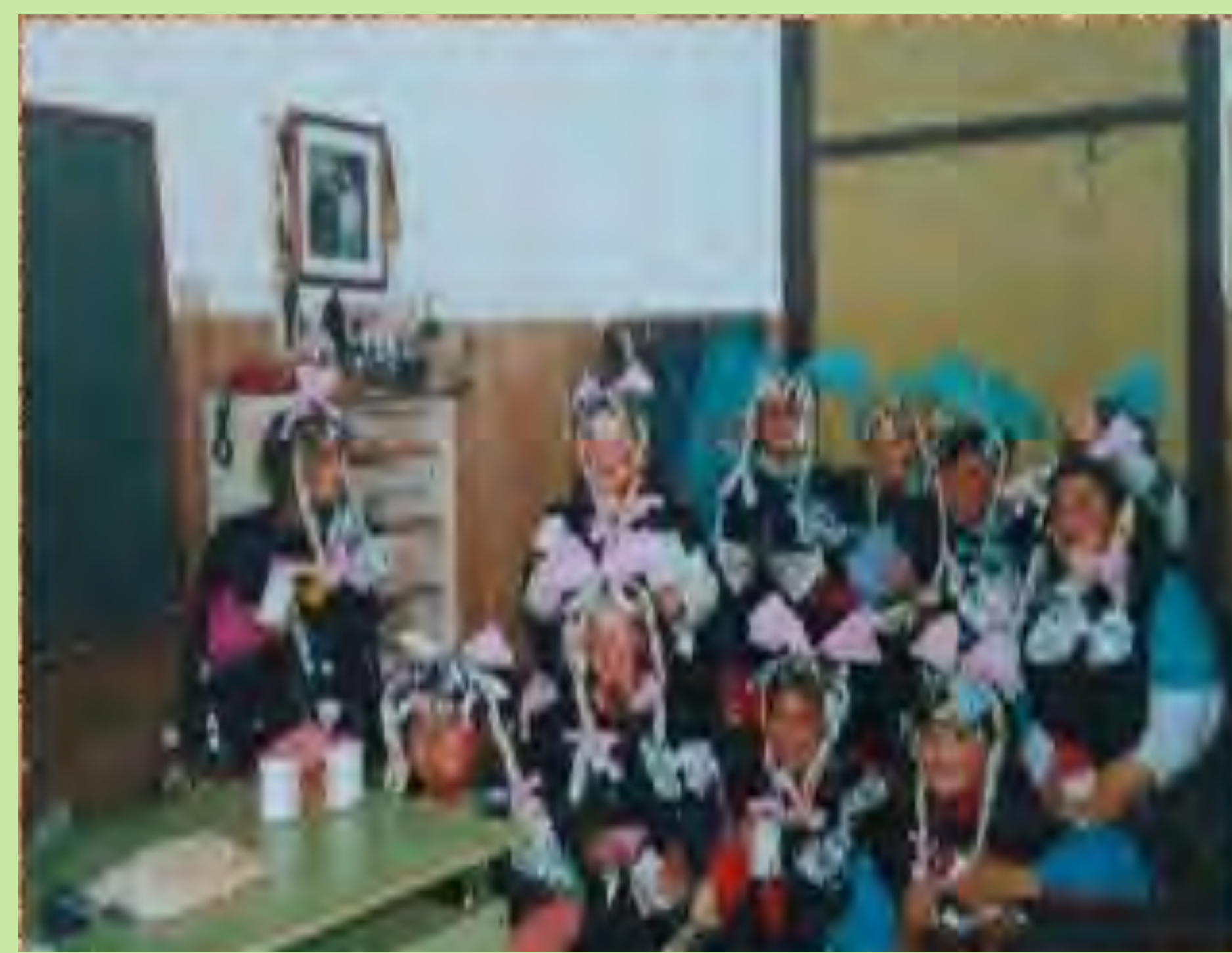
Carnestoltes. Disfressats d'escombraries amb material reciclat. Col·legi Ausiàs March. Rafelcofer. 1991-1992

Açò es va plasmar en l'existència d'unes aules on xiquets i xiquetes estaven conjuntament i el professorat era accessible i dialogant. La fi dels càstigs físics i la presència, cada vegada major, de les llengües cooficials en l'escola, van ser també les fites essencials d'aquest període. De fet, a la Comunitat Valenciana es va produir una extraordinària mobilització d'agents i entitats (escoles d'estiu, intel·lectuals, col·lectius de mestres de diferents comarques, etc.) vinculats a la renovació pedagògica que apostaven ja en la pràctica per una escola en valencià.