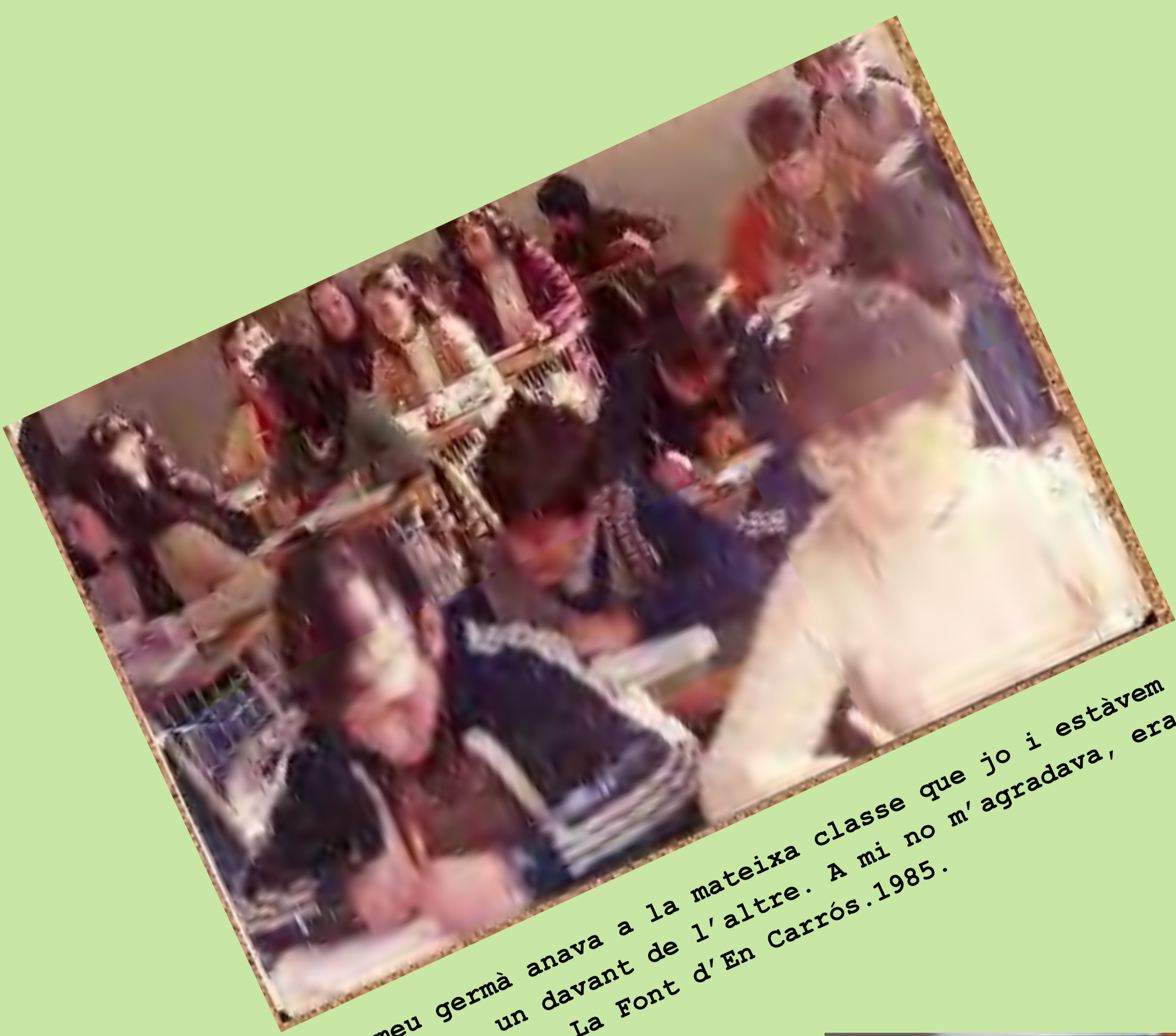
El meu germà anava a la mateixa classe que jo i estàvem separats, un davant de l'altre. A mi no m'agradava, era avorrit. C.P. La Font d'En Carrós.1985.