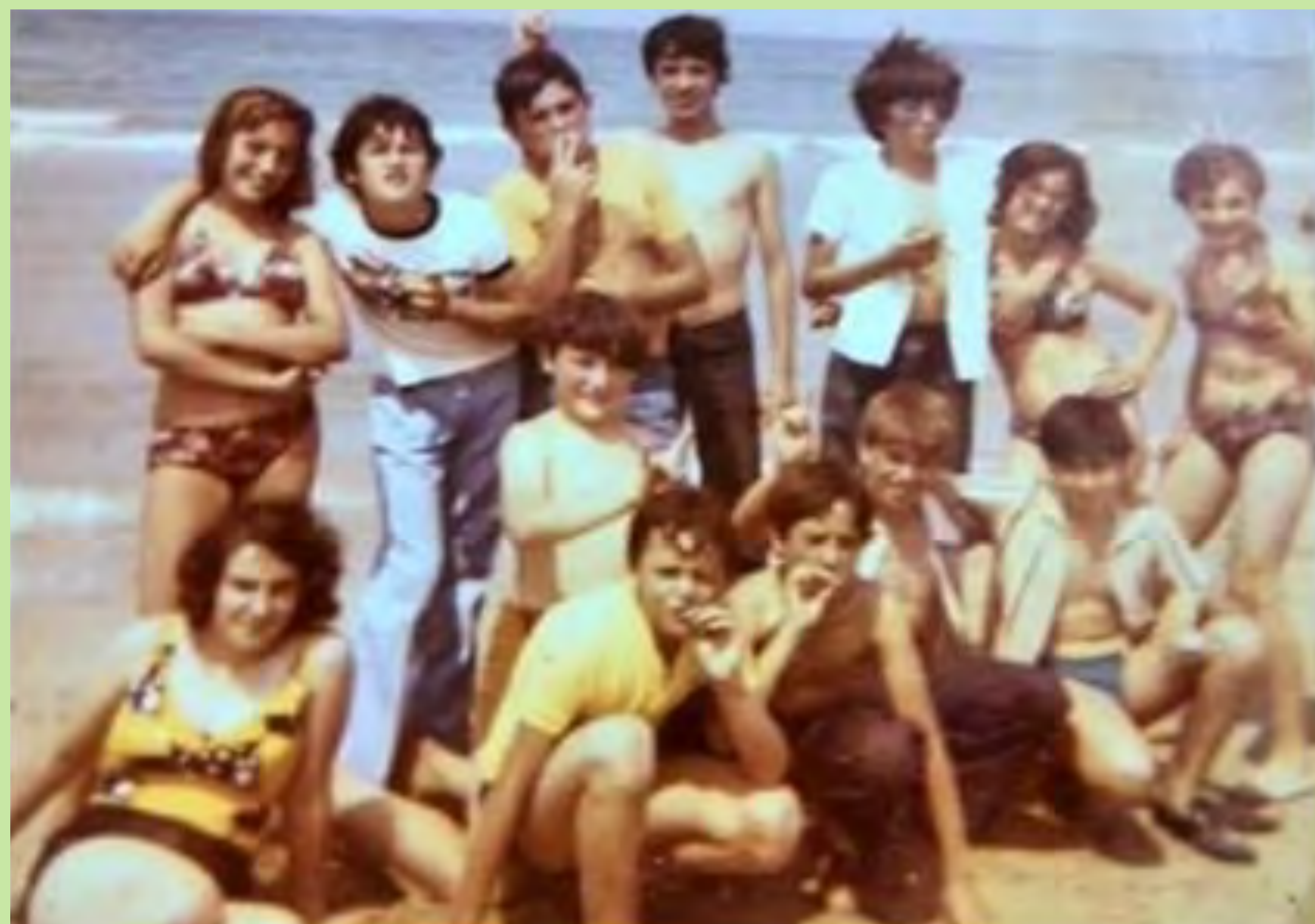
"Amb els companys de col·legi. Per fi xiquets i xiquetes estàvem junts!". Excursió a la Platja de la Patacona. C.P. de Carcaixent. 1981.

En 1985, amb el PSOE en el govern, la Llei orgànica del dret a l'educació (LODE) es va proposar, entre altres qüestions, fomentar la participació social en el funcionament dels centres escolars en un sentit plenament democràtic. Amb aquesta finalitat va establir mecanismes perquè pares i mares, professorat i alumnat participaren en la gestió, el control i el desenvolupament del projecte educatiu dels centres, a través dels consells escolars, entre altres òrgans.