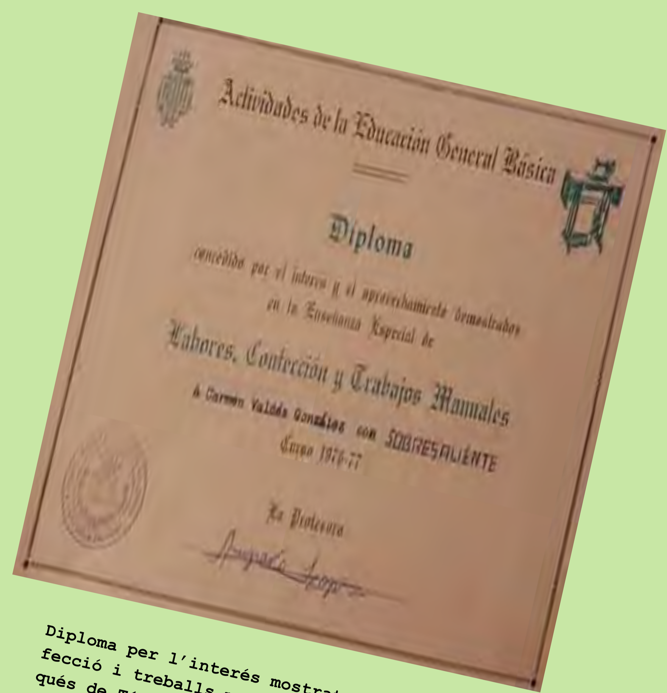
Diploma per l'interés mostrat en Labors, confecció i treballs manuals. Col·legi Primer Marqués de Túria. València. 1977.

L'aprovació de la Llei general d'educació (LGE), en 1970, coneguda com a llei Villar Palasí pel ministre que la va impulsar, va suposar l'arribada de la tecnocràcia franquista fins a l'educació. Calia readaptar el sistema educatiu a l'Espanya sorgida del desenvolupament econòmic i social dels anys seixanta que s'endinsava en un procés d'industrialització.