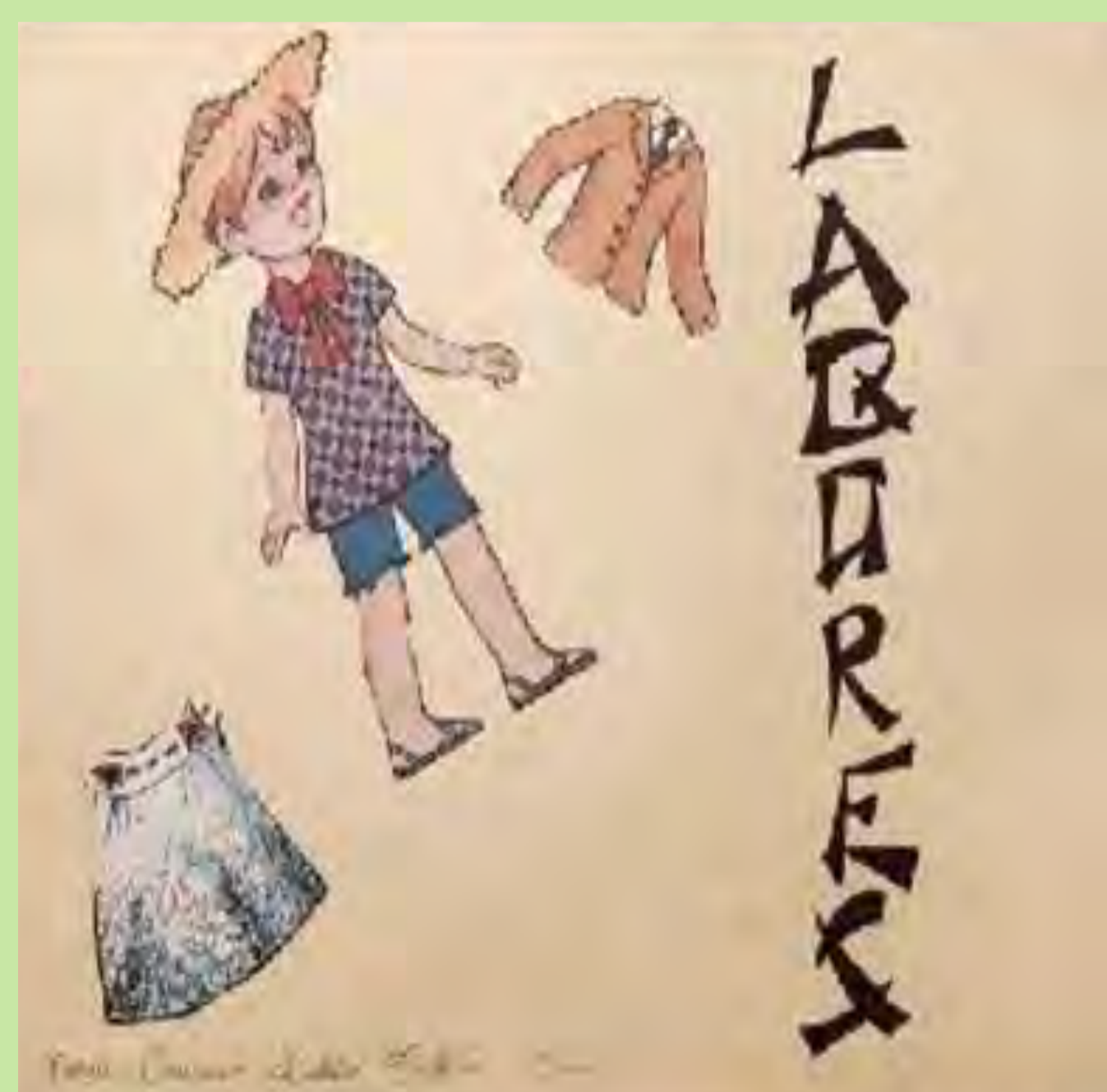
Dossier de l'assignatura "labores". Mentre, els xics feien tecnologia. 1973.

La introducció del valencià -primer, com a matèria voluntària, i obligatòria a partir de la Llei d'ús i ensenyament del valencià (1983)- transformaria totalment els materials didàctics. Als textos d'aprenentatge del valencià s'uniran els de les respectives matèries en valencià. Una autèntica revolució que permetrà la construcció d'una escola valenciana i en valencià.