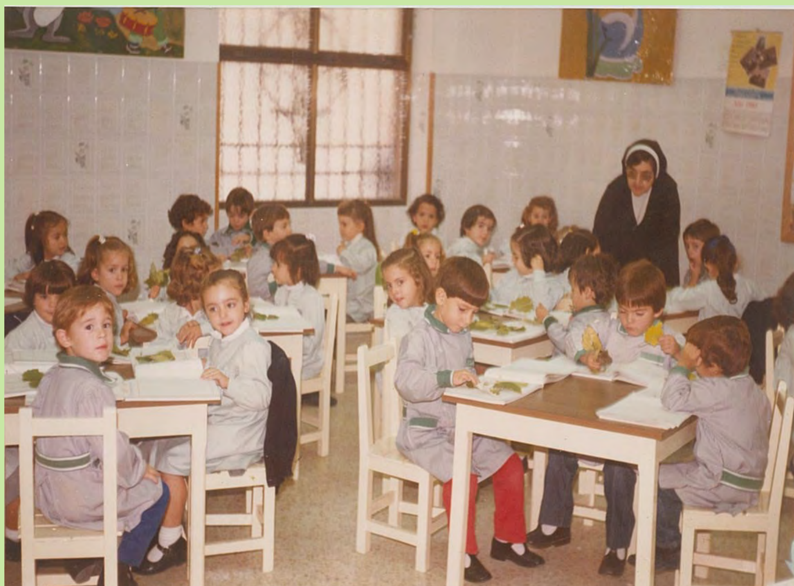
"Ens limitàvem a fer fitxes, fitxes i més fitxes". Col·legi Madre Josefa Campos de Alaquàs.1983.

És un alumnat que s'apropiarà del nous espais de convivència, socialització i aprenentatge que van sorgir: compartiran un pati comú, gaudiran en uns menjadors imprescindibles en una organització escolar que fomenta les concentracions i faran que l'autobús, més enllà d'un mitjà de transport, siga un facilitador dels moments, plens de confidències, que marquen l'inici i el final de la jornada.