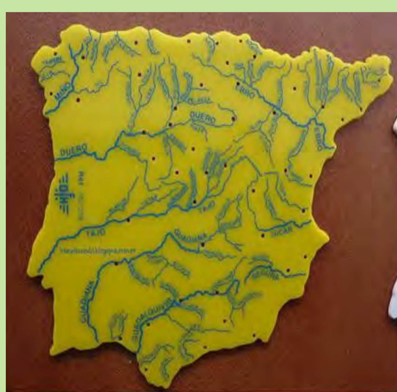
"Aquestes plantilles eren per dibuixar el mapa d'Espanya". València. 1982.

Les tècniques audiovisuals s'instal·laren a les aules, que es veieren dotades de projectors de diapositives, de cine super-8 i de retroprojectors, en un intent de configurar una educació activa, significativa i atractiva, on ocupaven un lloc important l'elaboració conjunta de materials originals per part del professorat i l'alumnat.