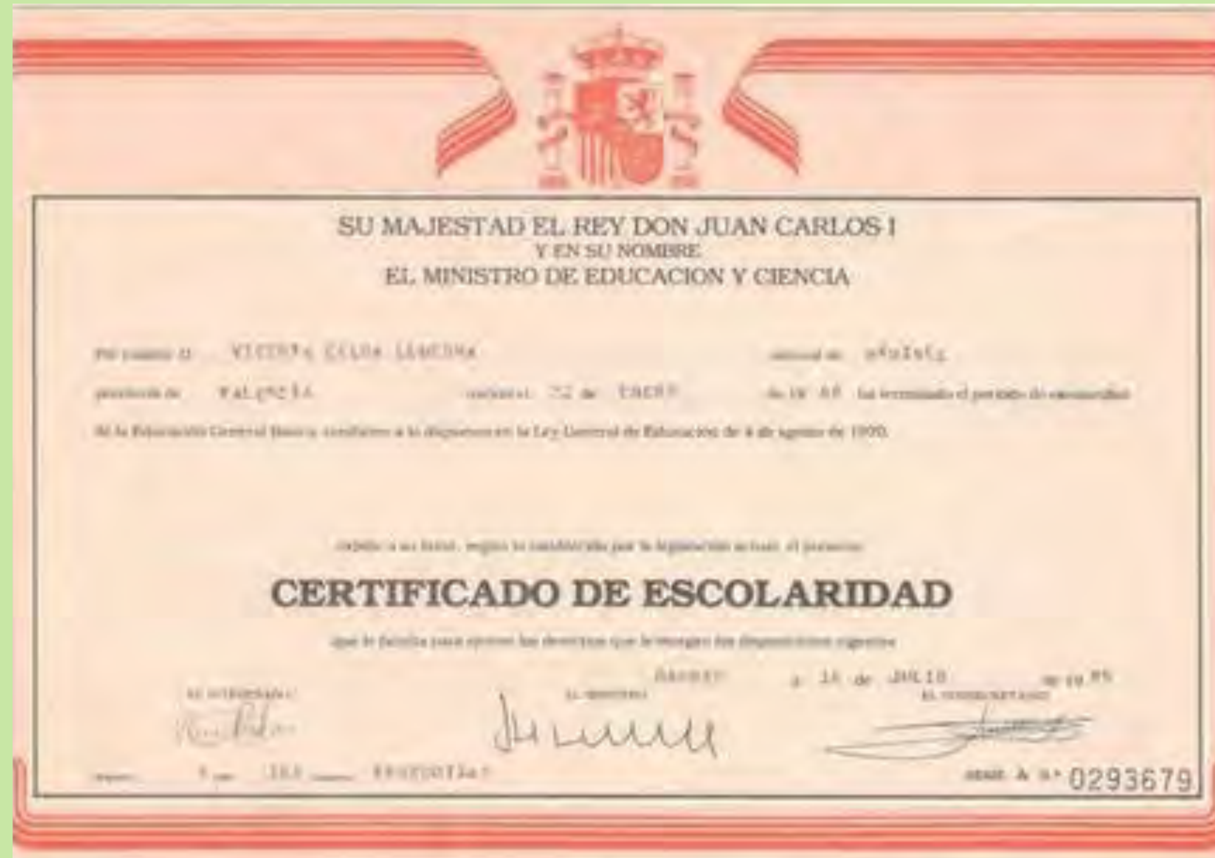
"Aquest és el meu certificat escolar que vaig rebre quan vaig acabar els anys d'escolarització obligatòria". Col·legi Públic Sant Miquel. 1985.

Comencen a tenir-se en compte els comportaments individuals, l'actitud de xiquetes i xiquets i l'impacte de l'avaluació a l'escola en el seu conjunt. Aquesta nova concepció de l'avaluació es plasma en una nova dinàmica a l'aula, un augment del treball cooperatiu i en la realització de tasques individuals que no s'havien utilitzat amb anterioritat. Són una recopilació de mostres de cada xiqueta i xiquet per a qualificar i usar l'avaluació com a instrument de millora del procés d'ensenyament i d'actitud, informacions que es recolliran en les fitxes de l'expedient acadèmic: l'ERPA (extracte de registre personal de l'alumne)