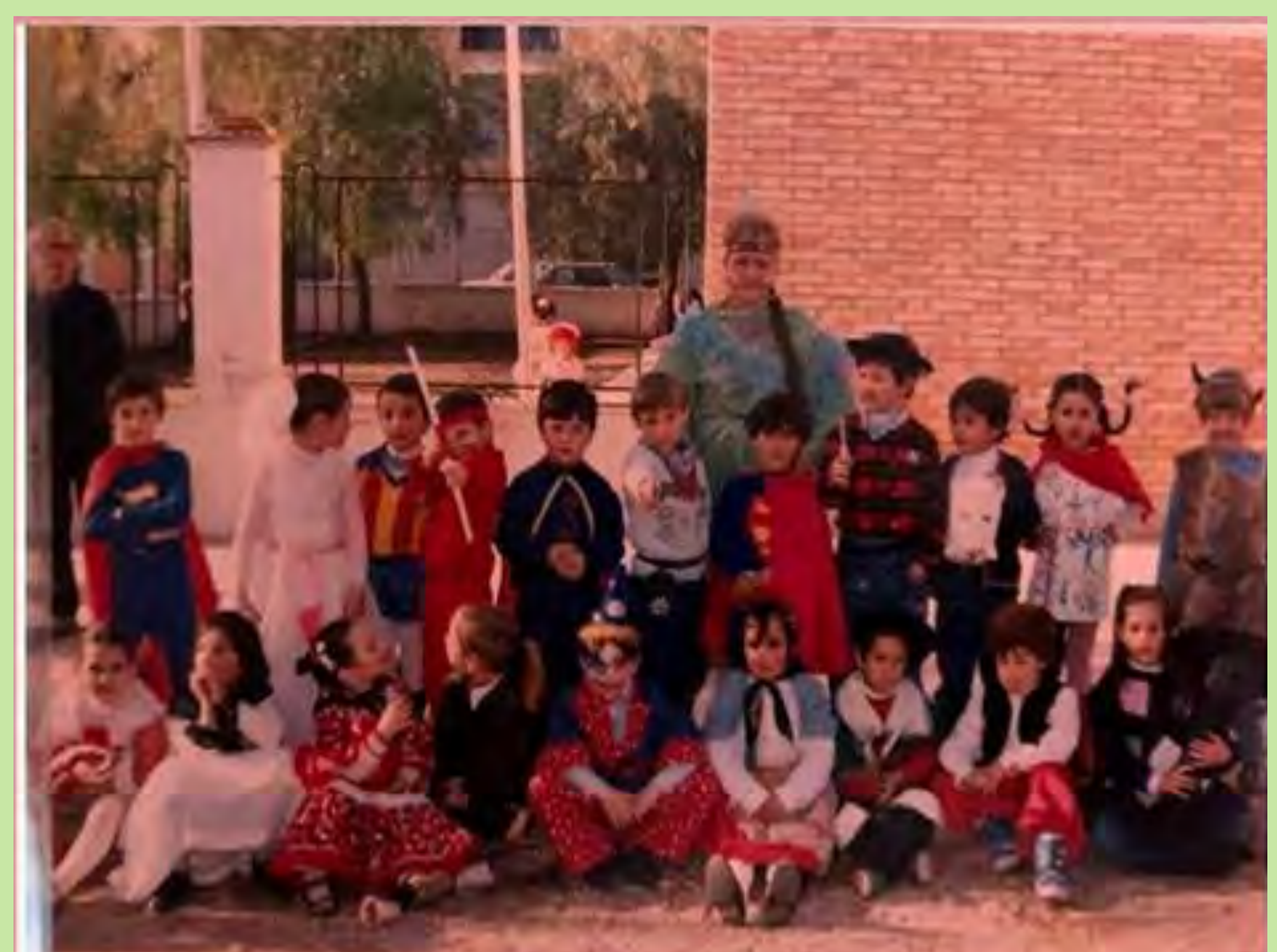
"En Carnestoltes, les mares de l'A.M.P.A. feien el xocolate i compraven les bambes". L'Alcúdia de Crespins. 1981.