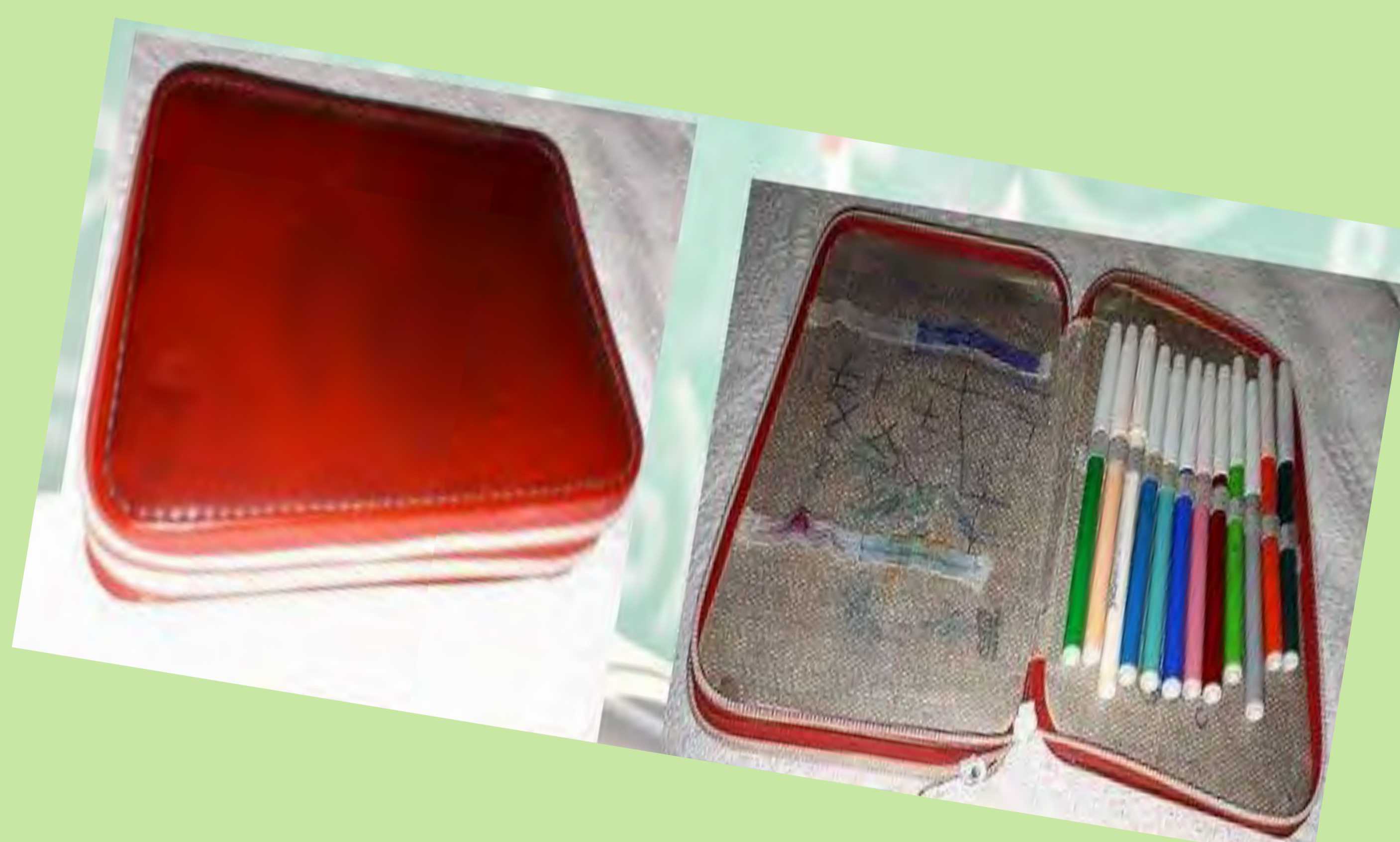
"Aquest va ser el meu primer estoig. Aleshores només en teníem un. Ho vaig portar durant tota la primària". Col·legi Sorolla. Picanya. 1984.

La cultura escolar està composta per diversos elements immaterials i materials. El marc legal, les persones que actuen a l'escola, la influència de l'entorn social més proper, les pràctiques escolars són part d'aquesta i també ho són elements materials com els edificis, el mobiliari o els accessoris. En l'imaginari col·lectiu de cada època, la representació que cadascú guarda de l'escola en la seua memòria inclou un edifici amb una estructura concreta, una aula amb una determinada decoració i mobiliari, a més d'una sèrie d'efectes personals com quaderns, estoigs, llibres que acompanyen el nostre pas per l'escola i s'han gravat en els nostres records.