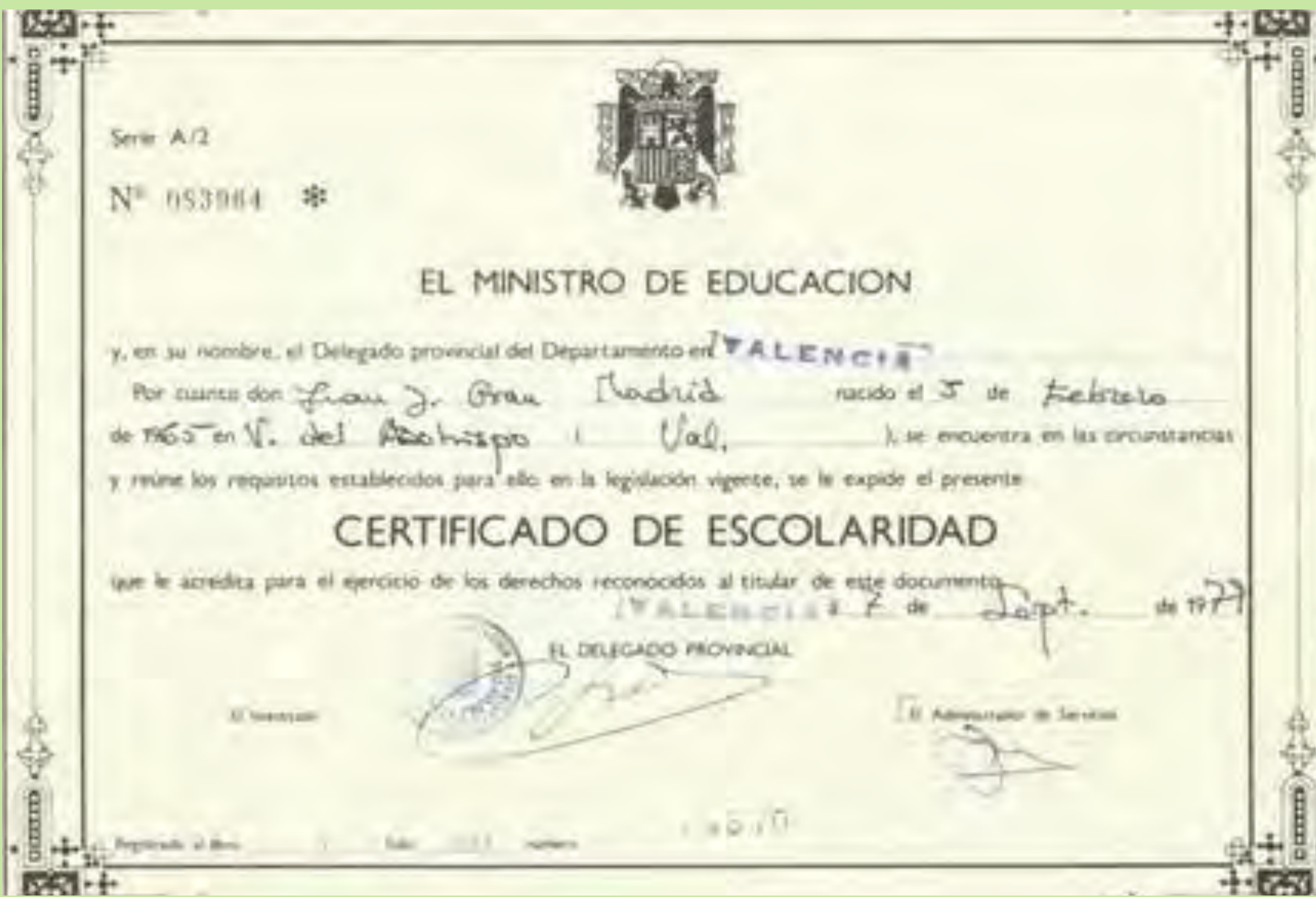
"Aquest és el meu certificat escolar que vaig rebre quan vaig acabar l'EGB". Col·legi Hermandad. Llíria. 1979.