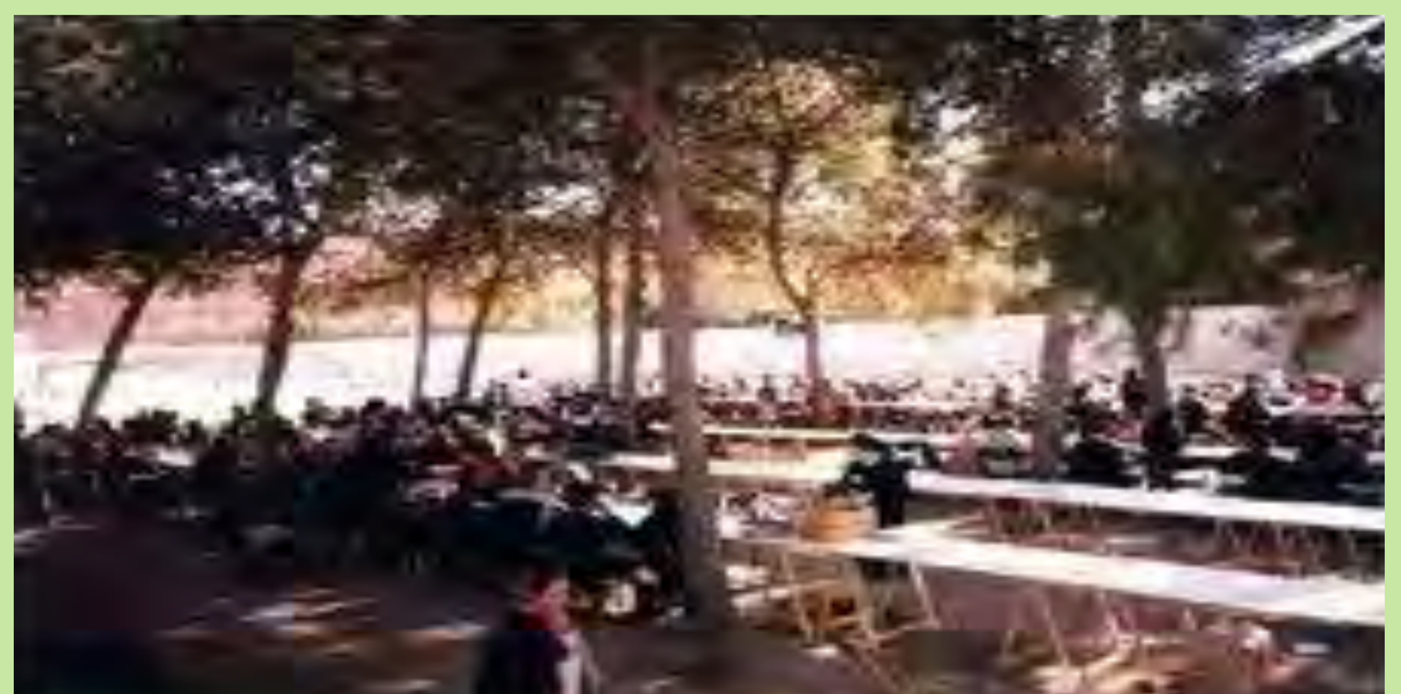
"Cada mes de juny era la convivència amb les famílies. Aqueix dia l'alumnat d'últim curs d'EGB, preparava un ball i diverses activitats". Col·legi Nuestra Señora del Carmen. Manises. 1985.