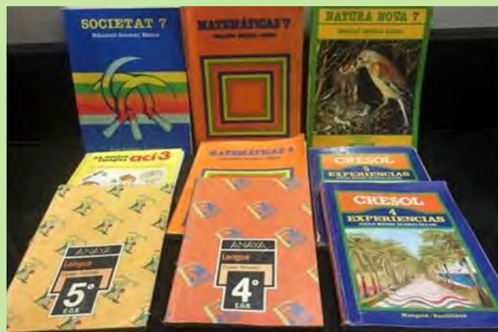
"Teniem un llibre per cada assignatura". (3er,4t,5é,5é,6é,7é E.G.B.). C.P. José Mollà. Canals. 1988-1993.

Nascuts en els apassionants i idealitzats anys seixanta, quan semblava que tot era possible, o membres del baby boom dels anys setanta, l'ampliació de l'obligatorietat d'escolarització entre els sis i els catorze anys, va fer que començaren a envair les aules i, així, van obligar a aplicar una democratització que superava la desitjada pel règim dictatorial.