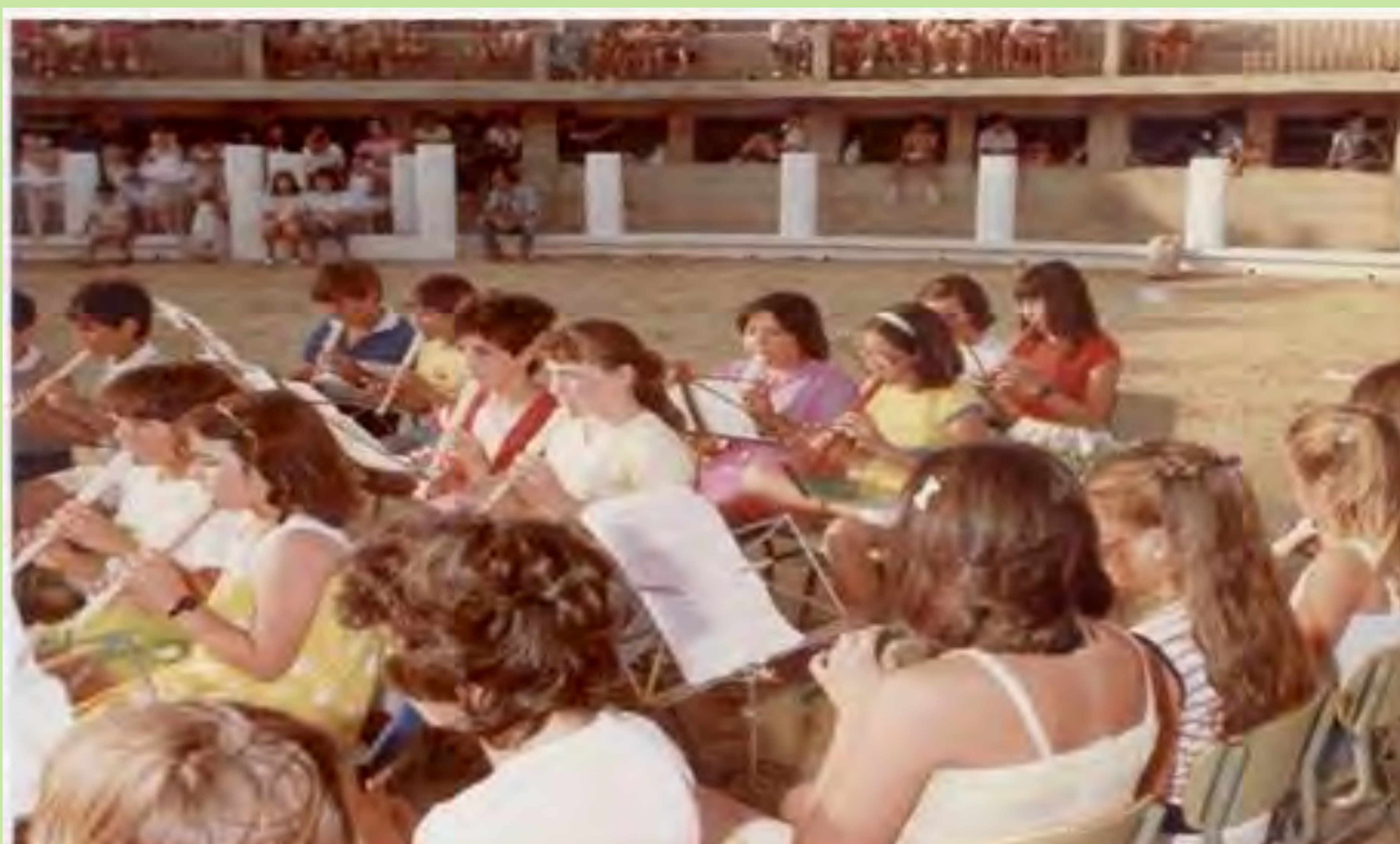
"En aquesta foto estàvem fent un festival de final de curs. Quasi totes les actuacions d'aquest tipus les feiem a una plaça de bous particular". Col·legi Públic La Sènia L'Alcúdia de Crespins. 1984-1985.