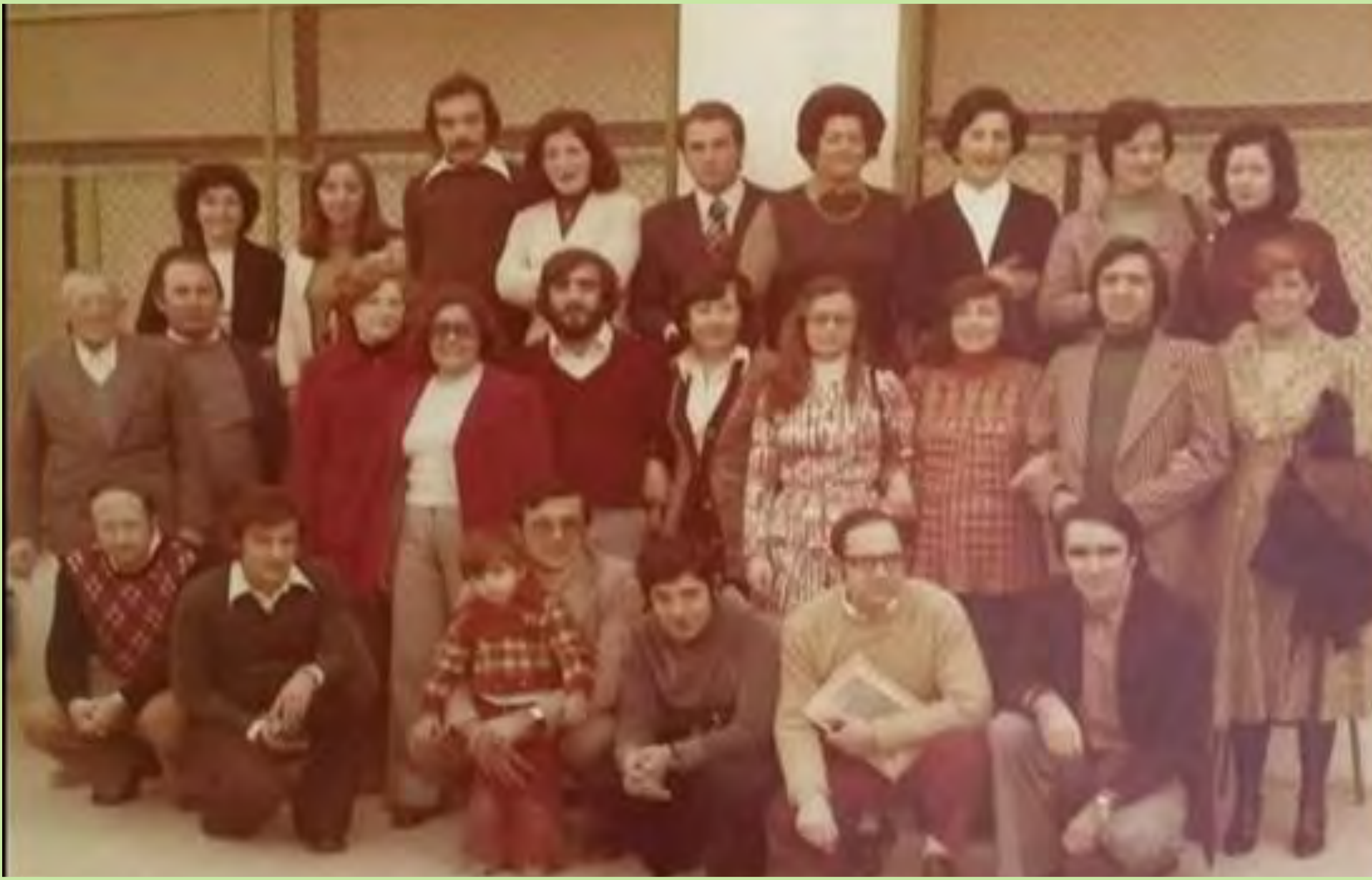
Mestres del CP Rafael Juan Vidal. Ontinyent. 1985.

En aquest context, la Llei va promoure una educació humanista, tècnica, personalista i eficaç, que va representar una certa modernització de les estructures educatives durant la dictadura, encara que van continuar els símbols i els principis franquistes.