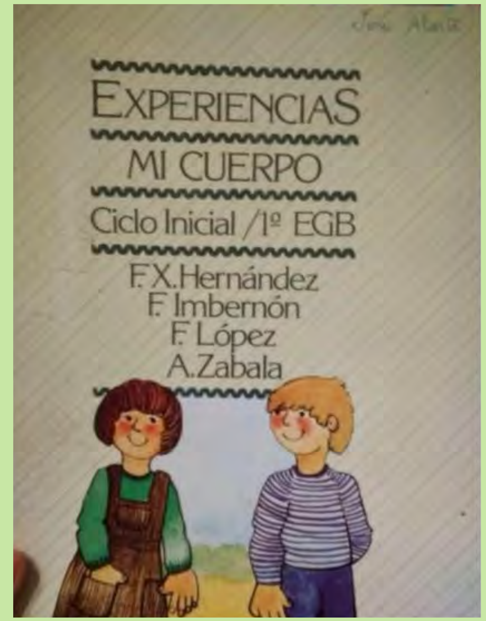
"L'utilitzàvem per ampliar els nostres coneixements sobre el cos humà". Bocairent. 1984.

Calia practicar metodologies innovadores amb la finalitat de fomentar l'originalitat i la creativitat, el desenvolupament d'aptituds, els hàbits de cooperació i un ensenyament individualitzat. Les lliçons foren substituïdes per nuclis temàtics; s'editaren llibres de text i de consulta per a cada matèria, quadernets de treball i, en especial, fitxes, gran quantitat de fitxes que cada alumne havia d'omplir i que constituïen la base de l'avaluació contínua.