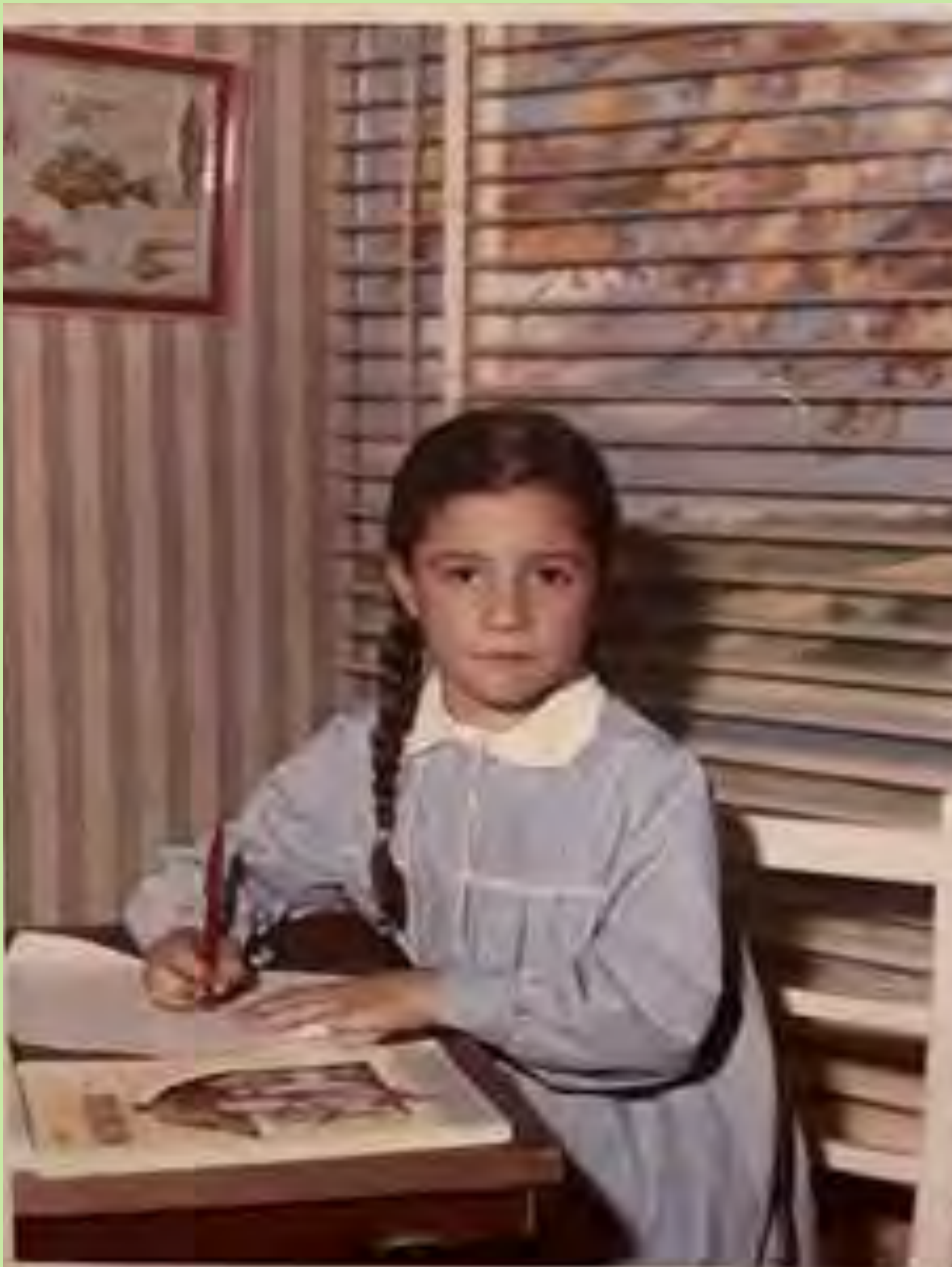
És la foto que ens fèiem de recordatori anual. Es tracta d'un decorat preparat per fer la foto. C.P. Corbera. 1973.

En aquest context, la Llei va promoure una educació humanista, tècnica, personalista i eficaç, que va representar una certa modernització de les estructures educatives durant la dictadura, encara que van continuar els símbols i els principis franquistes.