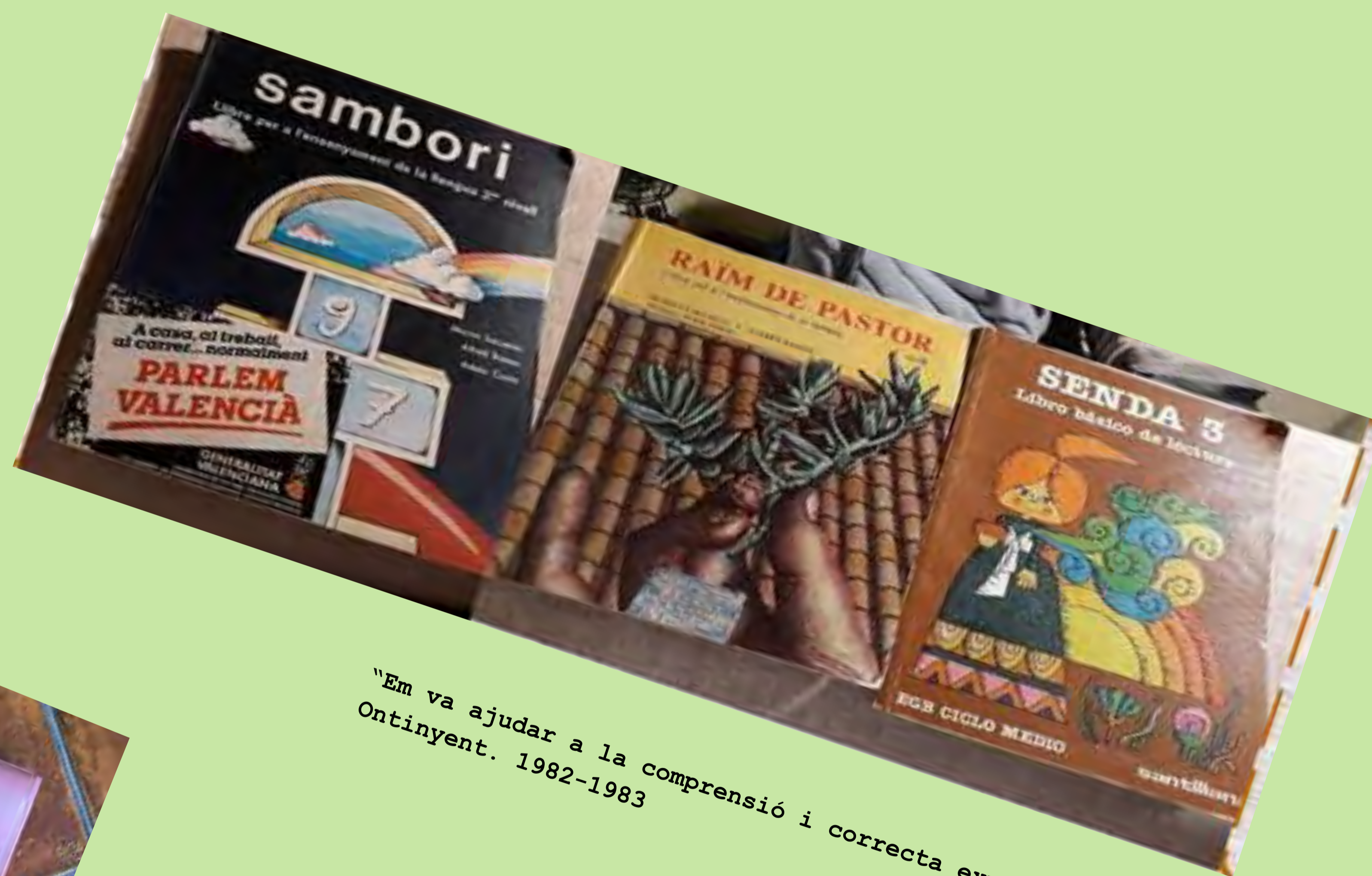
"Em va ajudar a la comprensió i correcta expressió" Ontinyent. 1982-1983