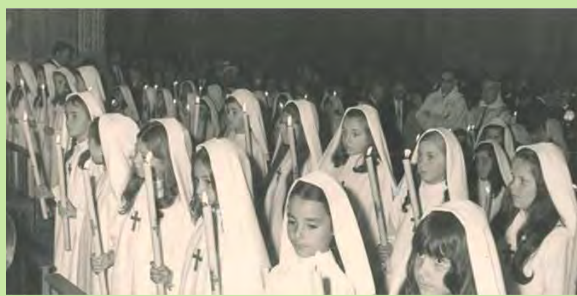
La primera comunió era un sacrament que el col·legi ofería, i més al ser religiós. Es realitzaven curssets de catequesis que es rebien al propi centre, que disposava d'un rector encarregat de tots els actes religiosos. El vestit era molt semblant al de les monges. Era un moment molt especial. Institució Cultural Femenina Domus de Godella.