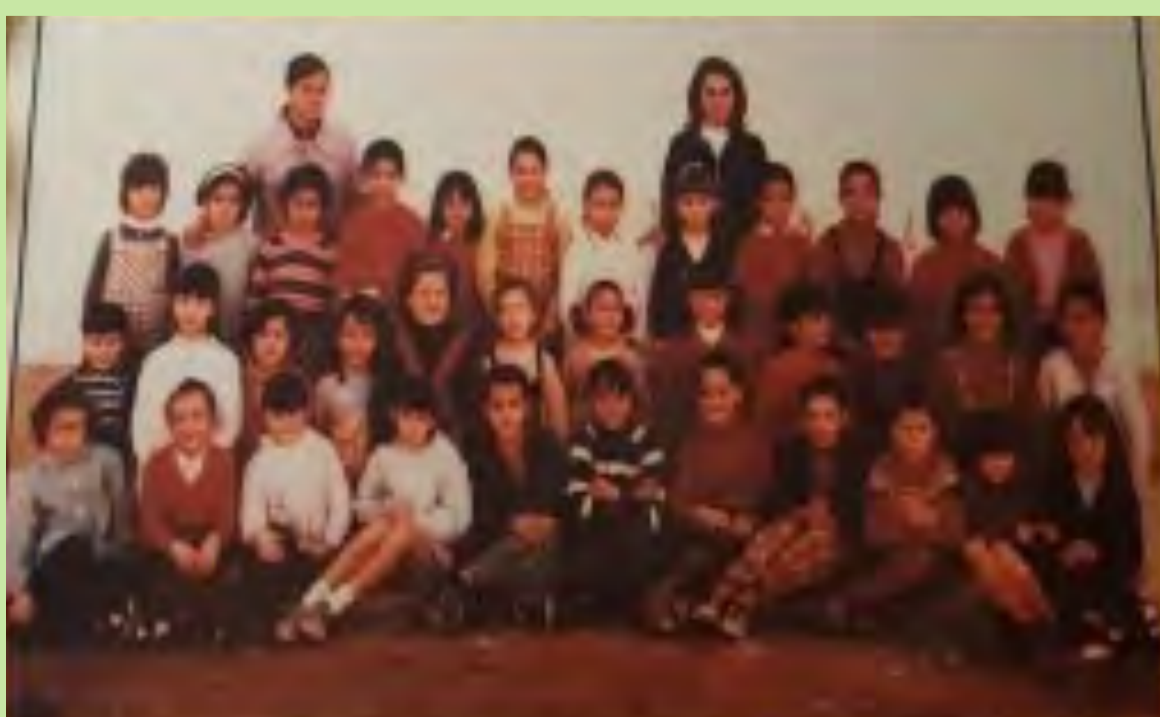
Grup de xiquetes amb la seua mestra. Col·legi Rodríguez Fornos. València. 1973

Malgrat les reformes i el seu esperit modernitzador, la Llei va mancar de finançament propi, d'una adequada planificació i la seua gestió va ser antidemocràtica.