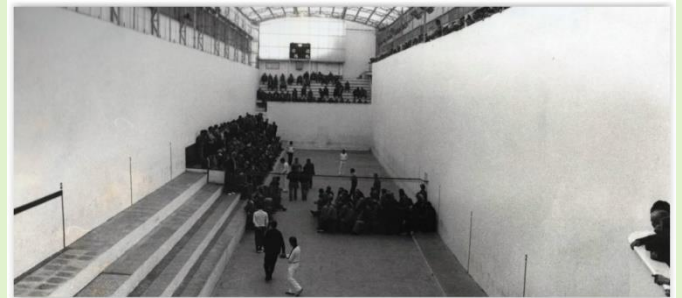
Trinquet de Pelayo any 1981.

A partir de 1893, amb l'obertura del Jai Alai al cap i casal, on es juga a la pilota basca, les cròniques ens parlaran dels enfrontaments entre bascos i valencians