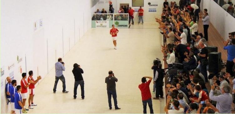
Els mitjans de comunicació en la Final de la Lliga de Raspall 2016 a Oliva.

Si analitzem la situació, és cert que al llarg de la història sempre ha sigut poca la presència d'informació al voltant de la pilota als diferents mitjans. No obstant això, gràcies a multitud de periodistes, no ha deixat mai de tenir el seu xicotet espai als mitjans i s'ha pogut, així, mantenir encesa la flama de la pilota.