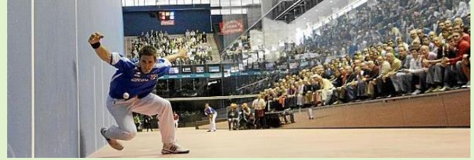
Final Individual d'Escala i corda el 2012 a Montcada retransmesa per RTVV.