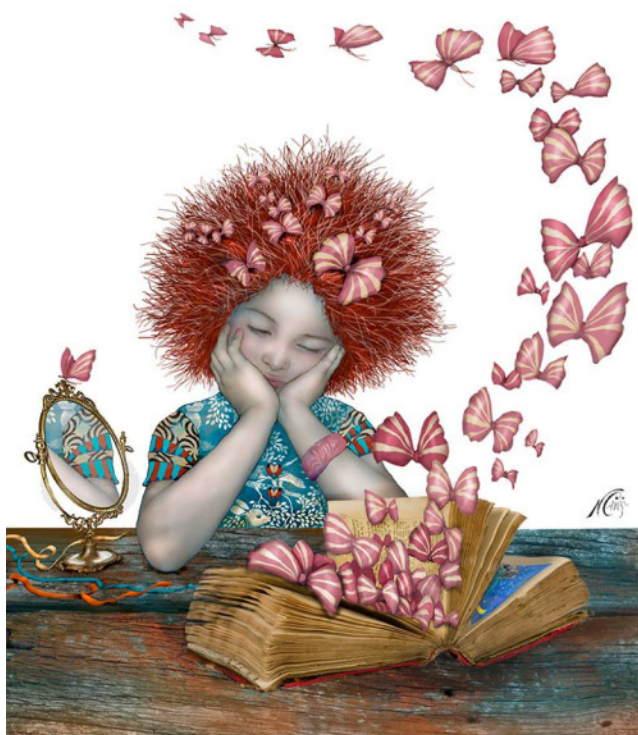
Il·lustració de Nerina Canzi

Aquest Treball Final del Diploma d'Especialització en cultura, lectura i lectura per a infants i joves va ser acabat de redactar i lliurat el dia 22 d'abril, la vespra de la festa del Dia Mundial del Llibre i dels Drets d'Autor, de l'any 2018.