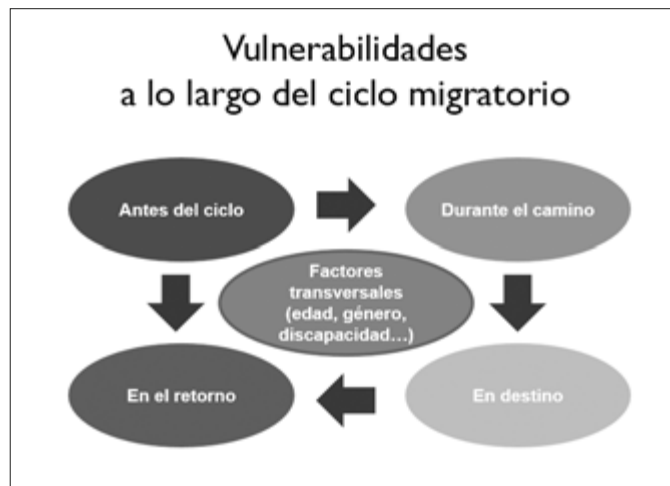
Fig. 2. El ciclo migratorio y sus problemas vinculantes.

Actualmente hay más de 65 millones de desplazados forzados en todo el mundo, lo que incluye refugiados, desplazados internos y solicitantes de asilo. Si todas estas personas fuesen reasentadas en un mismo sitio, estaríamos hablando del vigésimo primer país más grande del mundo –más grande que Reino Unido en términos de población, y casi tres veces más grande que Australia. La población de este país incluiría a 21,3 millones de refugiados, 40,8 millones de desplazados internos y 3,2 millones de solicitantes de asilo. La mitad de las personas que vivirían en él tendrían menos de 18 años, lo que haría de su población una de las más jóvenes del mundo. El imaginar a todas las personas desplazadas como ciudadanos de «un país» reconoce su valor como miembros iguales dentro de una sociedad global y pone el foco en la magnitud de su situación colectiva, que actualmente alcanza la cifra de 54,95 millones de personas migrantes, de las cuales el 51% son niños y niñas. 5