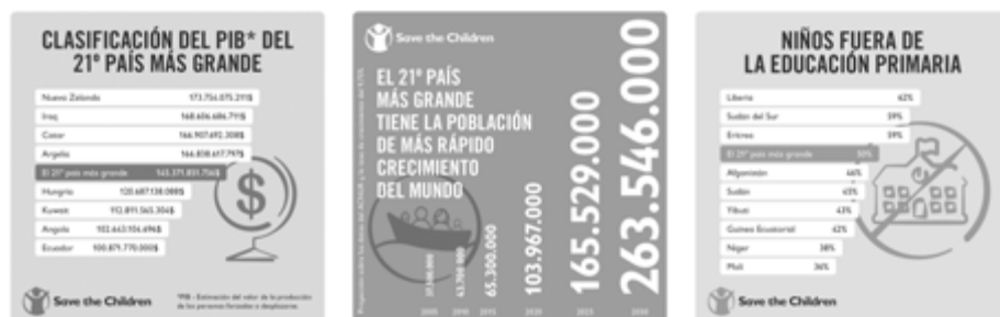
Figs. 3, 4 y 5. Las personas obligadas a desplazarse en cifras: reasentadas en un mismo sitio constituirían el 21º país más grande del mundo.

Actualmente hay más de 65 millones de desplazados forzados en todo el mundo, lo que incluye refugiados, desplazados internos y solicitantes de asilo. Si todas estas personas fuesen reasentadas en un mismo sitio, estaríamos hablando del vigésimo primer país más grande del mundo –más grande que Reino Unido en términos de población, y casi tres veces más grande que Australia. La población de este país incluiría a 21,3 millones de refugiados, 40,8 millones de desplazados internos y 3,2 millones de solicitantes de asilo. La mitad de las personas que vivirían en él tendrían menos de 18 años, lo que haría de su población una de las más jóvenes del mundo. El imaginar a todas las personas desplazadas como ciudadanos de «un país» reconoce su valor como miembros iguales dentro de una sociedad global y pone el foco en la magnitud de su situación colectiva, que actualmente alcanza la cifra de 54,95 millones de personas migrantes, de las cuales el 51% son niños y niñas. 5