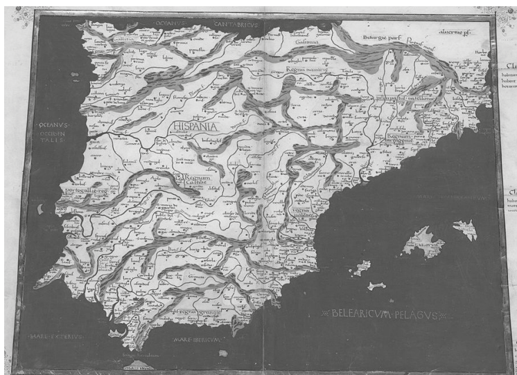
Il·lustració d’una edició de 1467 de l’obra geogràfica de Ptolomeu.

determinats parages en Xérica i Algemesí abans de 1238, en Patraix abans de 1239 o en Beniarjó abans de 1249 per mig de la modalitat tècnicament coneguda com nomen possessoris —és dir: rebent el lloc el nom del seu propietari— de manera que, per eixemple, en el nostre cas, ans que tota una extensa zona de l’entorn de Xérica fora concedida al consell de Terol en 1238 per JAUME I (Cabanes 1979 I p66 r414: Concilium Turol: castrum et villa de Xeriqua [...] et in donacione ista sunt Pardinias || item Ferrando 1979 p40 r412 a1238) un —seguint en la mateixa suposició—gironí Pardinias hauria prematurament ocupat aquell parage— històricament, per cert, de parla castellana aragonesa, contra-venint aixina el sacrosant dogma repoblacioniste d’“aragonesos al secà i catalans a vora mar” —i gràcies a la seua ocupació el lloc hauria rebut tal nom, hipòtesis que, com a mínim, roça l’absurt.