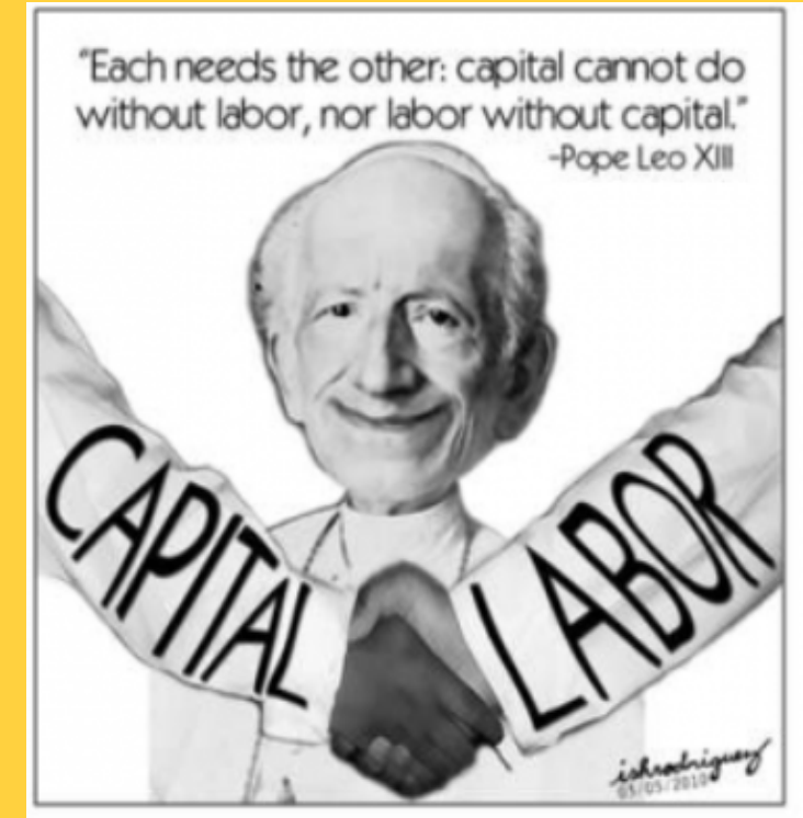
Vinyeta del Papa Lleó XIII