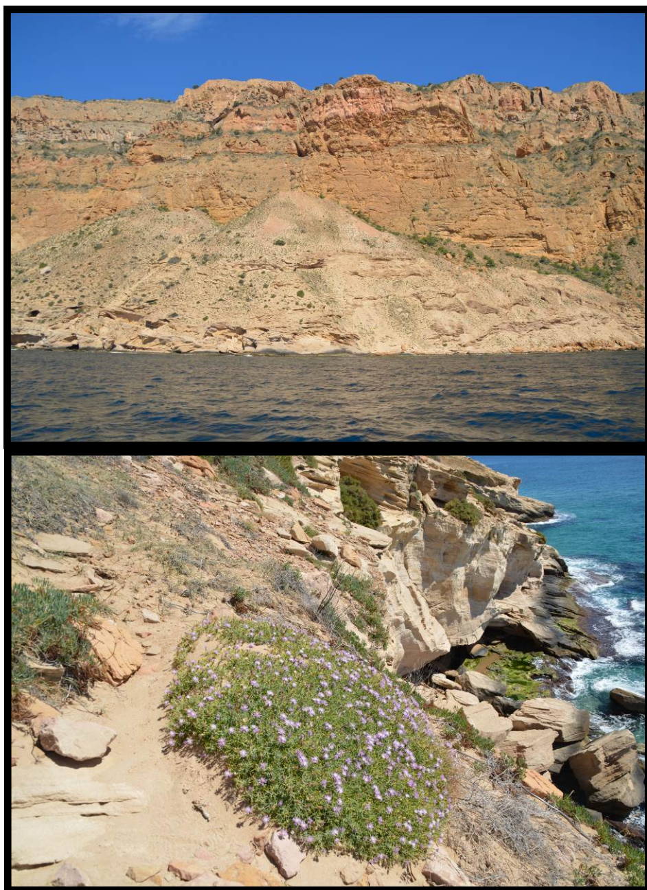
Fig. 1. Hábitat y aspecto general de Centaurea aspera subsp. geladensis (Serra Gelada, Beni-dorm).