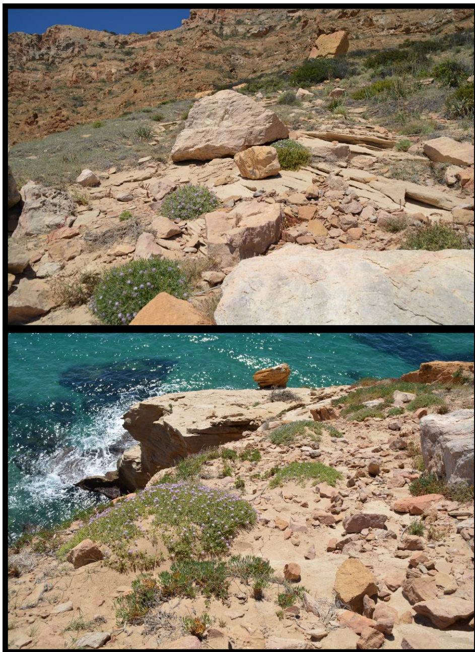
Fig. 2. Hábitat de Centaurea aspera subsp. geladensis (Serra Gelada, Benidorm).