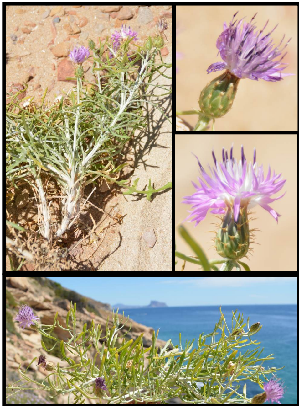
Fig. 3. Centaurea aspera subsp. geladensis (Serra Gelada, Benidorm); detalle de un fragmento de planta y de los capítulos.