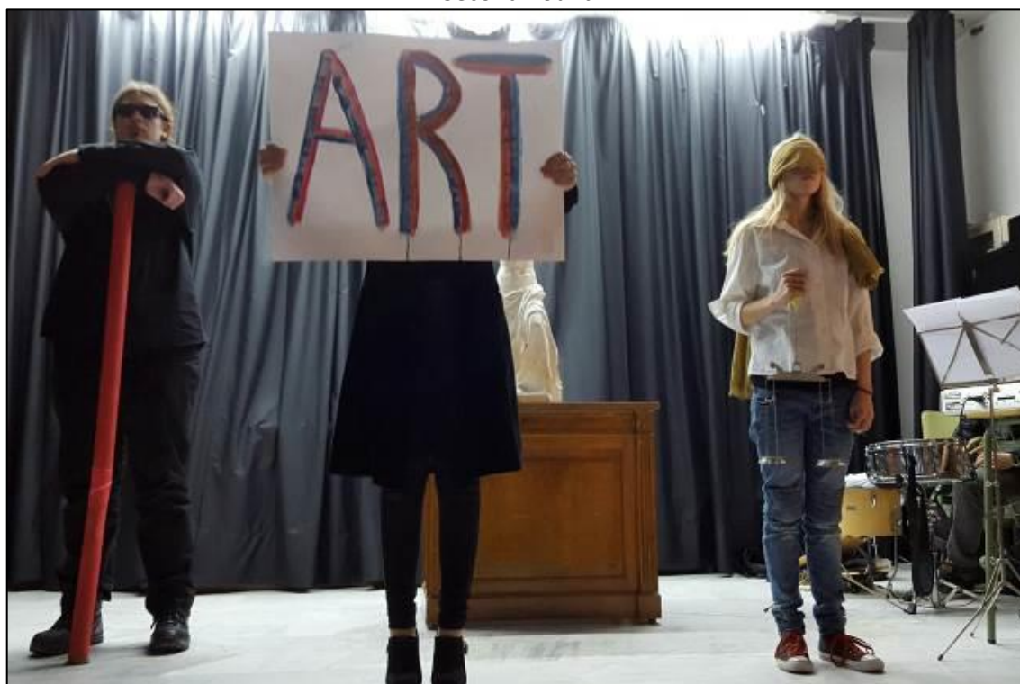
Figura 4. Performance realizada por alumnado del IES Josep de Ribera de Xàtiva dentro de las actividades del Second Round

Con este proyecto se ha visibilizado la idea de repensar la educación artística en Secundaria (Hernández, 2008) al mismo tiempo que se rinde cuenta de todo el esfuerzo y el trabajo que, día a día, realizan profesorado y alumnado en los institutos (Huerta y Domínguez, 2015). Cada uno de los centros participantes se reinventa continuamente para actuar ante esta situación de precariedad y de falta de interés por la actividad creativa, algo en lo que se centra buena parte del debate actual sobre las dificultades laborales que entraña el trabajo en artes (Zafra, 2017). En algunos casos hemos comprobado hasta qué punto surge un poder de convocatoria en la defensa de las acciones creativas. Hemos visto cómo todo un barrio, e incluso una población entera, acaba participando con la iniciativa "Second Round", consiguiendo, de este modo, a nivel local, reivindicar una situación que afecta, en realidad, a un ámbito mucho más amplio. Lo que se pretende demostrar es que entre todos podemos hacer un mayor esfuerzo ante las situaciones de desprestigio que pueda padecer una realidad concreta. En este caso, la mejor estrategia que podemos utilizar consiste en