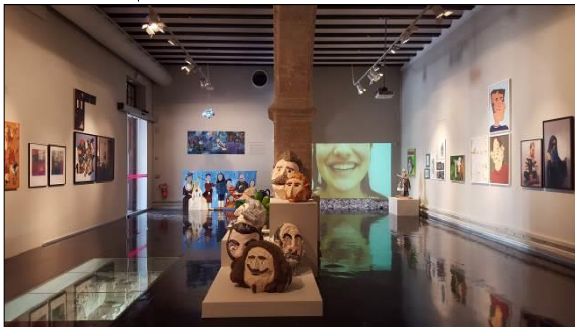
Figura 6. Panorámica de la exposición Second Round en el Centro Cultural La Nau de la Universitat de València