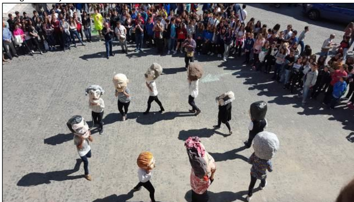
Figura 7. Performance con baile de cabezudos en las actividades de Second Round en Silla

El hecho de estar realizando una tesis doctoral que toma forma con todo lo vivido en el desarrollo de este proyecto constituye un material tangible de lo que se sigue viviendo en tiempo real en esta iniciativa. La autora de la tesis plasma, en sus escritos y en todas las imágenes tomadas en el proceso, la experiencia en primera persona y en directo de lo sucedido en “Second Round”. La confianza depositada en su director se nutre también de las experiencias compartidas, en las cuales se fomenta un espíritu colaborativo que fomenta una mejor consecución de la propia tesis.