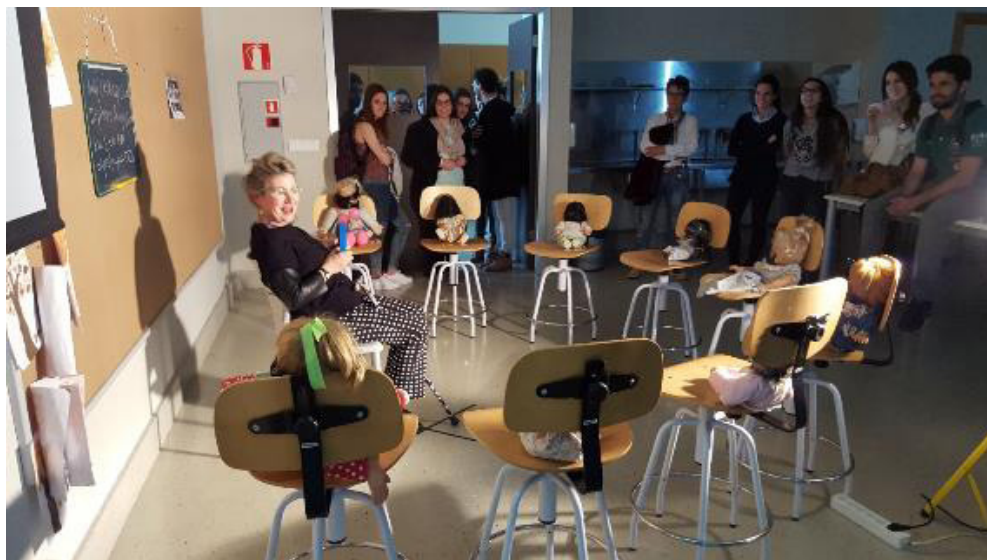
Figura 4. Instalación realizada por alumnado del taller del proyecto sobre el miedo.

Cuando finalizó el taller y pudimos ver el excelente resultado de los trabajos, nos pusimos de nuevo en contacto con la artista Carmen Calvo, quien aceptó la invitación de venir a visitar la exposición. Se sintió muy emocionada porque le resultaba novedoso que fuesen los futuros maestros quienes trabajasen a partir de sus obras. Este tipo de recreaciones es habitual en los estudios Bellas Artes, pero no en los de Magisterio. En una entrevista para la televisión de la universidad la artista llega a afirmar que «el nivel de los trabajos del alumnado de Magisterio es muy alto, y podría equipararse a las propuestas que se están haciendo en facultades de artes» 2 .