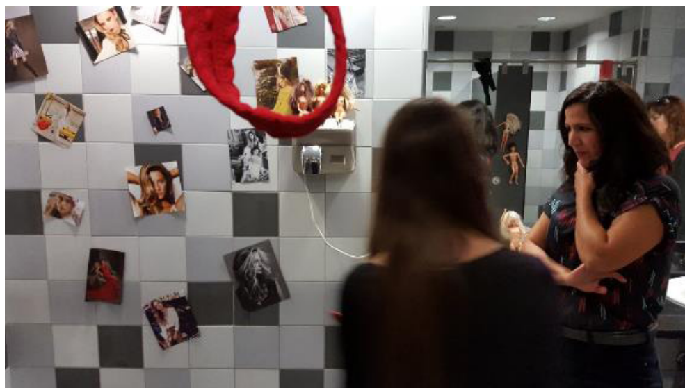
Figura 8. Una alumna explica a la artista Anna Ruiz Sospedra su instalación sobre «El cuerpo» creada con fotografías y objetos en los servicios de la facultad.

«El miedo» y «El cuerpo» son en realidad temáticas tabú en el currículum escolar. Por ello tampoco se tratan como temas habituales en la formación de maestros. Al plantearles estos temas desde el arte y la educación artística generamos un estímulo eficaz entre el alumnado, que se siente implicado desde el inicio de cada proyecto. Durante el proceso de realización de las instalaciones surgen dudas, preguntas, sugerencias, cambios, para finalmente lograr resultados muy interesantes, que hablan de aspectos muy humanos a través de las poéticas de las artes.