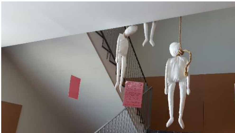
Figura 3. Instalación de alumnos de Magisterio en la que se analiza el miedo a partir del sufrimiento por el bullying, especialmente el acoso homofóbico.

En la figura 3 vemos una instalación con la que el alumnado quiere representar los miedos de quienes sufren agresiones por acoso. Tres figuras ahorcadas acompañan los tres testimonios escritos (de casos reales) en los que niños que se han suicidado explican su desesperación ante la violencia de sus compañeros y el acoso que sufrían por bullying homofóbico. Tanto la idea inicial como su desarrollo en el taller provocan un alud de aportaciones que imprimen al trabajo una fuerte carga emotiva. Los muñecos de tela han sido confeccionados por los miembros del grupo.