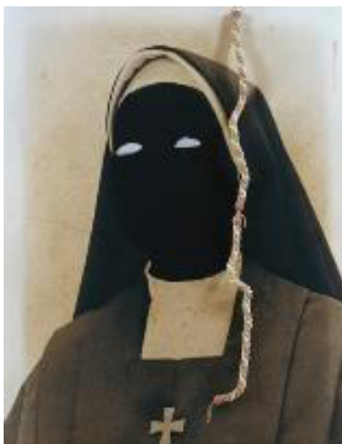
Figura 1. No es lo que parece . Obra de la artista Carmen Calvo. Técnica mixta.

El alumnado de Magisterio no se va a dedicar a la producción artística ni tampoco al comercio con obras de artistas, pero sí que pueden convertir el arte en una herramienta capaz de generar grandes satisfacciones pedagógicas (Hernández-Hernández, 2016). Por eso les animamos a utilizar las posibilidades del arte como argumento educativo, como fuerza capaz de revolucionar la sociedad, como aliento que inspira los cambios y las mejoras sociales. Hemos convertido este taller en un proyecto de innovación educativa titulado «El miedo, geografías del temor», donde abordamos desde el arte este aspecto tan importante para nuestras vidas. El tema no forma parte