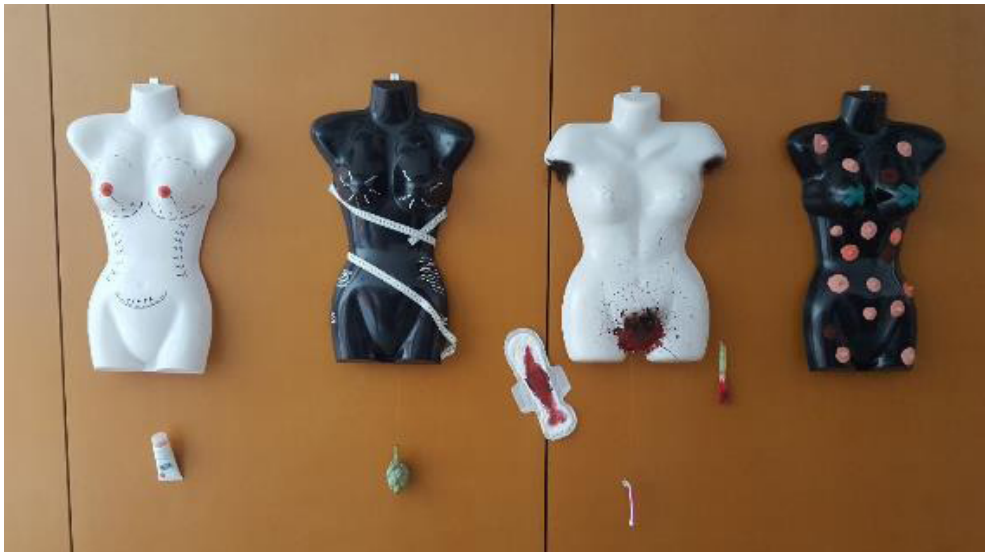
Figura 5. Instalación de un grupo de alumnas de Magisterio en la que se denuncian las presiones que se ejercen sobre el cuerpo femenino.

Con el proyecto «El cuerpo» analizamos en clase las formas con que se trata este tema a nivel curricular en las escuelas. Nos damos cuenta de que las miradas hacia el cuerpo por parte del entorno formal están llenas de prejuicios.