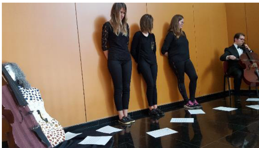
Figura 6. Performance del alumnado en la que se transmiten los abusos hacia el cuerpo mediante música y teatralización.

Las instalaciones que realiza el alumnado de Magisterio utilizan elementos de reciclaje y objetos cotidianos. En la figura 5 aparecen cuatro maniqués que representan cuatro formas de presión sobre el cuerpo de la mujer: 1) la obcecación por un cuerpo «de dimensiones perfectas», lo cual lleva a obsesionarse por las medidas y el peso. 2) Las dietas agresivas. 3) El empeño por ocultar los pelos (axilas) o la sangre (regla) como si se tratase de cosas «feas o sucias». 4) La obstinación de las redes sociales por prohibir la imagen de los pezones en los pechos de la mujer (no ocurre lo mismo en el caso de los hombres). El uso del cuerpo como representación de lo humano sigue preocupando al alumnado de Magisterio, ya que el cuerpo constituye el concepto cultural más sofisticado y debatido, especialmente cuando pensamos en los niños y las niñas, quienes serán sus alumnos en el futuro. Por ello consideramos de máximo interés y urgencia que los futuros maestros analicen el cuerpo como una construcción cultural. Así lo remarca Jordi Planella cuando afirma que en el momento en que los sujetos son educados para saberse insertados históricamente, tiene sentido «hablar de la historia del cuerpo y de su narratividad. Pero hablar de la condición de historicidad del cuerpo exige hacer referencia a la misma condición de narratividad de los cuerpos. Los cuerpos, ¿se pueden narrar?» (Planella, 2006, p.52).