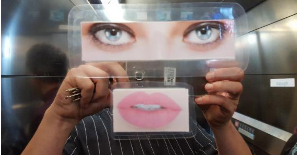
Figura 9. Intervención artística sobre «El cuerpo» en un ascensor de la facultad.

El efecto sorpresa es una de las características que mantiene el interés por descubrir alicientes que provocan las instalaciones en lugares estratégicos. El ascensor es un lugar de paso, un espacio pequeño y asfixiante. El espejo del ascensor permite aparentemente ampliar el espacio observado de una pequeña cabina, pero también puede convertirse en un elemento de reflexión si nos «empoderamos» de dicho espacio para animar a quien lo utiliza a pensar en su propio cuerpo como moneda de cambio (Figura 10). Lo que conseguimos con estos «site specific» es generar interés por el arte tanto entre el alumnado que genera las piezas como en resto de usuarios de la universidad. La utilización de los espacios es un elemento propio de las «artografías» (Irwin y O'Donoghue, 2012).