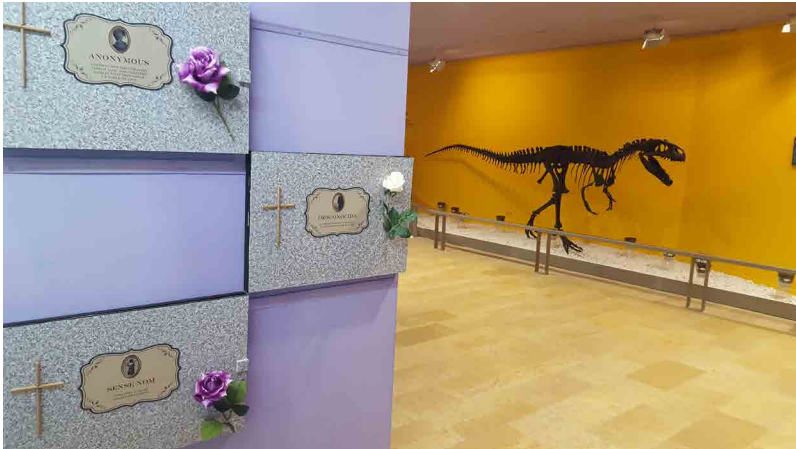
Figura 5 · Sesión preparatoria de la exposición. Visita con el alumnado de Magisterio al Museo de Ciencias Naturales.