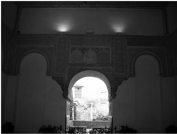
Fig. 2. Sala de la Justicia. Reales Alcázares de Sevilla. Medios del siglo XIV.

llano, estas formas a lo largo de las primeras décadas del siglo XIV, si atendemos a la cronología sugerida por José Manuel Cacho Bleuca para esta obra de ca. 1321-1350. 56