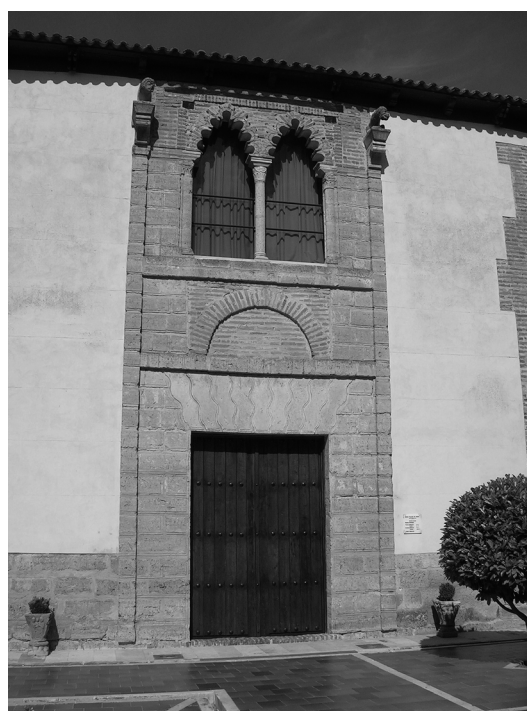
Fig. 3. Fachada del palacio de Pedro I de Astudillo (Palencia). Ca. 1354-1369.

Con un sentido más global, la configuración, en la Corona de Castilla, de diversas villas y ciudades –como Toledo, Burgos o Segovia, y