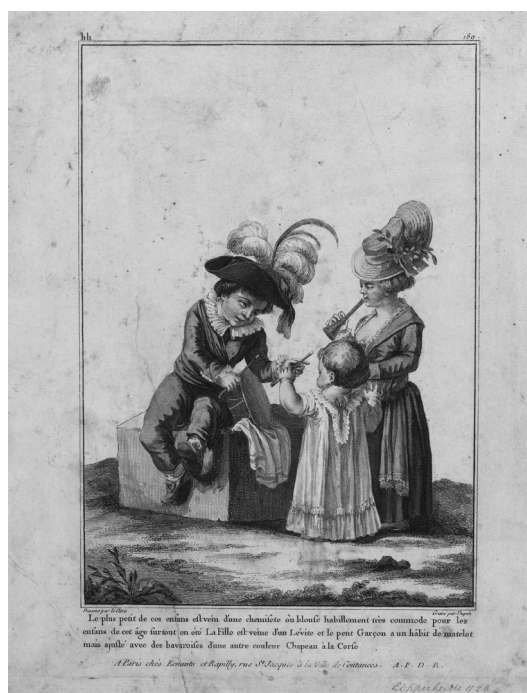
Fig. 2. Pierre-Thomas LeClerc (diseño), Nicolas Dupin (grabado). "Le plus petit de ces enfans...", nº 189, Gallerie des Modes et Costumes Français , 1780.

En el curso de la segunda mitad del siglo XVIII se tradujeron en España diferentes tratados de estos temas de autores extranjeros relevantes, como era el caso de William Buchan, 44 pero también entre los teóricos españoles se dio amplia cabida a estas ideas sobre la vestimenta infantil, como se puede comprobar en los escritos de Antonio Arteta, 45 Bonells, 46 Picornell y Gomila, 47 Bosarte, 48 Amar y Borbón, 49 Iberti 50 y Ginesta. 51 El médico Iberti expresaba así su opinión: "El vestido que más conviene a un niño es