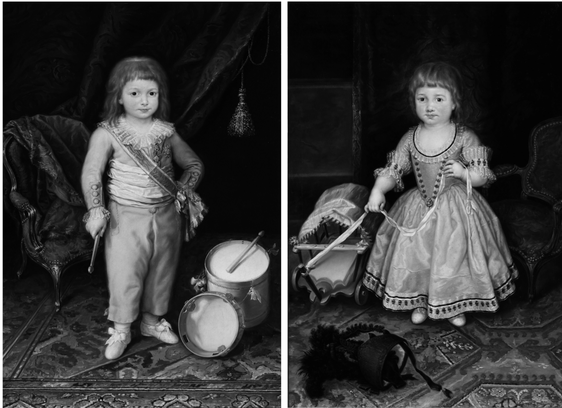
Fig. 6. Retratos de un infante y de una infanta, finales del siglo XVIII. Museo Nacional del Prado.

el medio de la frente descubierto, convienen tan bien al amable candor, y a las gracias sencillas de la infancia de ambos sexos, que todo el demás adorno es feo, inútil y aun perjudicial". 109