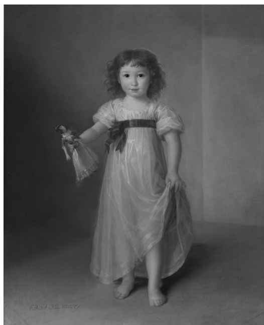
Fig. 5. Agustín Esteve. Manuela Isidra Téllez-Girón, futura duquesa de Abrantes, 1797 . Museo Nacional del Prado.

A finales del siglo XVIII todas estas novedades eran reconocidas y alabadas públicamente. En el Semanario de Salamanca del 11 de julio de 1795 se congratulaban de los "progresos de las luces" en este aspecto: "La institución física de los niños recibe en nuestros días una alteración saludable. Ya mil madres respetables han adoptado la moda, y gustan de parecer en los paseos públicos y en el campo rodeadas de las preciosas prendas de su fecundidad, librando a los que pueden caminar por sí de