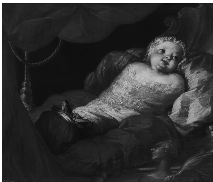
Fig. 1. Clemente Ruta. La infanta Isabel de Borbón y Sajonia, princesa de Nápoles , 1741. Museo Nacional del Prado.

comprensibles si tenemos en cuenta que los padres debían sentir miedo a que esas novedades, que rompían una tradición sólida y establecida, pudieran causar algún daño irreversible a sus hijos, máxime teniendo en cuenta que las nuevas ideas solían poner como modelo a seguir conductas que hasta entonces se consideraban propias de salvajes, de gentes sin civilizar. El cambio en las prácticas suponía un giro copernicano: de creer que si no se fajaba a los niños sus miembros se deformarían, se pasó a pensar que, precisamente, esas deformaciones eran causadas por las propias fajas.