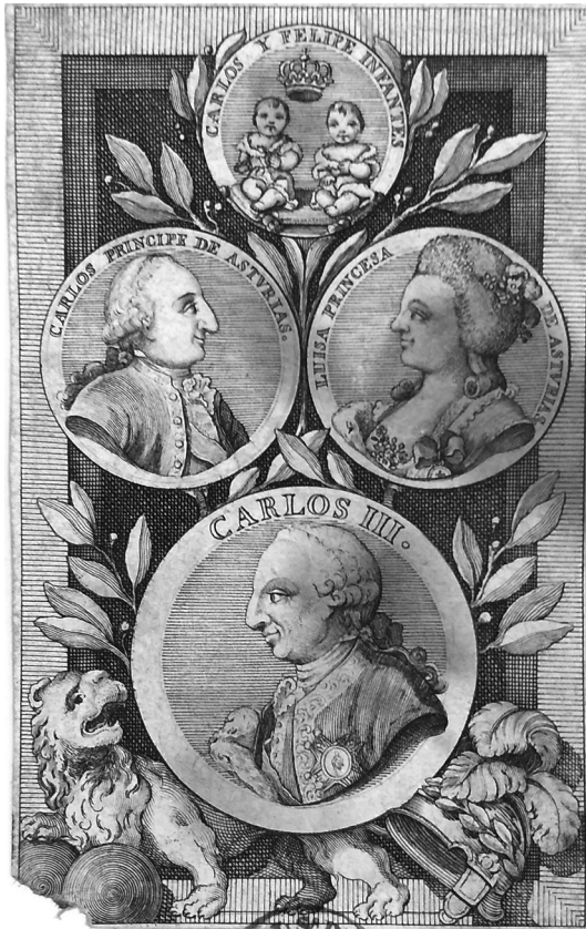
Fig. 3. Anónimo. Carlos III, los príncipes de Asturias y los infantes gemelos , 1783. Biblioteca Nacional de España, ER 455 (11).