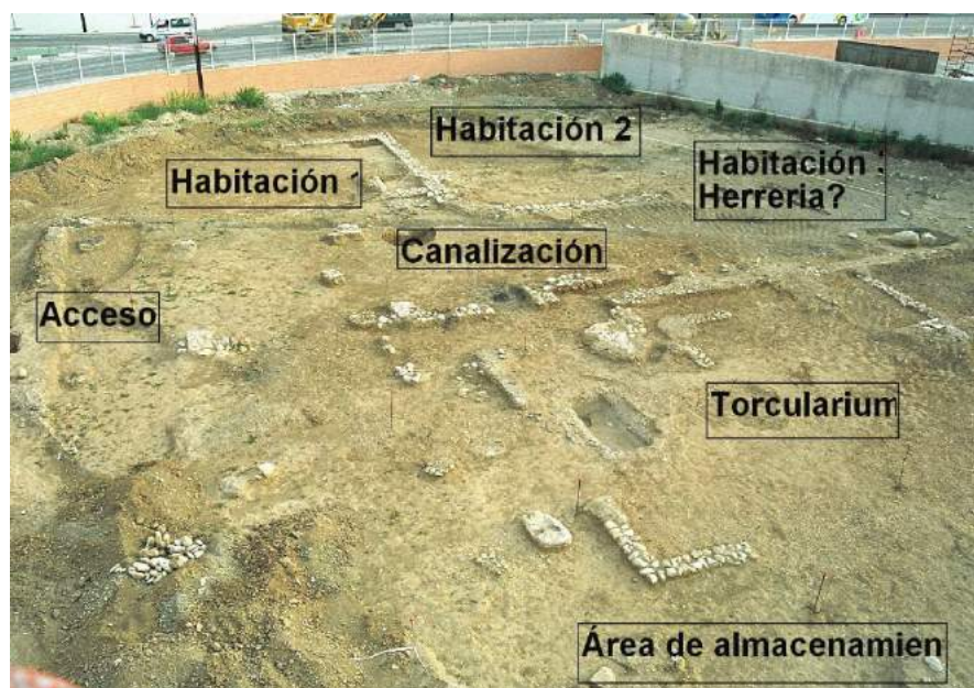
Fig. 1: Perspectiva aèria de l'excavació. La peça es trobà en el pou situat a la vora de la canalització visible a la zona central de la part superior (Escrivà i Sifres, 2006: fig. 57).