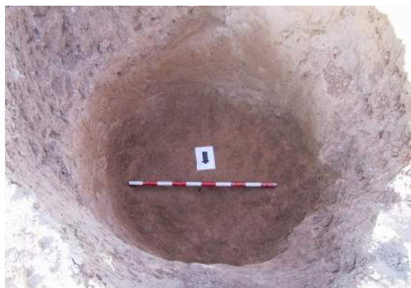
Fig. 2: Pou on es va trobar el fragment escultòric (Escrivà i Sifres, 2006: fig. 23).

avançada i té una grossària màxima de 3,7 cm. Per darrere, la superfície presenta alguns plecs molt suaus: a la banda dreta una vora es plega de manera sinuosa formant un feix un poc inclinat cap a la dreta; la resta forma tres plecs a penes perceptibles que davallen cap a l'esquerra cada vegada més inclinats. Per davant el mantell resulta visible entre les cuixes i per darrere de l'esquerra que queda exempta per estar un poc avançada, on se'n distingeixen dos plecs verticals. En l'extrem inferior dret se'n veu un rebaixament que pot correspondre a la vora inferior que davalla cap a l'esquerra. A l'altura de la part baixa de la cuixa esquerra hi ha adossat a aquesta l'extrem