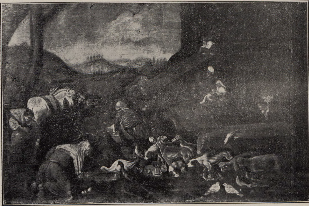
151.—PEDRO ORRENTE ASUNTO BÍBLICO