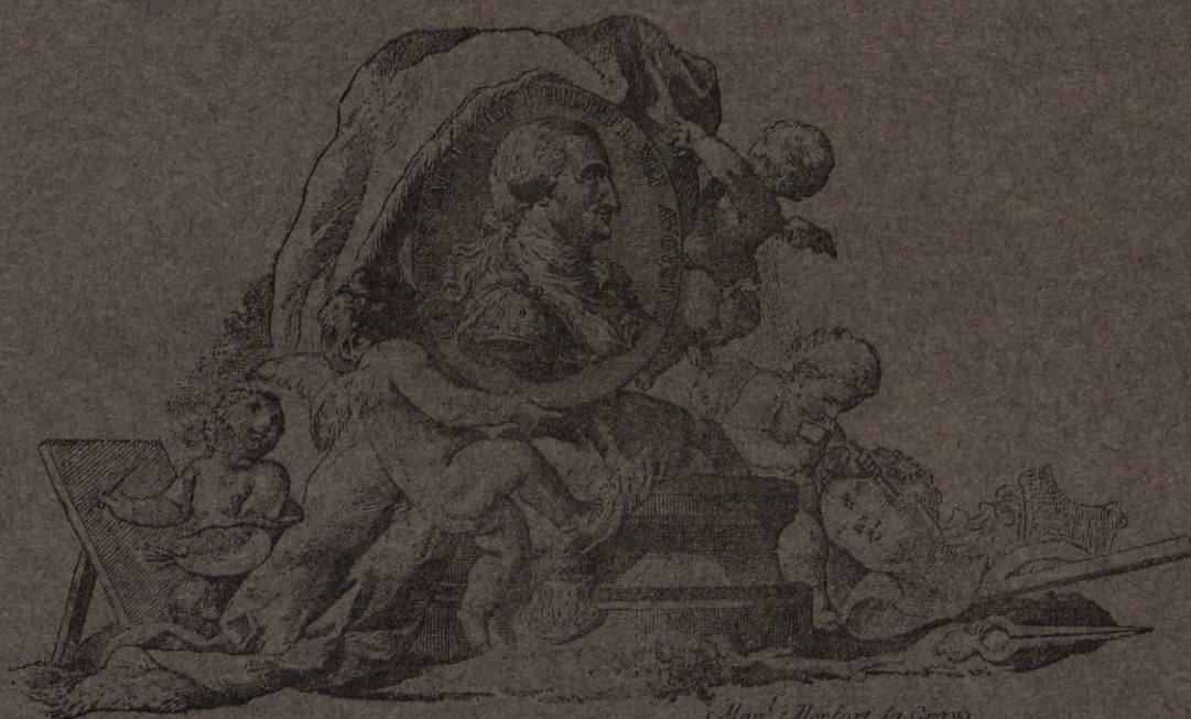
146. - MEDALLÓN DE CARLOS IV Y ALEGORÍA DE LAS BELLAS ARTES (Actas de la Real Academia de San Carlos, 1796)