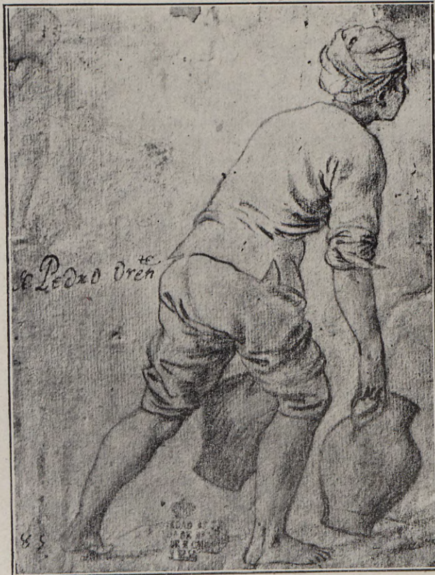
147. — PEDRO ORRENTE Dibujo del natural (Museo de Valencia)

A Palomino siguió Ceán Bermúdez. En el Diccionario de los Profesores de las Bellas Artes en España , Madrid, 1800, vol. III, corrigió el texto del primero, añadiendo había nacido en Montealegre, en el reino de Murcia, y respecto al fallecimiento, dice: «Volvióse a Castilla y falleció en Toledo el año 1644: está enterrado en la parroquial de San Bartolomé, en la que también lo está el Greco».