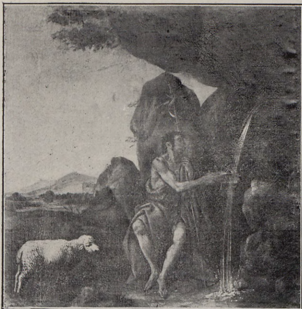
150. — PEDRO ORRENTE SAN JUAN EN EL DESIERTO (Instituto General y Técnico de Toledo)

comprometían a que el Greco se enterrase en Sto. Domingo el Antiguo, se hartaron los modernos eruditos de llamar embustero al pobre Palomino. Pero luego se descubrió otro contra-documento por el que aparece que Jorge Theothocopuli, el hijo del Greco, tuvo que sacar apresuradamente de Sto. Domingo los restos de su padre y comprar para sus descendientes una modesta sepultura en San Torcuato. ¿Quién no dice que el día de mañana no aparezca otro tercer documento por el que se acredite que el Greco fué llevado a San Bartolomé de Sansoles, que está junto a San Torcuato? ¿Por qué negar veracidad a los testigos que vieron el sepulcro del Greco, con una reja encima para que nadie pisase sobre su lápida? ¿Por qué querer nosotros saber las cosas mejor que los contemporáneos de los sucesos? ¿Por qué no han de dormir juntos el último sueño el maestro y el discípulo? Hoy la iglesia de San Bar-