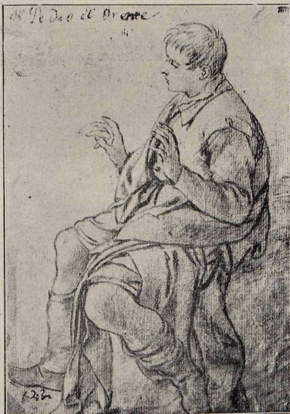
148. — PEDRO ORRENTE Dibujo del natural (Museo de Valencia)

No consta la fecha en que fueron pintadas estas obras, pero teniendo en cuenta que en 1606 concedíase el patronato de la capilla a D. Diego de Covarruvias, el cual falleció en