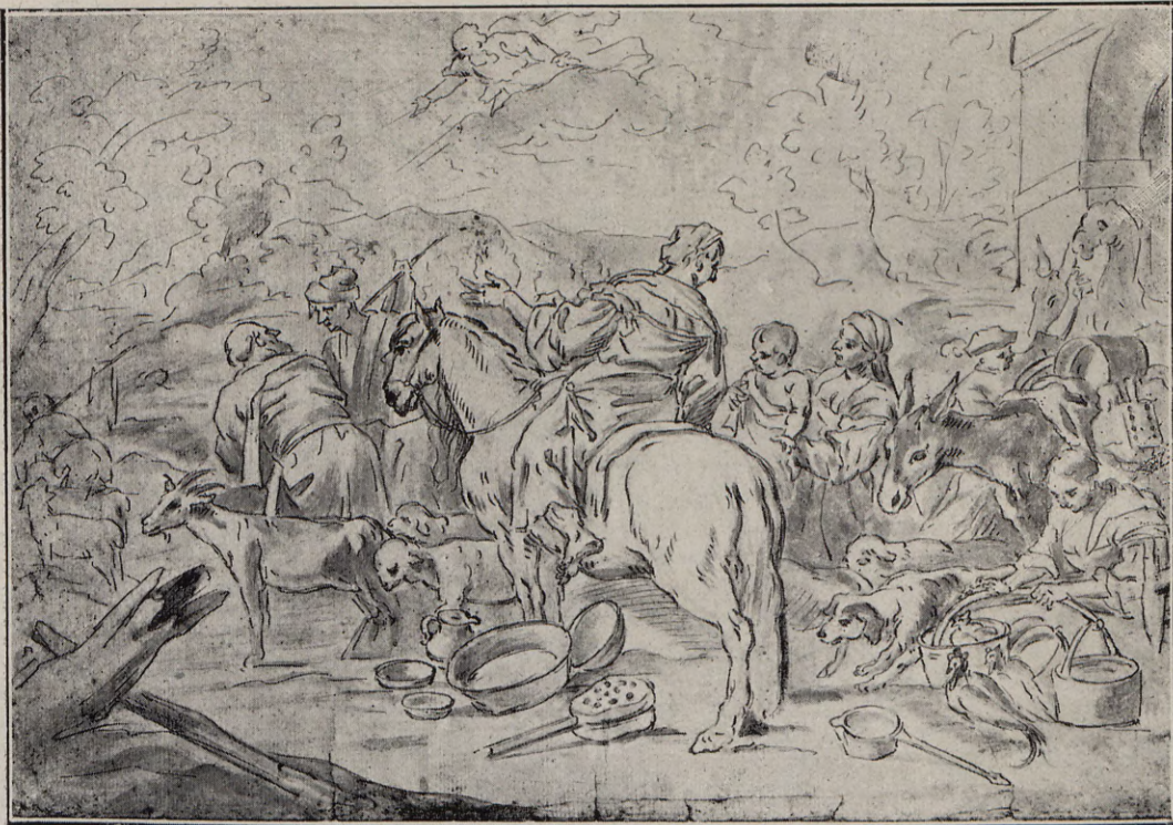
149.—PEDRO ORRENTE ASUNTO BÍBLICO. Dibujo (Museo de Valencia)