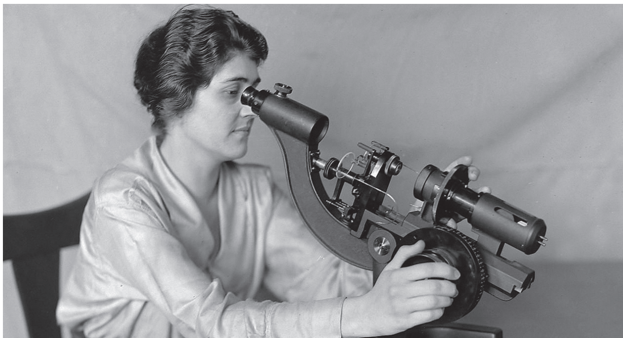
Profesional de una óptica examinando la potencia de una lente oftálmica en un frontofocómetro AO (1920).

refractantes llegan a ser conocidos como optometristas 3 . Específicamente, en Estados Unidos, es en los primeros años del siglo XX cuando las personas que realizaban la refracción, cuidado de la vista y la prescripción se comenzaron a llamar a sí mismos optometristas. La primera ley que les otorgaba la licencia para ejercer la optometría fue aprobada en Minnesota en 1901, siguiendo otros estados posteriormente. La formación de asociaciones estatales de optometría en los primeros años del siglo XX fueron impulsoras para establecer leyes reguladoras 4 .