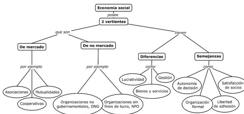
FIGURA 1 Dos vertientes de la economía social

La economía social se define en dos vertientes: la de mercado y la de no mercado, que se muestran en la Figura 1. En ambas vertientes las empresas son organizadas formalmente, con autonomía de decisión, libertad de adhesión y buscan satisfacer las necesidades de los socios. La vertiente de mercado produce bienes y servicios y la toma de decisiones ahí no está ligada a los aportes de capital, mientras que, en la de no mercado se producen servicios a favor de la familia y los excedentes no son de apropiación de los agentes económicos (Chaves et al., 2013; Pérez de Mendiguren, Etxezarreta y Guridi, 2008).